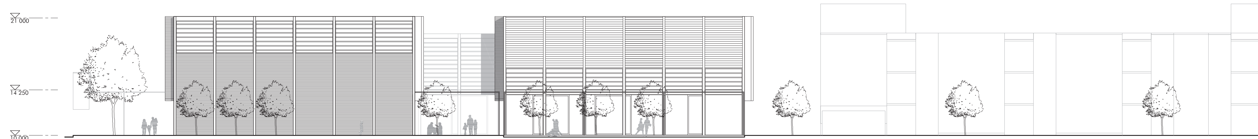
02.004 ÉLEVATION - JARDIN COMMUNAUTAIRE ET PARVIS DE LA SALLE POLYVALENTE - ÉCHELLE 1:200