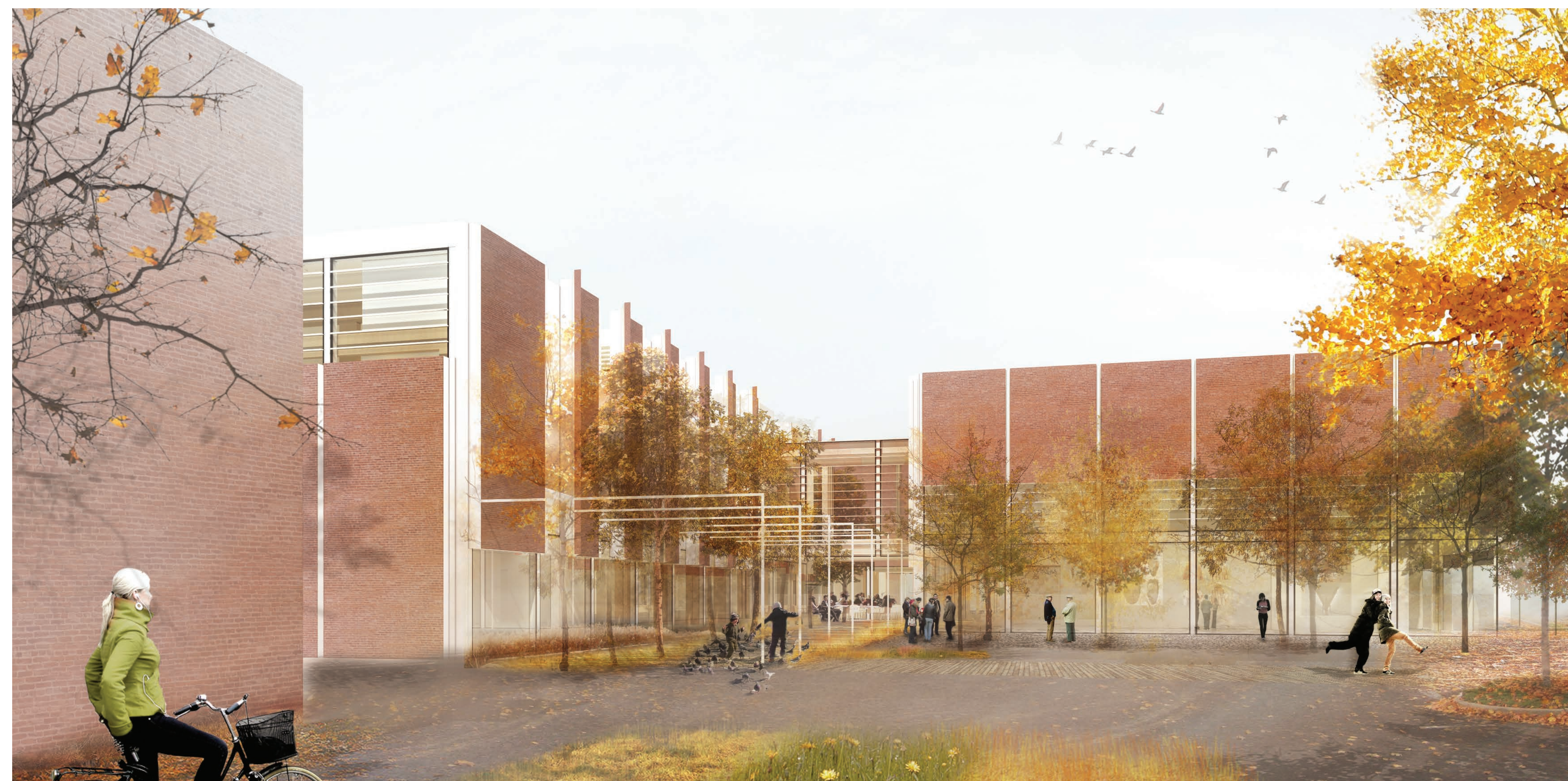
02.006 PERSPECTIVE DEPUIS LE JARDIN COMMUNAUTAIRE