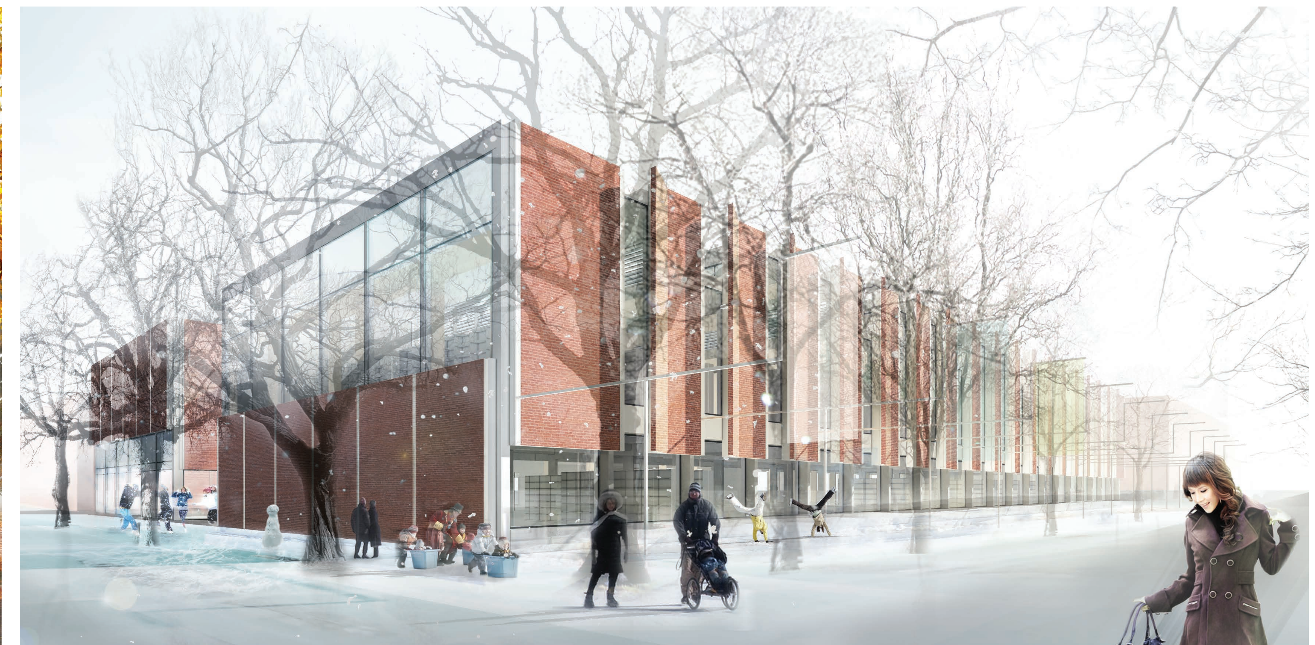
02.007 PERSPECTIVE EXTERIEURE DE L'ENTREE