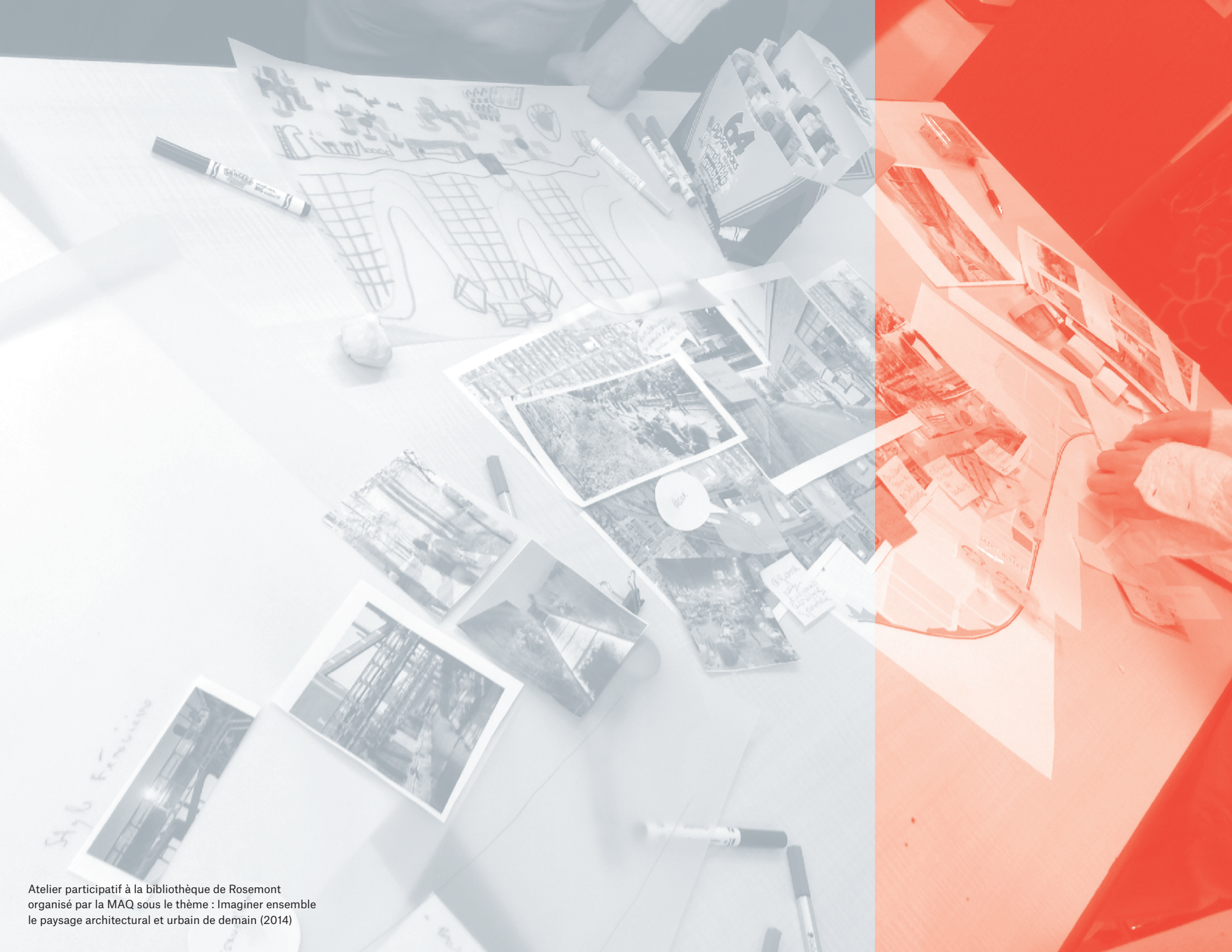
Atelier participatif à la bibliothèque de Rosemont organisé par la MAQ sous le thème : Imaginer ensemble le paysage architectural et urbain de demain (2014)