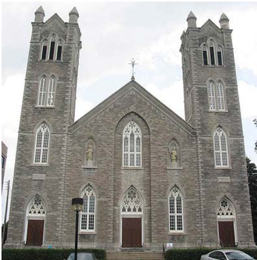
Figure 1. Façade avant de l'église Saint-Laurent

Bien que le contenu de la vidéoprojection ne doive pas être lié à l'église et à son histoire, celui-ci devra néanmoins s'intégrer à l'architecture et contribuer à la mise en valeur des lieux.