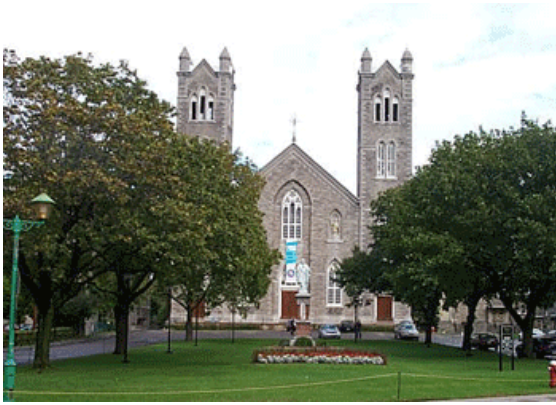
Figure 2. Terrain gazonné à l'avant de l'église Saint-Laurent