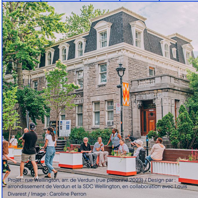
Projet : rue Wellington, arr. de Verdun (rue piétonne 2023) / Design par : arrondissement de Verdun et la SDC Wellington, en collaboration avec Louis Divarest

Ce parcours de formation et d'ateliers de co-conception vise à outiller les designers pour qu'elles et ils intègrent l'accessibilité universelle de façon créative dans leurs projets d'aménagement temporaire ou transitoire, sur rue commerciale ou ailleurs.