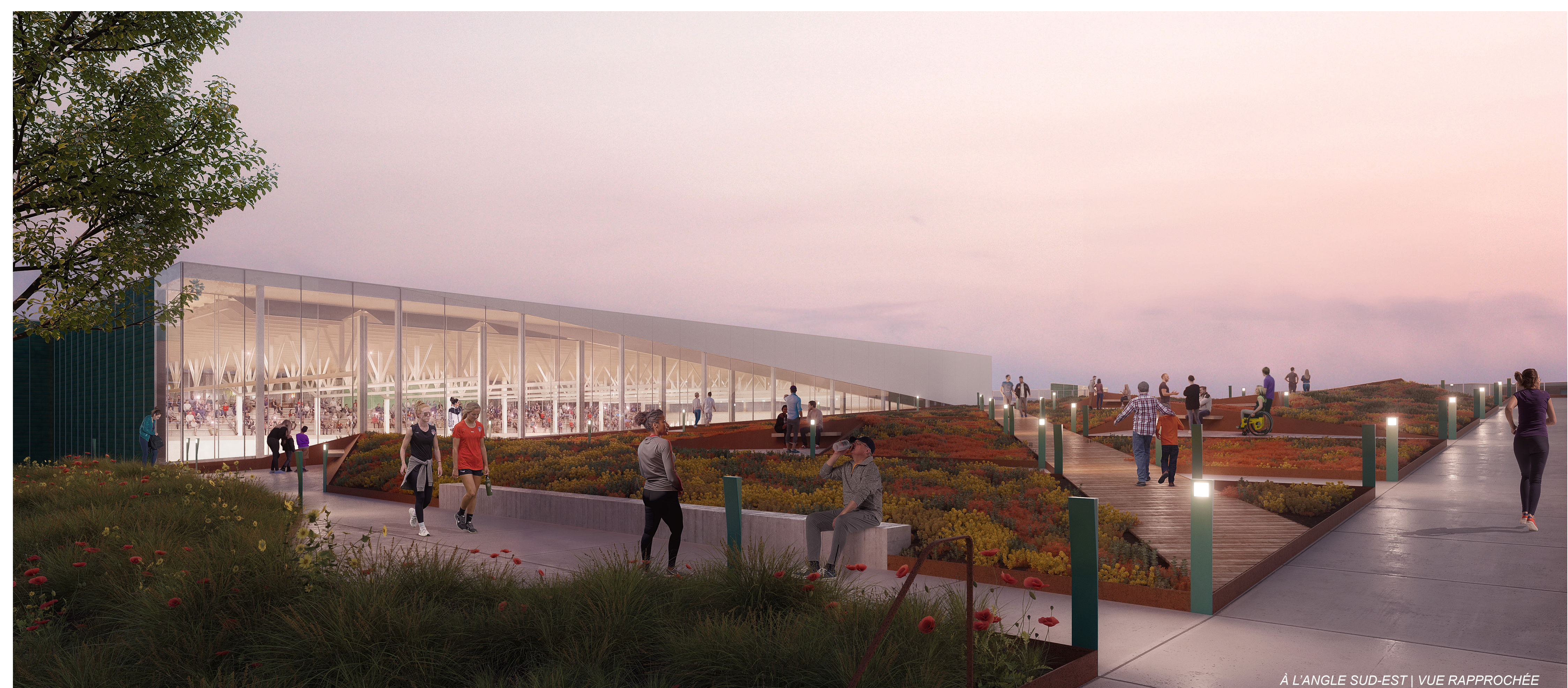
À L'ANGLE SUD-EST | VUE RAPPROCHÉE