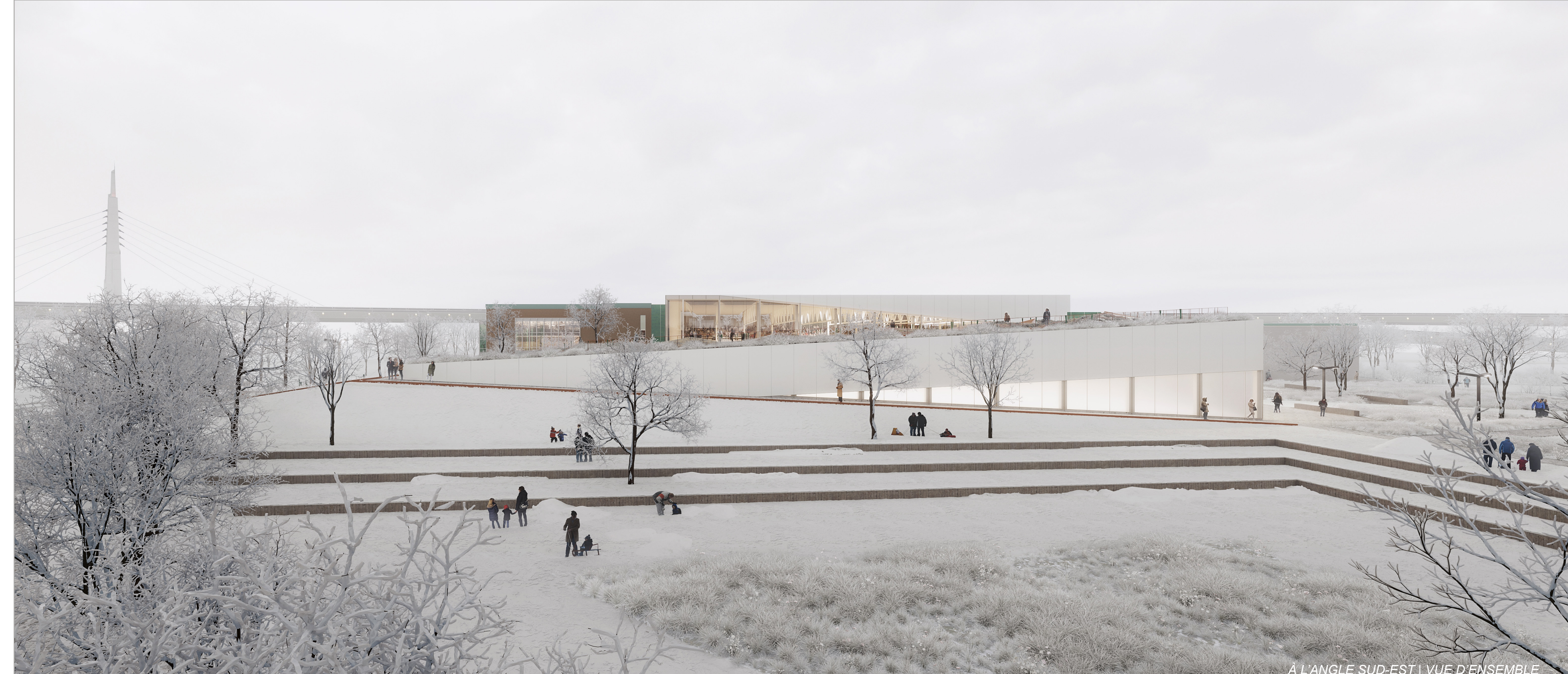
À L'ANGLE SUD-EST | VUE D'ENSEMBLE

environs afin d'en permettre la rétention ou l'infiltration. En dehors des périodes de captation, il est aussi un lieu de rassemblement, d'évènement, de détente et de jeux libres, offert à tous. Sur notre droite, au travers des accès piétons venant du nord, se mêlent des espaces végétalisés et des lieux de repos. C'est ici une ode à la nature du Québec recréant prairies fleuries et massifs arborés à l'intérieur desquels l'utilisateur est invité à prendre une pause avant de se rendre à l'esplanade de l'entrée est du bâtiment. De là, une rampe douce nous permet de remonter le long du bâtiment pour nous amener aux jardins surélevés aussi accessibles depuis le chemin de la Côte-Saint-Paul. Les visiteurs découvrent à chaque tournant une vue sur diverses composantes intérieures du complexe. Dans les jardins, un sentier piétonnier traverse les différentes strates composant les jardins, passant de la forêt dense de feuillus à la taiga du Bouclier canadien représenté par les peuplements d'épinette et les sédums typiques d'une toiture extensive.