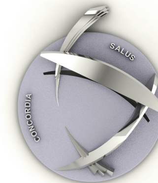
40* x 8, pastille 3,5 mm