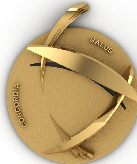
60* x 12, pastille 3,5 mm