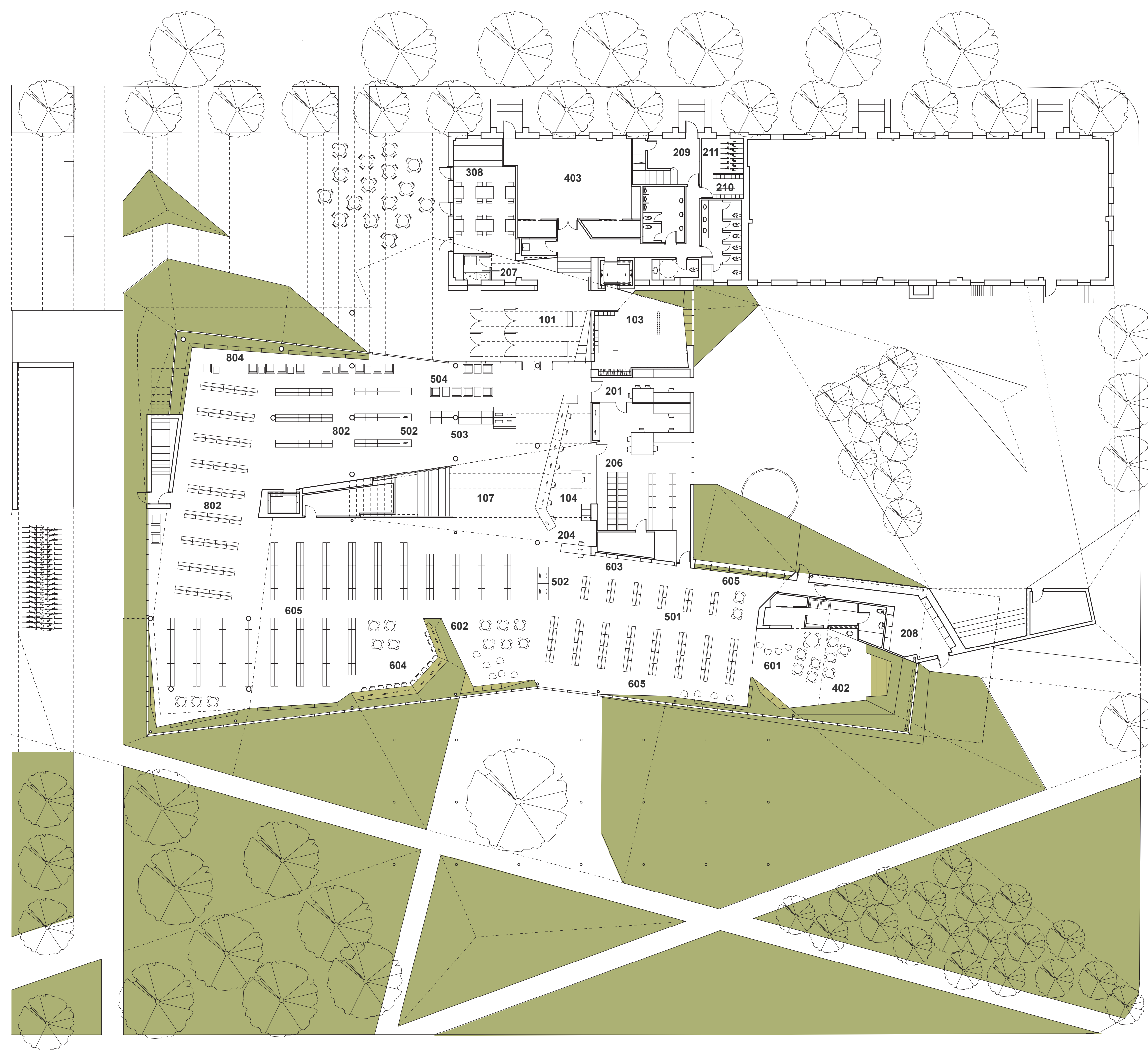
PLAN NIVEAU 1 1:200