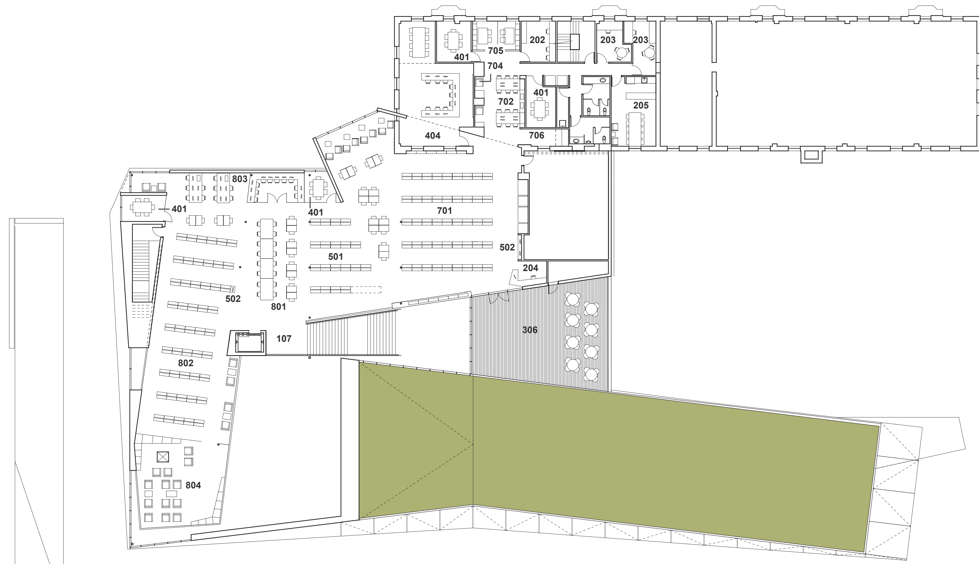
PLAN NIVEAU 2 1:200