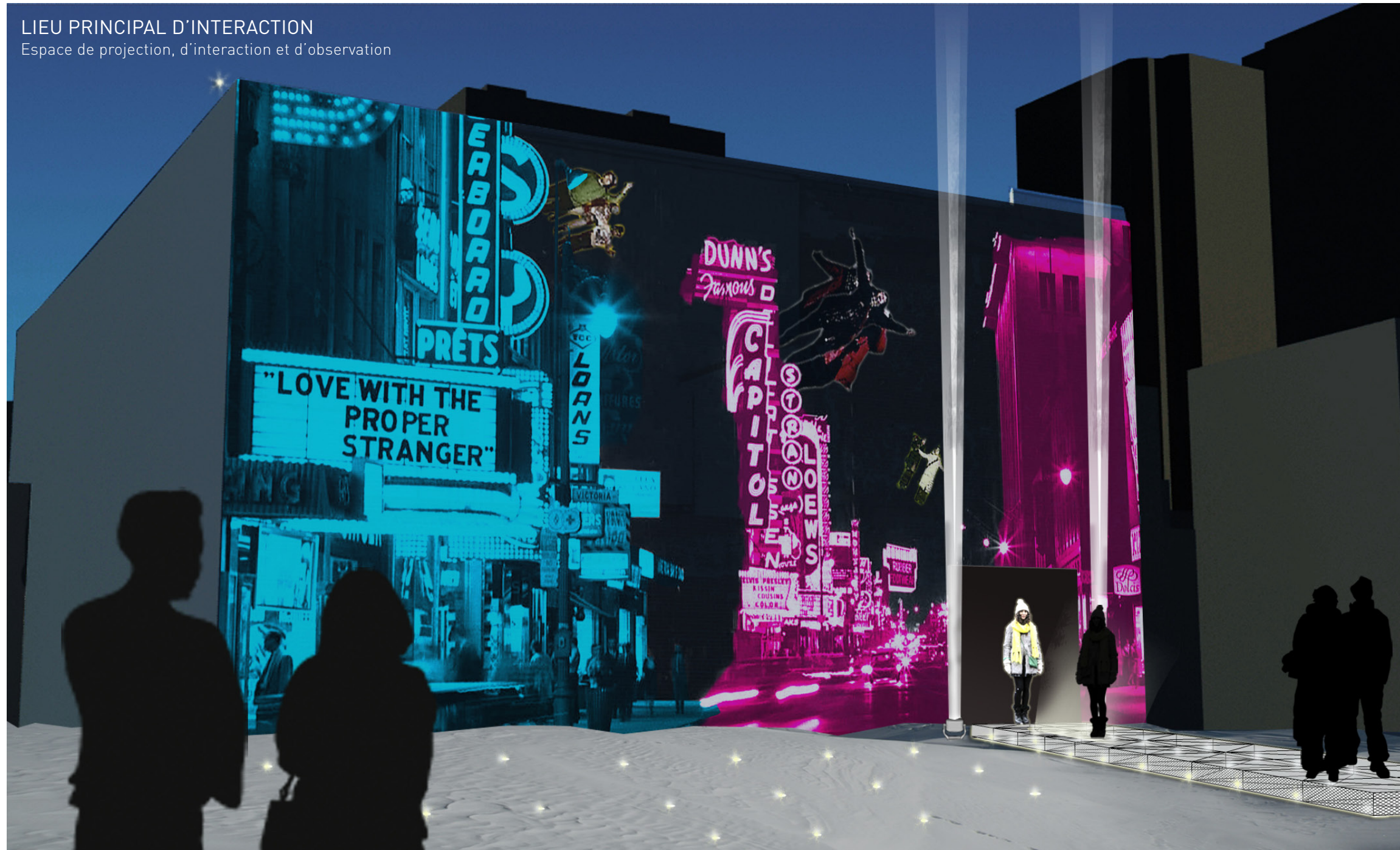
Le site du métro Saint-Laurent accueille le public qui participe et qui prend aussi le temps d'admirer la projection.

Espace de projection, d'interaction et d'observation