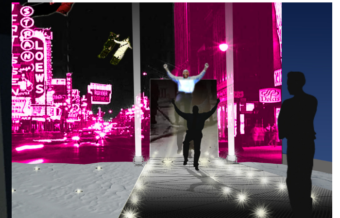
La «Rampe de lancement» : captation de mouvements