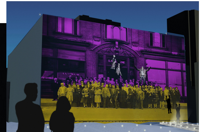
Projection sur la façade : superposition présent / passé et intégration de participants