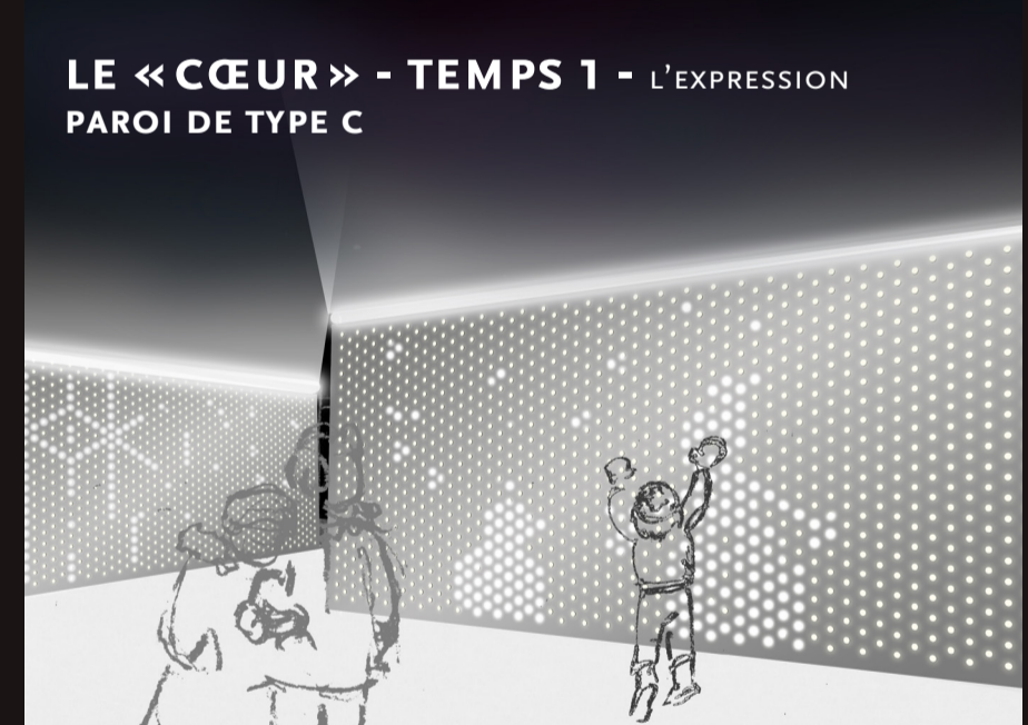
LE «CŒUR» - TEMPS 1 - L'EXPRESSION PAROI DE TYPE C Double épaisseur de panneaux métalliques perforés - trous de 1/2". INTERACTION: Les visiteurs sont invités à dessiner avec la lumière. SYSTÈME LUMINEUX: Les parois perforées (1/2") accueillent un système de LED tactiles. Lumière plus puissante se diffusant depuis le haut de la paroi. SITUATION: Panneaux situés au centre du labyrinthe.