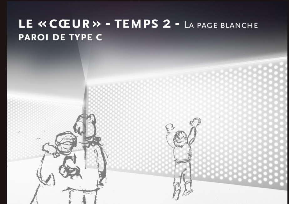
LE «CŒUR» - TEMPS 2 - LA PAGE BLANCHE PAROI DE TYPE C CONCEPT: toutes les lumières s'allument de façon minutée. Le dessin est réinitialisé. La page est prête pour une nouvelle œuvre.