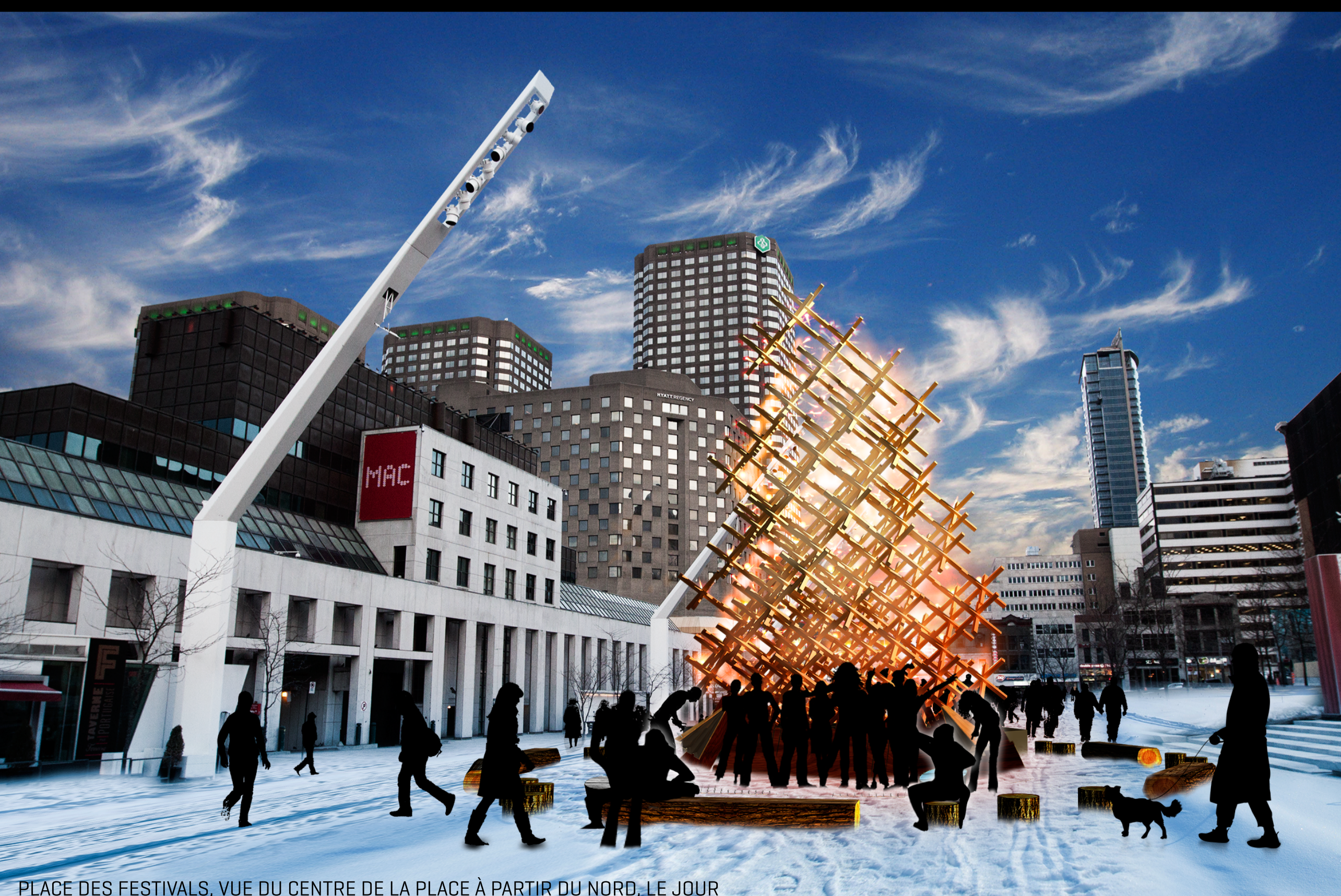
PLACE DES FESTIVALS, VUE DU CENTRE DE LA PLACE À PARTIR DU NORD, LE JOUR

Source de chaleur, de réconfort et de rassemblement, un feu de camp au coeur de la ville qui invite les citoyens à collaborer ensemble pour insuffler à la grisaille urbaine et hivernale un bon coup de chaleur humaine.