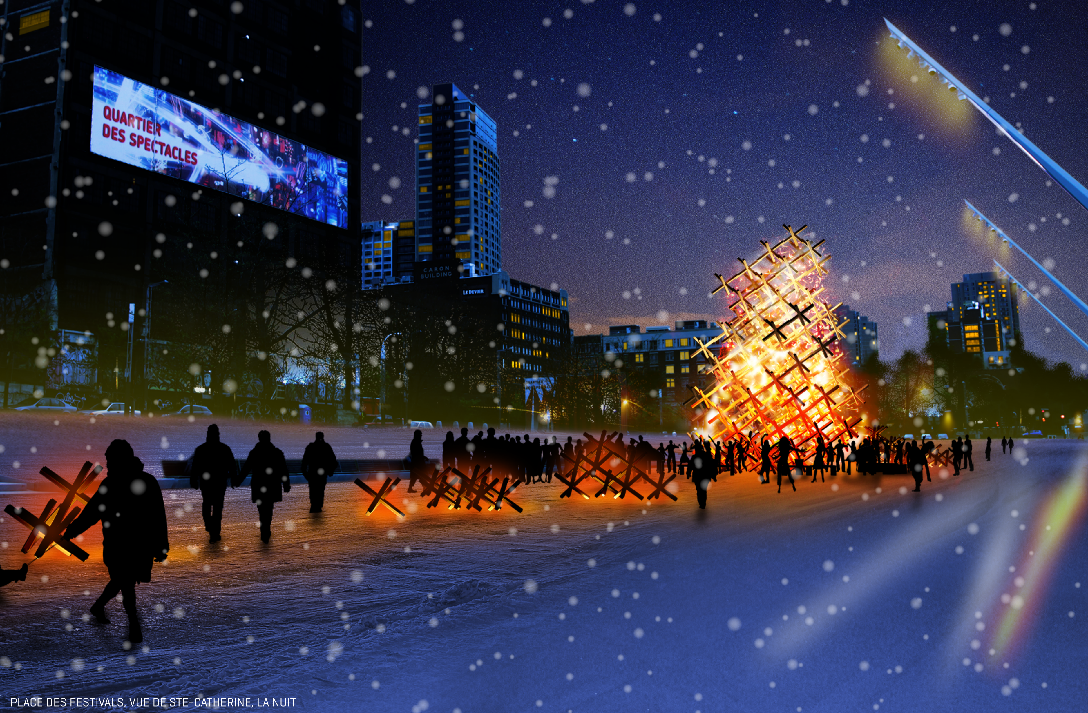
PLACE DES FESTIVALS, VUE DE STE-CATHERINE, LA NUIT