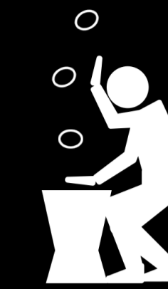
Remuer les tisons