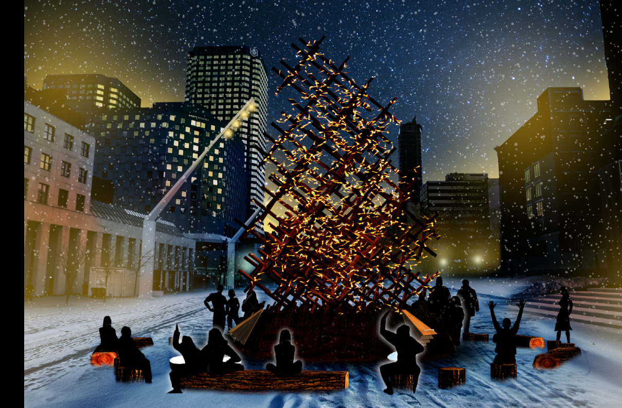
Une partition son et lumière à 3 voix