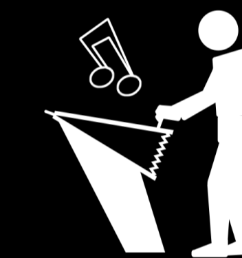
Attiser la braise