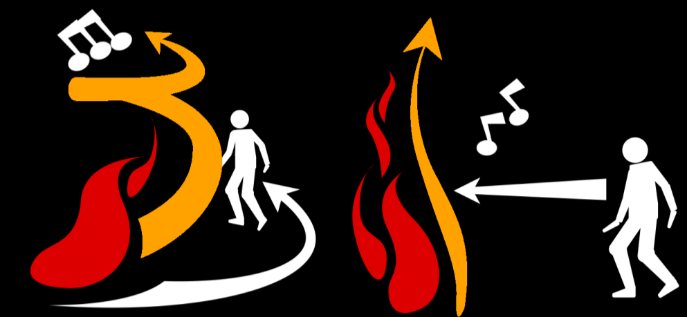
Réveiller la flamme