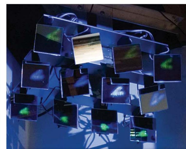
EXPÉRIMENTATION DÉVELOPPEMENT TECHNIQUE MIROIRS ROBOTISÉS