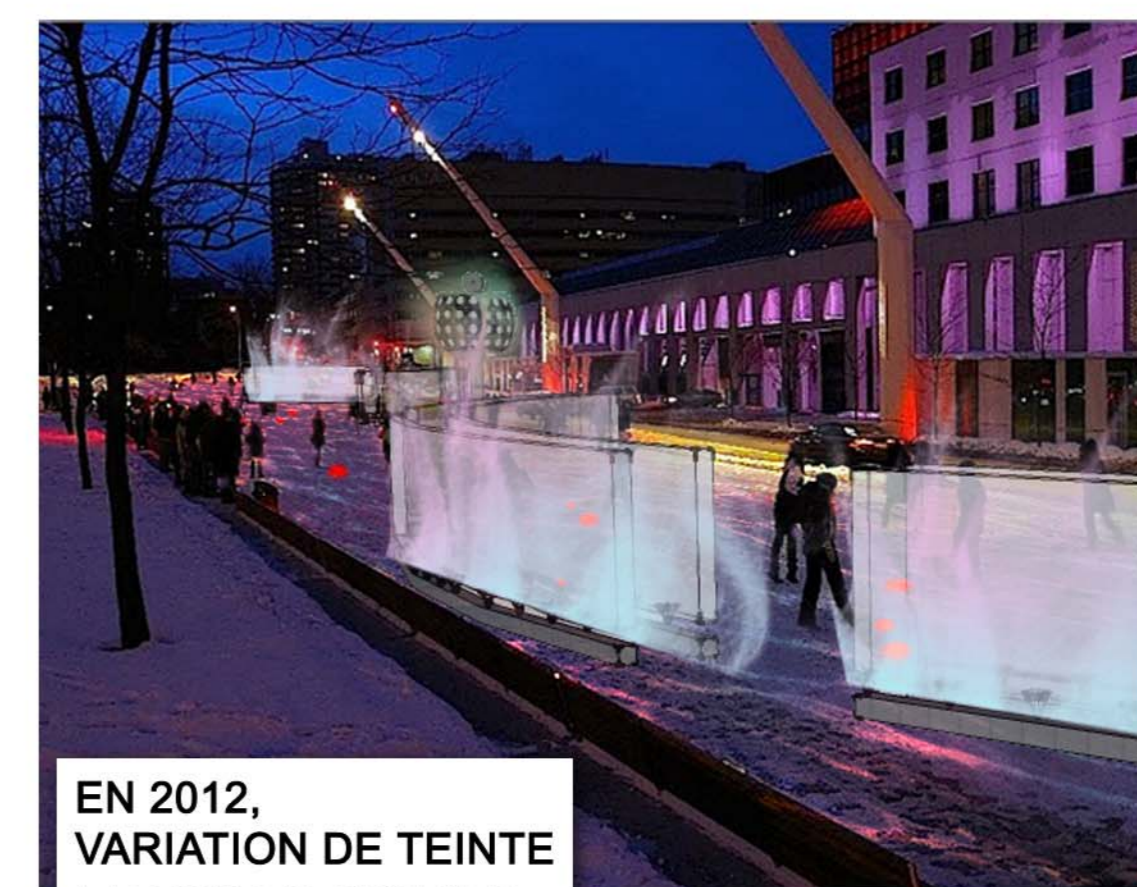
EN 2012, VARIATION DE TEINTE ET POINTS ROUGES PERMANENTS