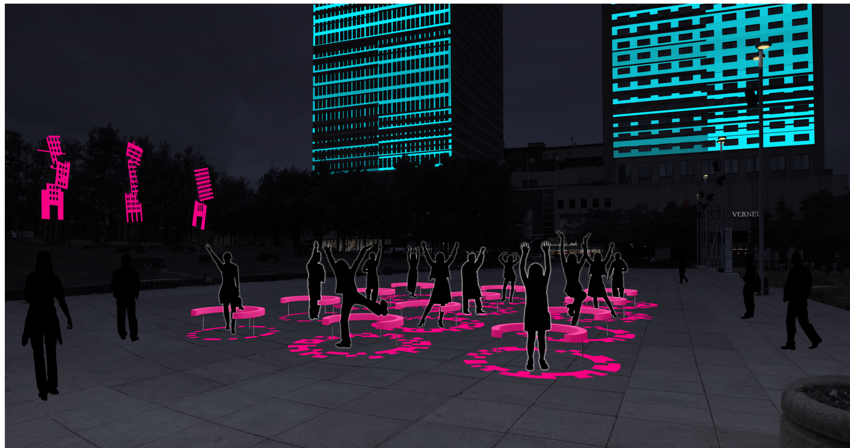
• L'interactivité de WAVES se déclenche dès lors que les participants bougent les bras. Leurs mouvements déclenchent les sons grâce aux capteurs laser à balayage horizontal depuis le sol.