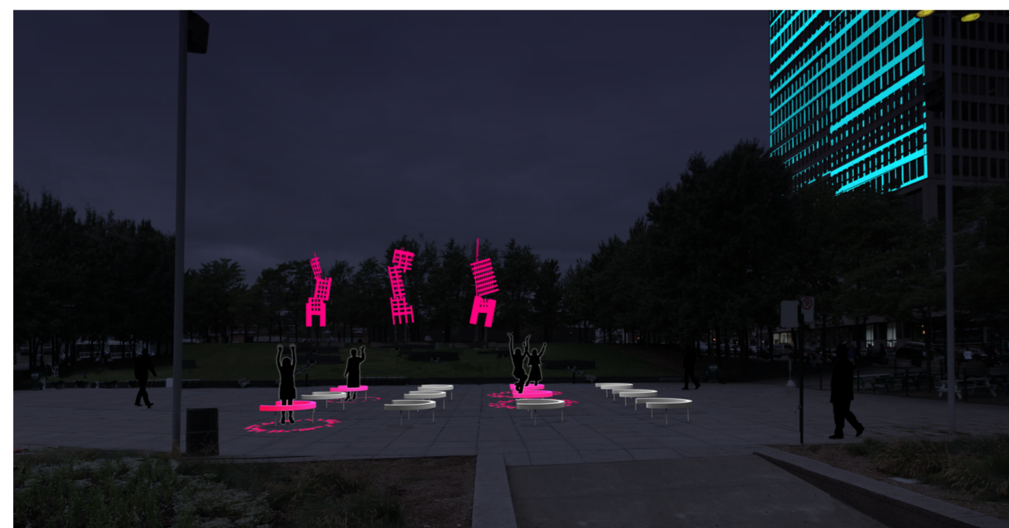
• De nuit, les demi-cercles sont équipés de LEDs et donc pleinement visibles. Les projections au sol réagissent selon les mouvements de chaque participant, alors que les connections entre ces mouvements créent une œuvre collective, elle-même projetée sur les bâtiments.