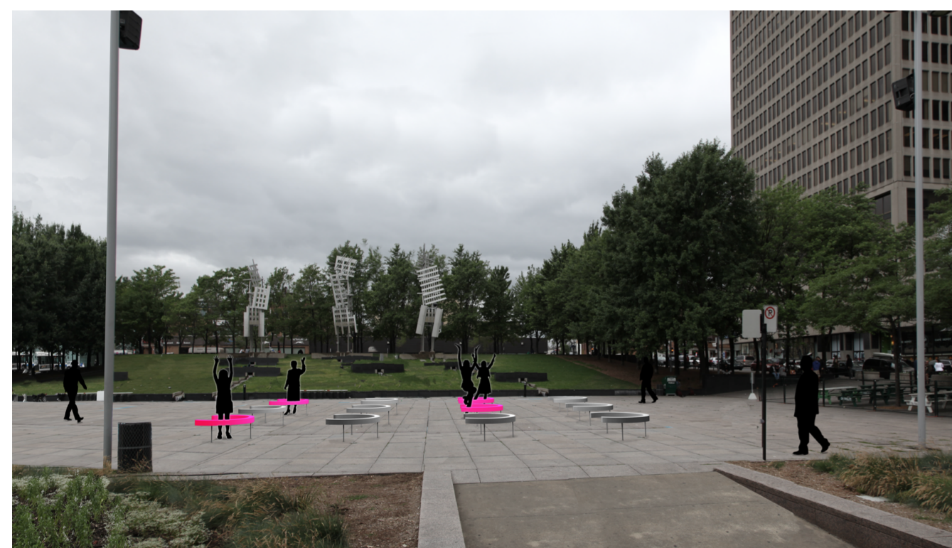
• De jour, les demi-cercles emplissent l'espace pour en transformer l'apparence générale.