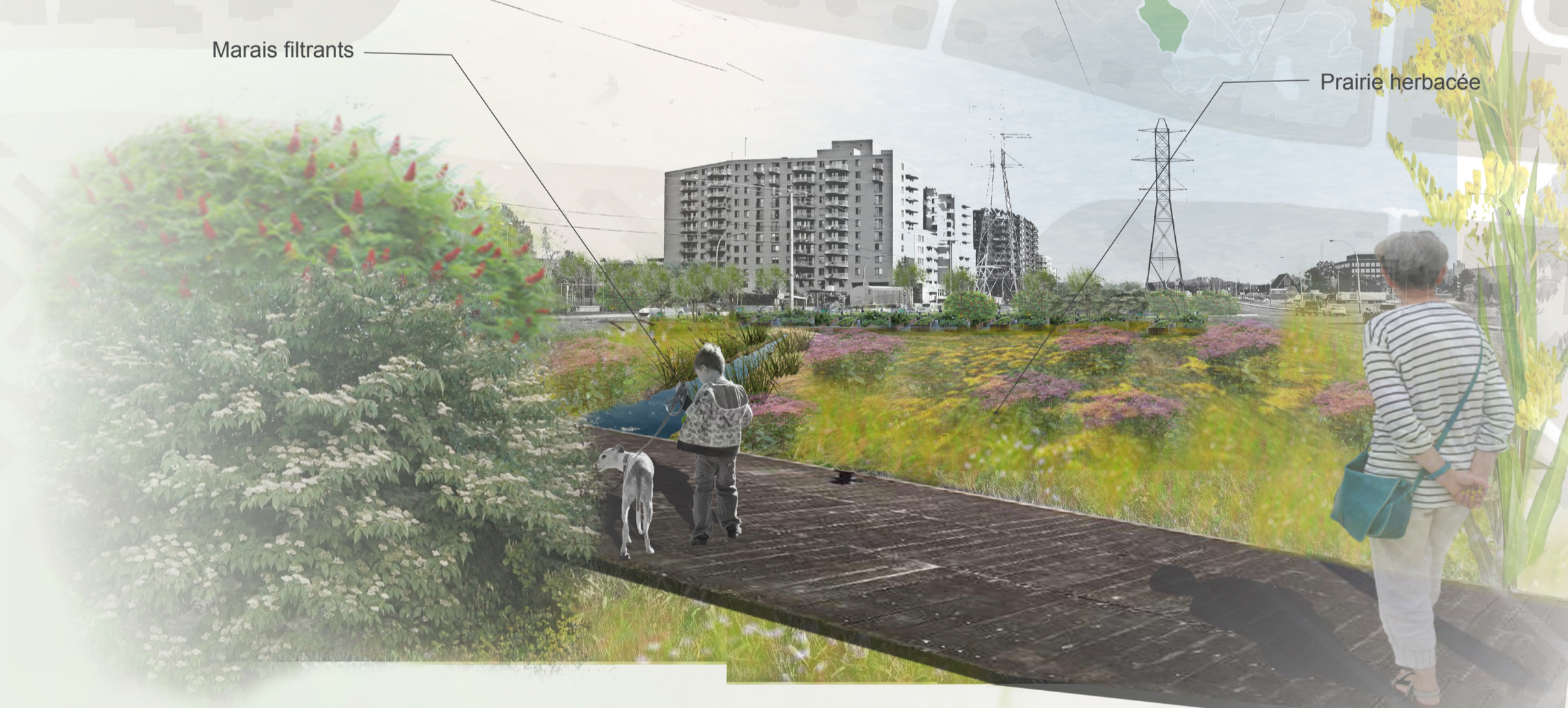
PARCELLE CAVENDISH: POINT DE VUE VERS LES JARDINS COMMUNAUTAIRES