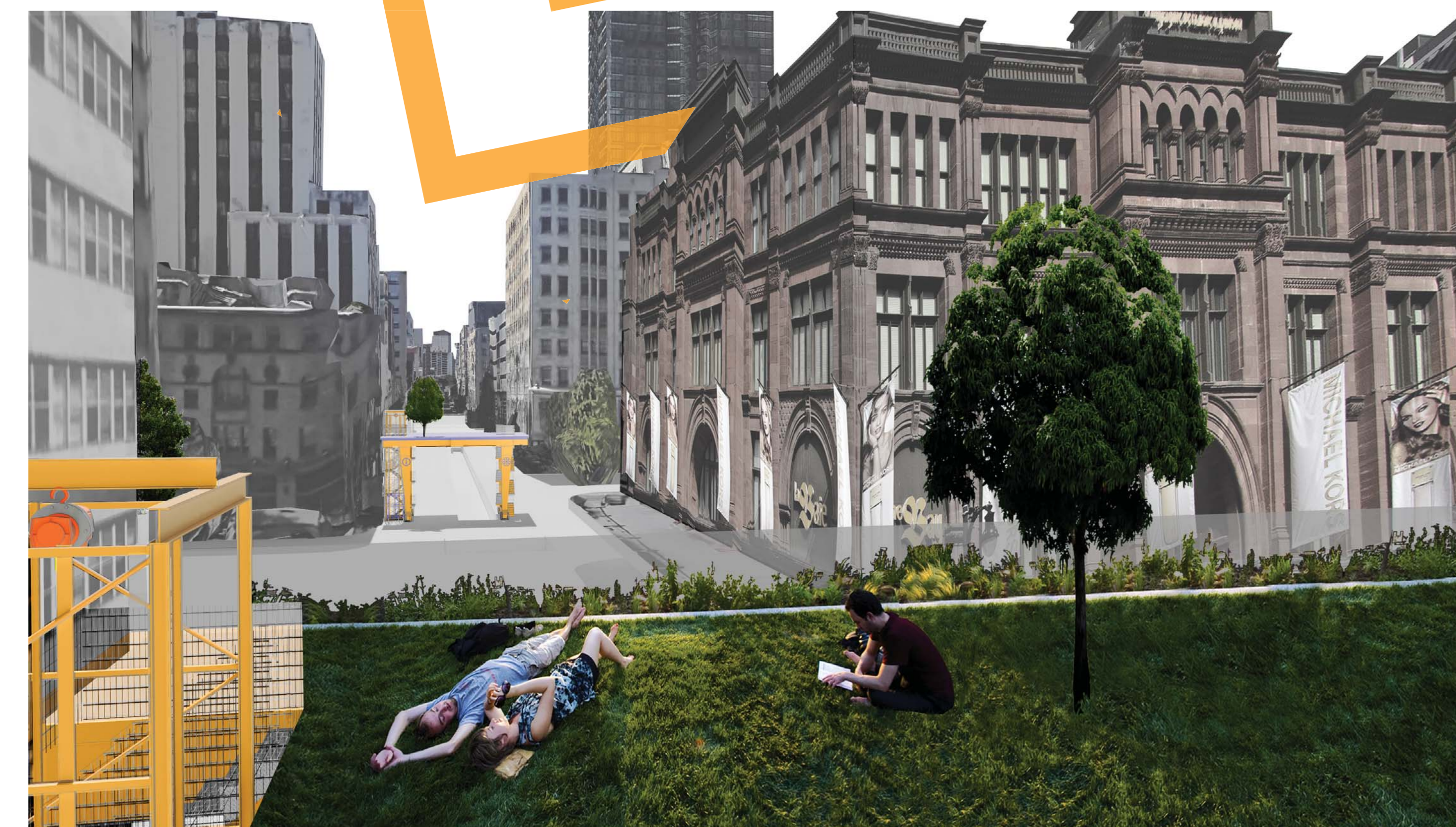
LES PLACES SUR LE CIEL seront uniques, car elles créeront des espaces invitants, offrant une perspective inédite sur la rue. Elles seront une attraction dans le quartier et la vue aérienne qu'elles procureront aidera les gens à comprendre le sens de l'ensemble des travaux. Ces nouveaux espaces publics, remplis de plantes et de mobilier, seront un véritable oasis sensoriel et visuel flottant au-dessus de l'activité de la rue.