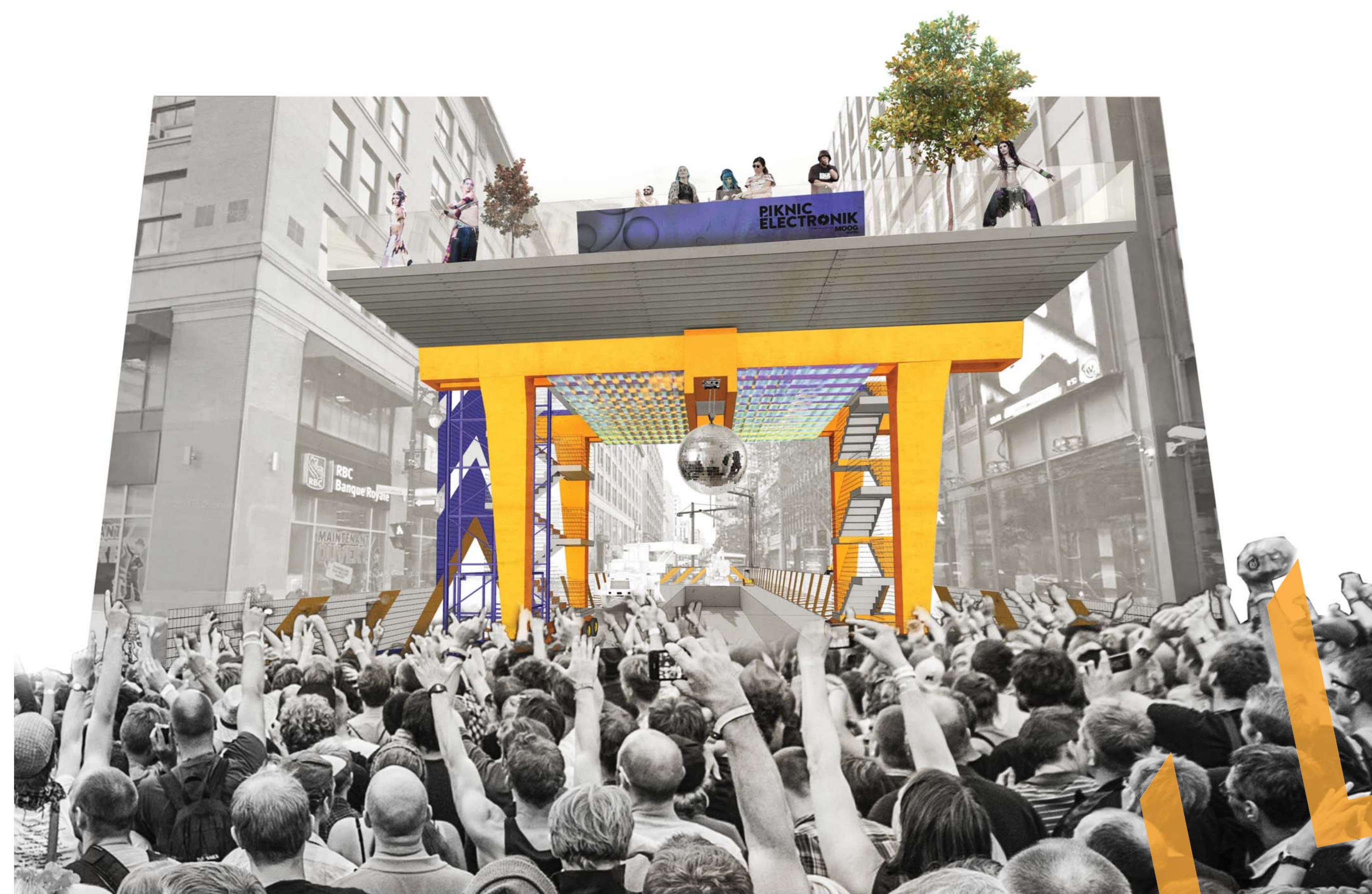
Une place publique pour... donner un spectacle dans le ciel, patiner dans le ciel, patiner dans le ciel, aller à la plage dans le ciel, rire dans le ciel, se détendre dans le ciel, accueillir un cirque dans le ciel, prendre un café dans le ciel...