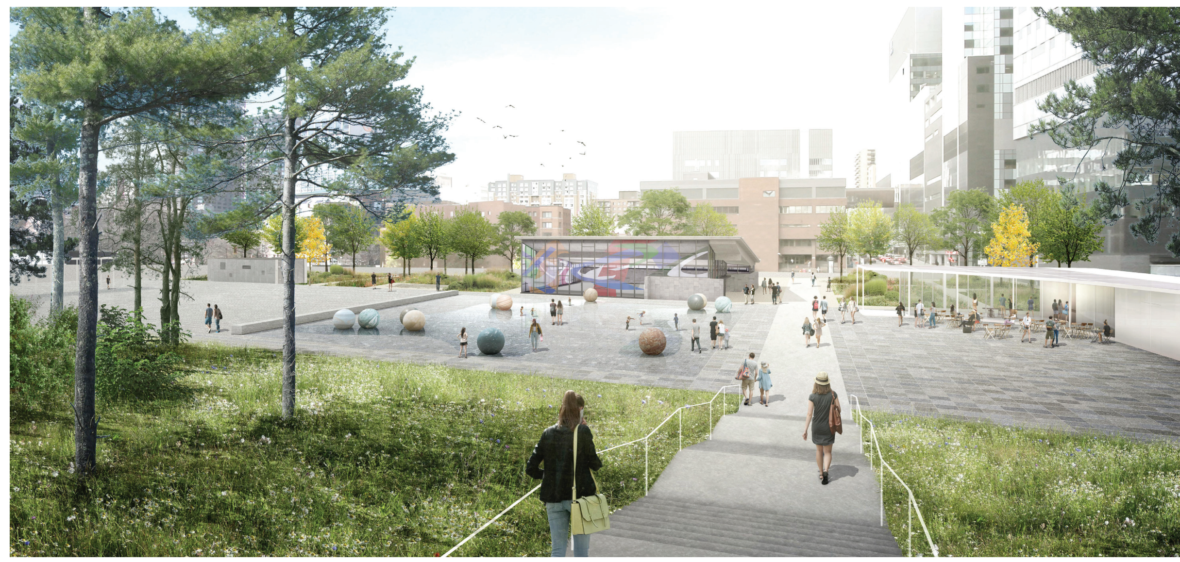
Axe Traversant : Vue estivale depuis les collines vers la place, le pavillon d'hiver et la station de métro Champ-de-Mars