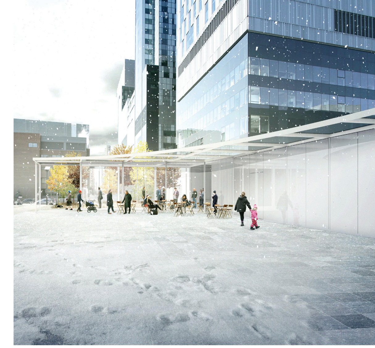
Pavillon d'hiver : protection contre la neige et le vent en hiver