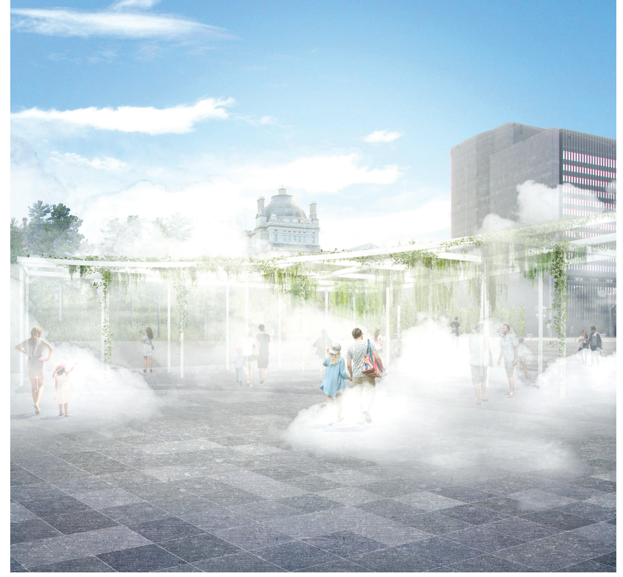
Pavillon d'été : refroidissement par des brumisateurs et des plantes en été