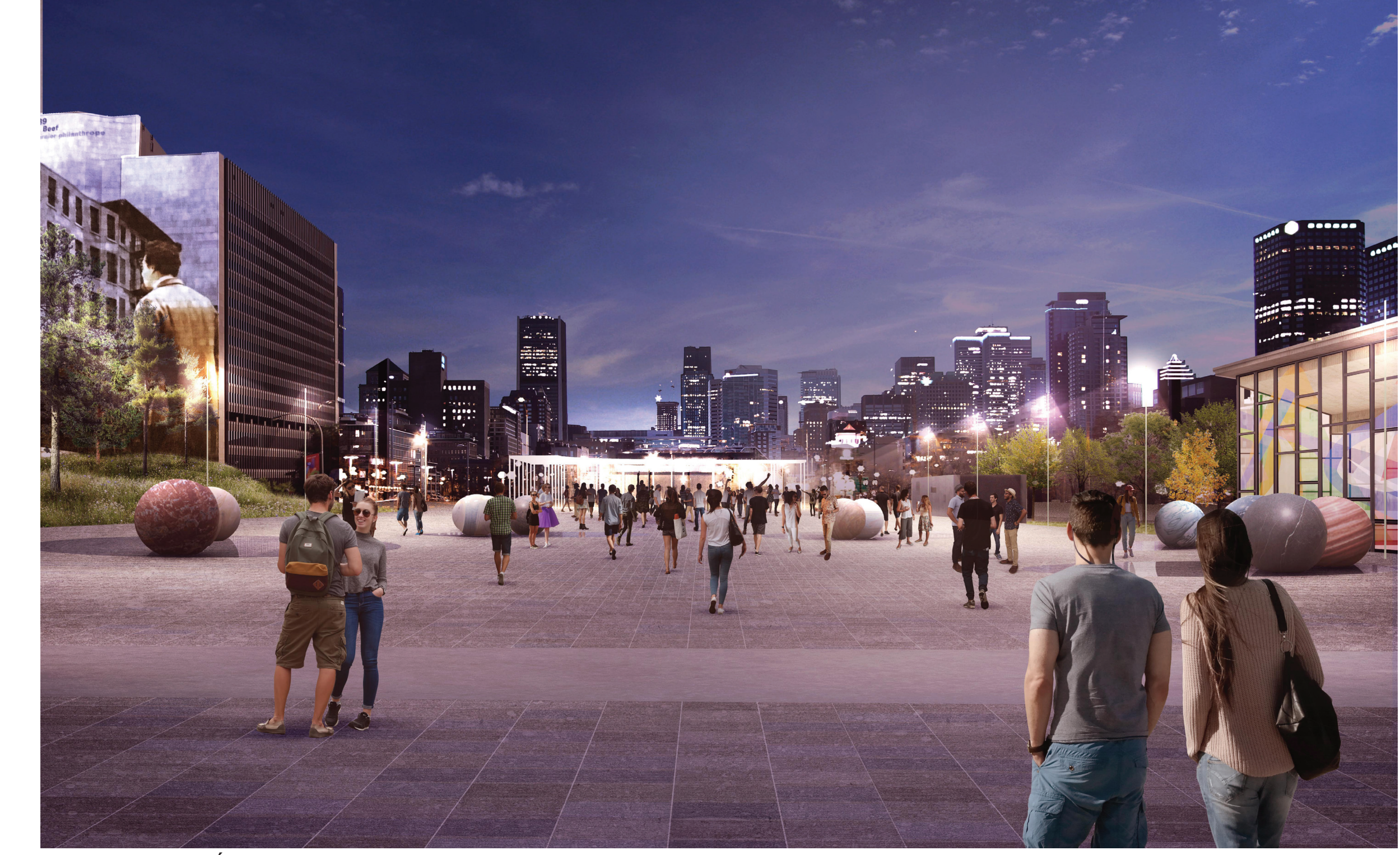
PLACE DES MONTRÉALAISES