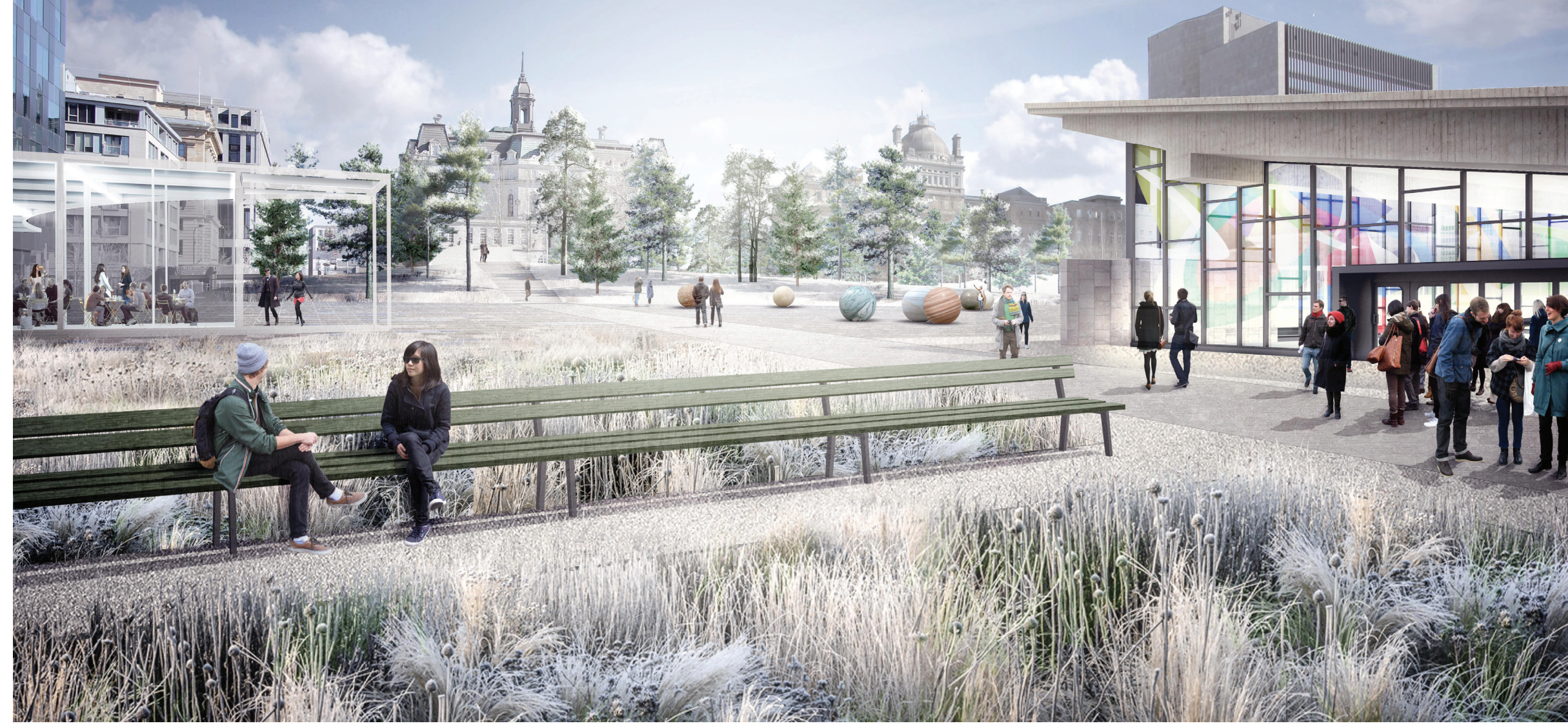
Vue hivernale depuis les jardins à côté de la station de métro Champ-de-Mars vers la place, le pavillon d'hiver et les collines