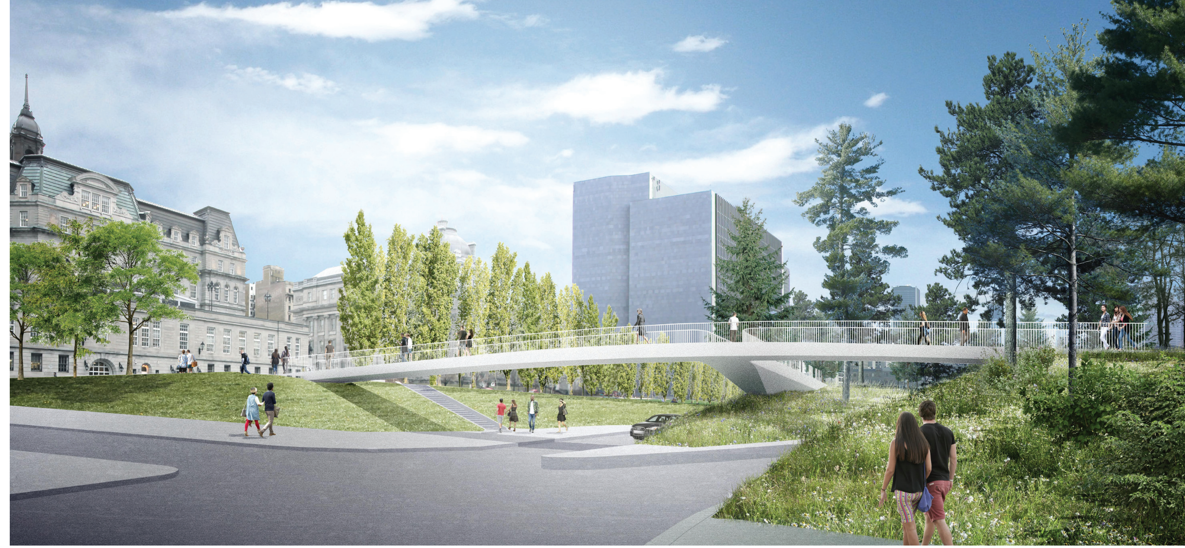
Vue de la passerelle et des collines depuis l'avenue Saint-Antoine