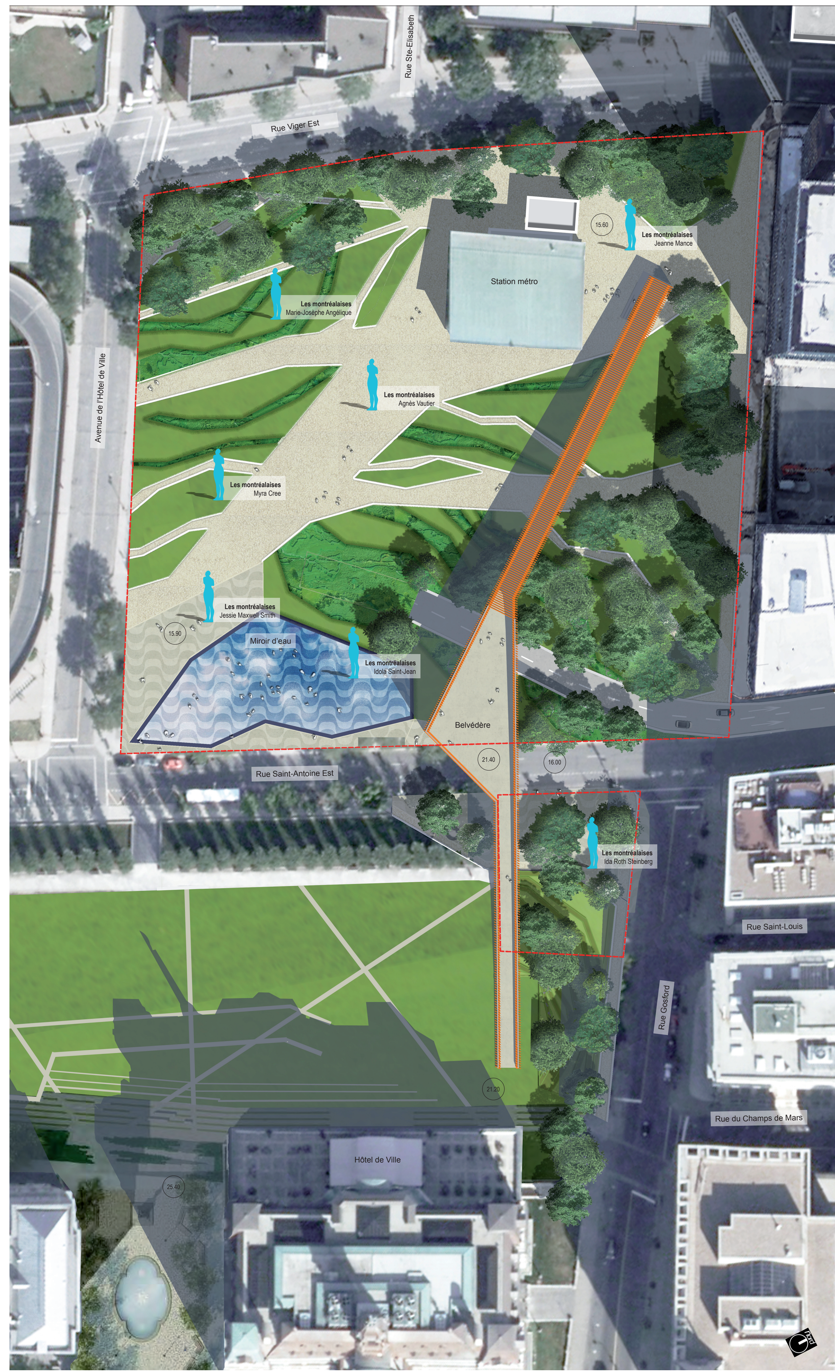
PLAN ESQUISSE DU PÉRIMÈTRE D'AMÉNAGEMENT AU 1/5000