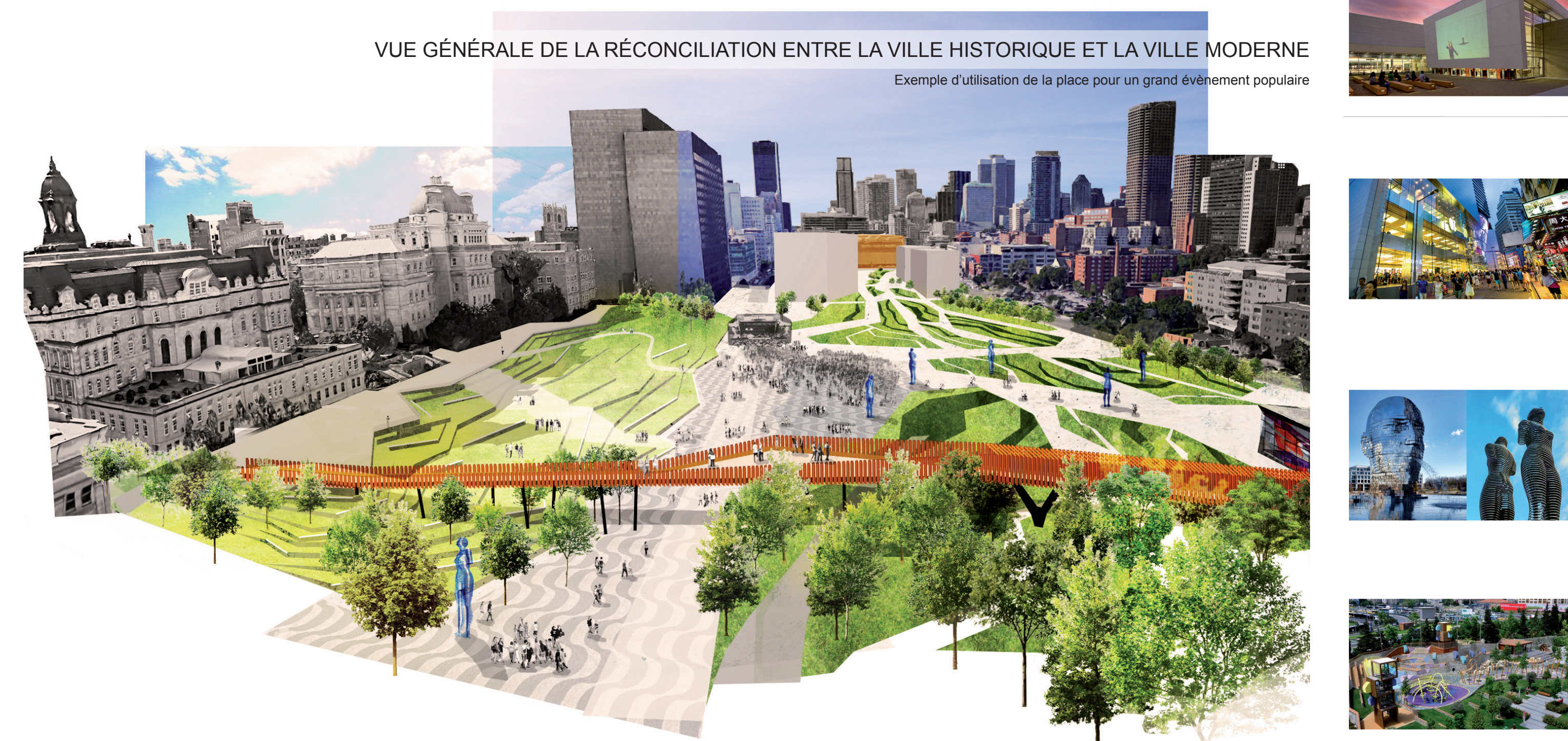
VUE GÉNÉRALE DE LA RÉCONCILIATION ENTRE LA VILLE HISTORIQUE ET LA VILLE MODERNE