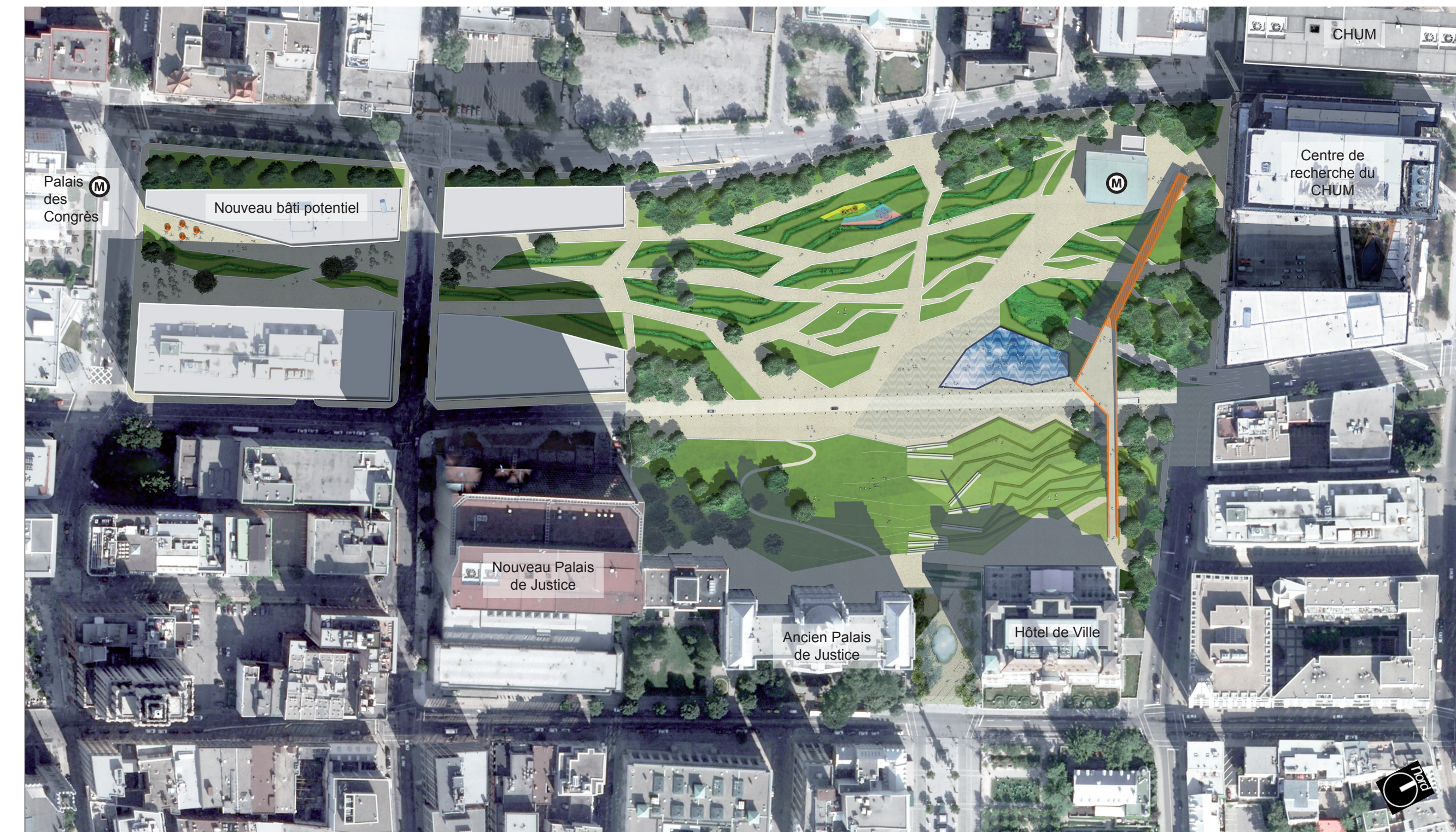
PLAN GUIDE D'UN PÉRIMÈTRE ÉLARGI AU PALAIS DES CONGRÈS ET À LA STATION DE MÉTRO PLACE D'ARMES - 1/20000