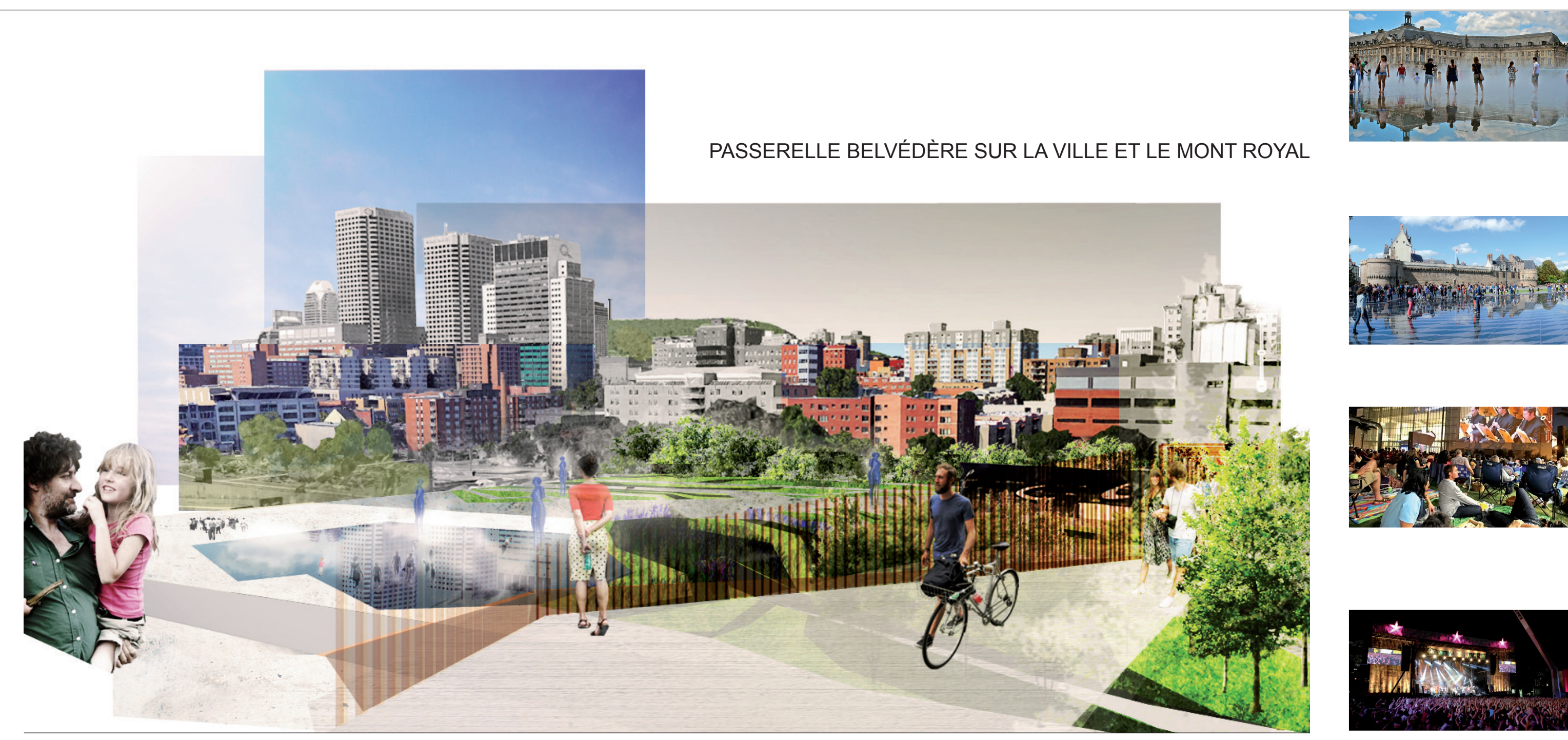
PASSERELLE BELVÉDÈRE SUR LA VILLE ET LE MONT ROYAL