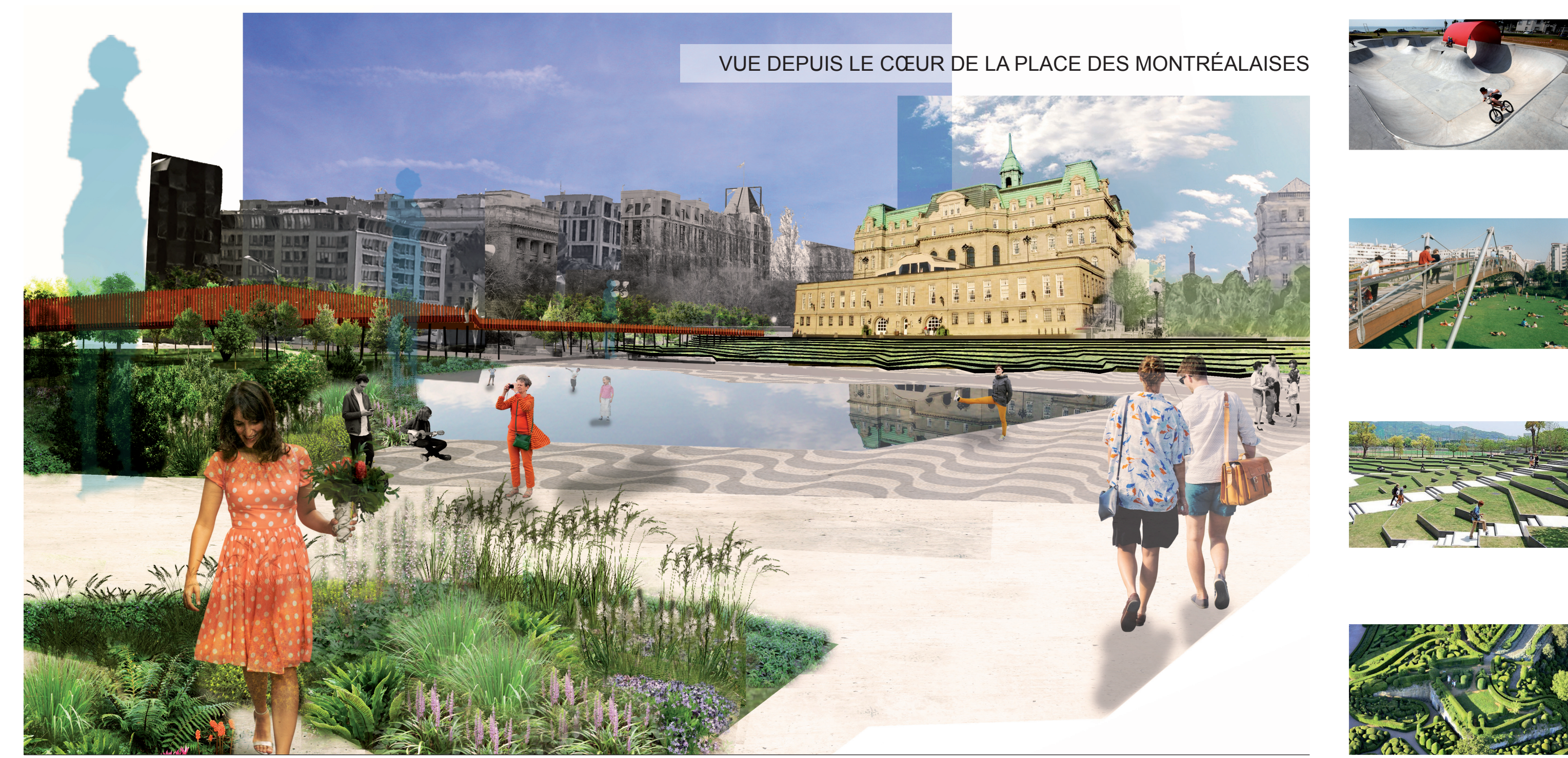
VUE DEPUIS LE CŒUR DE LA PLACE DES MONTRÉALAISES