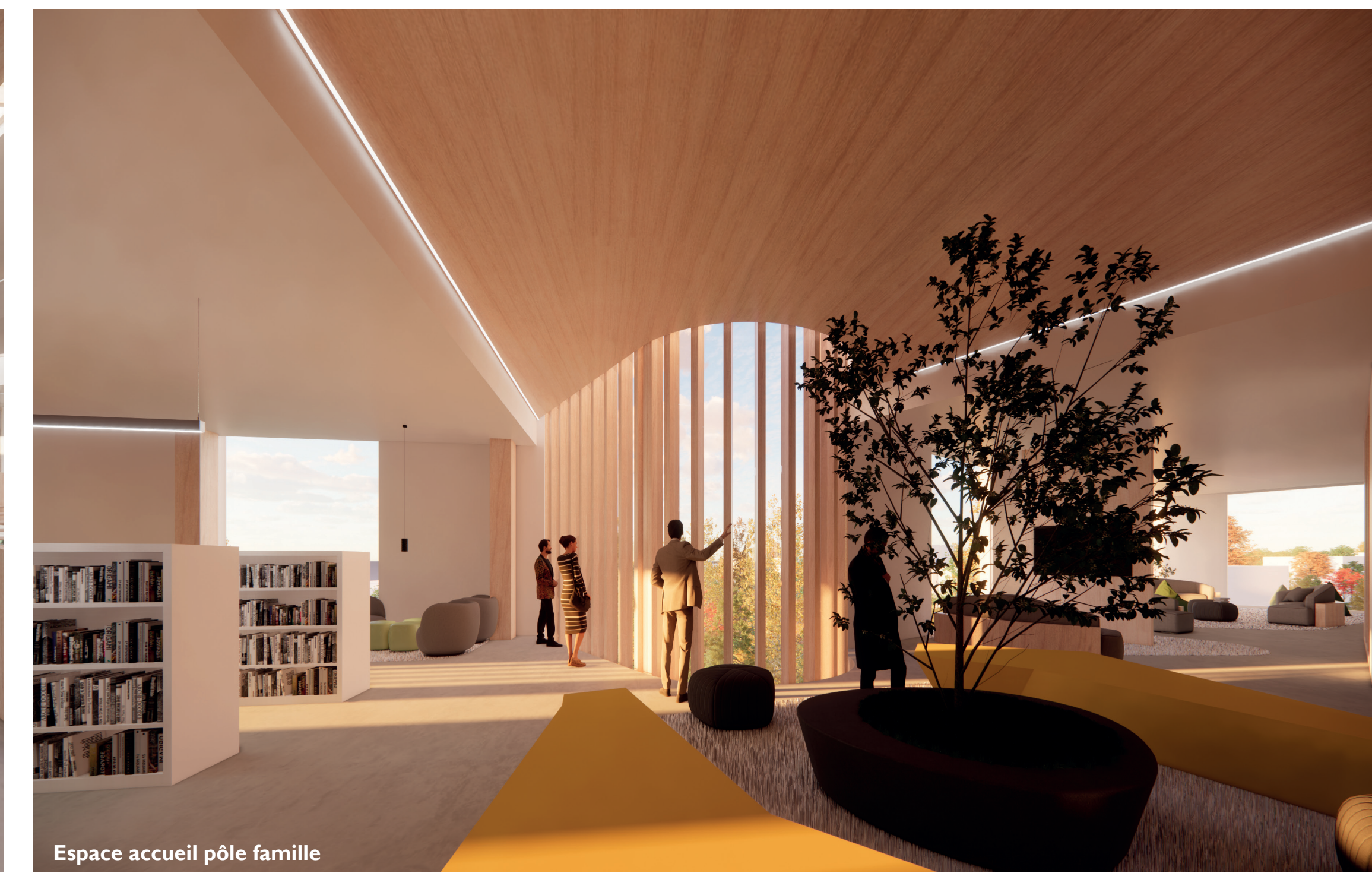
Espace accueil pôle famille