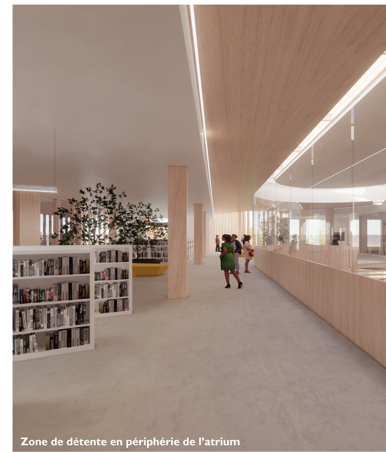
Zone de détente en périphérie de l'atrium

Ce carrefour est en quelque sorte notre contribution à la vie citoyenne de l'arrondissement Rivière-des-Prairies—Pointe-aux-Trembles en fournissant un noyau de vie communautaire et de socialisation. Cette image n'est pas fortuite, puisqu'elle représente bien l'idée qu'on se fait de la place d'un village. La proposition consiste donc à redéfinir le cœur du développement physique et social de l'arrondissement, c'est-à-dire de créer un carrefour vivant, rassembleur, civique, ludique, culturel, accessible, dynamique, inclusif, libre, centralisé et accueillant.