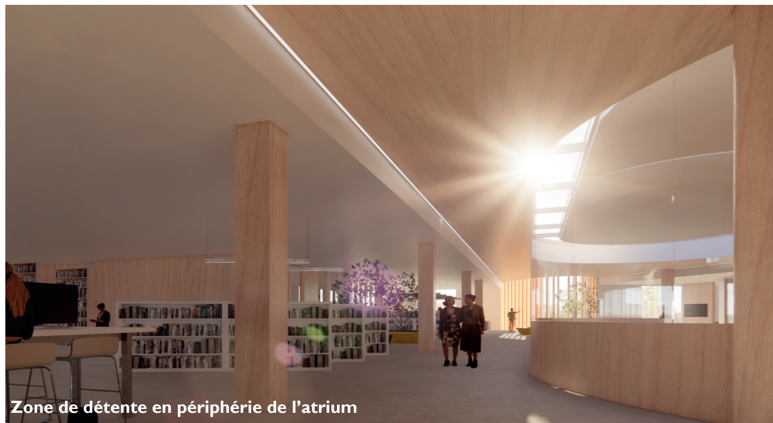
Zone de détente en périphérie de l'atrium