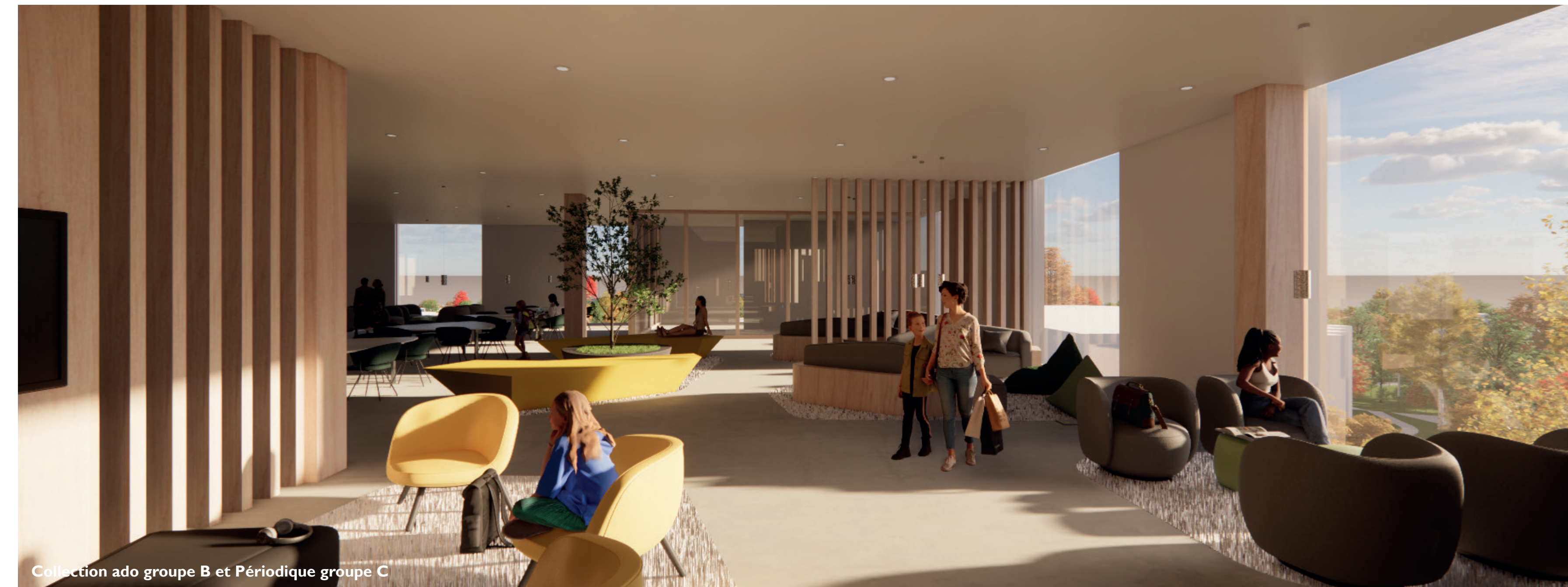
Collection ado groupe B et Périodique groupe C