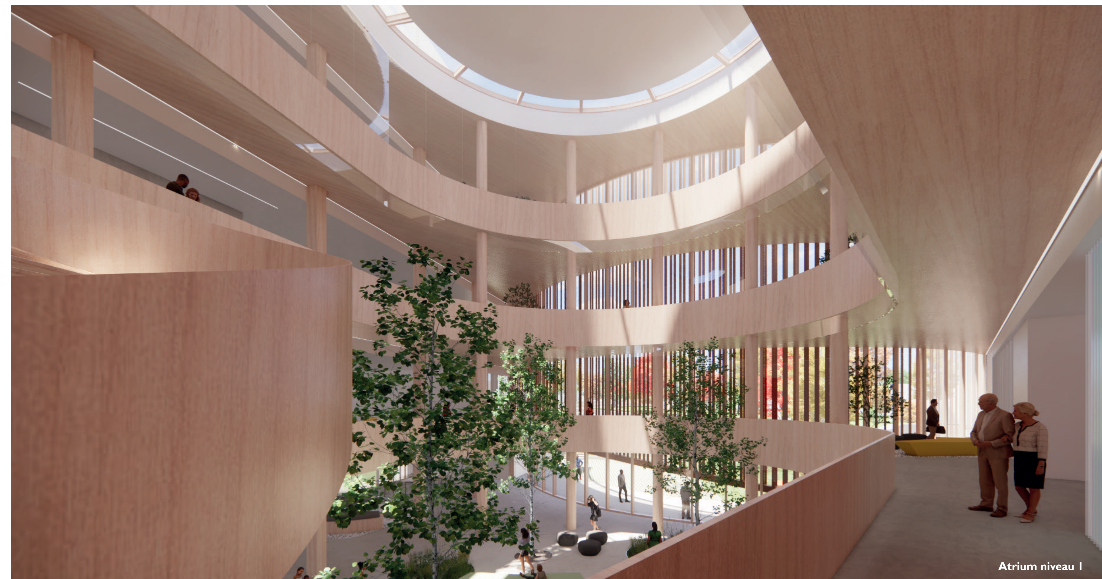
Atrium niveau I