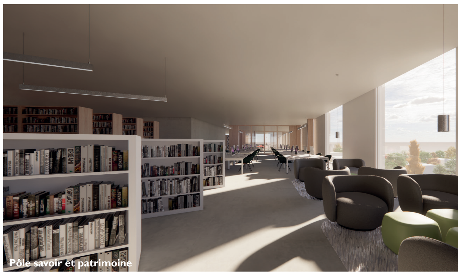
Pôle savoir et patrimoine