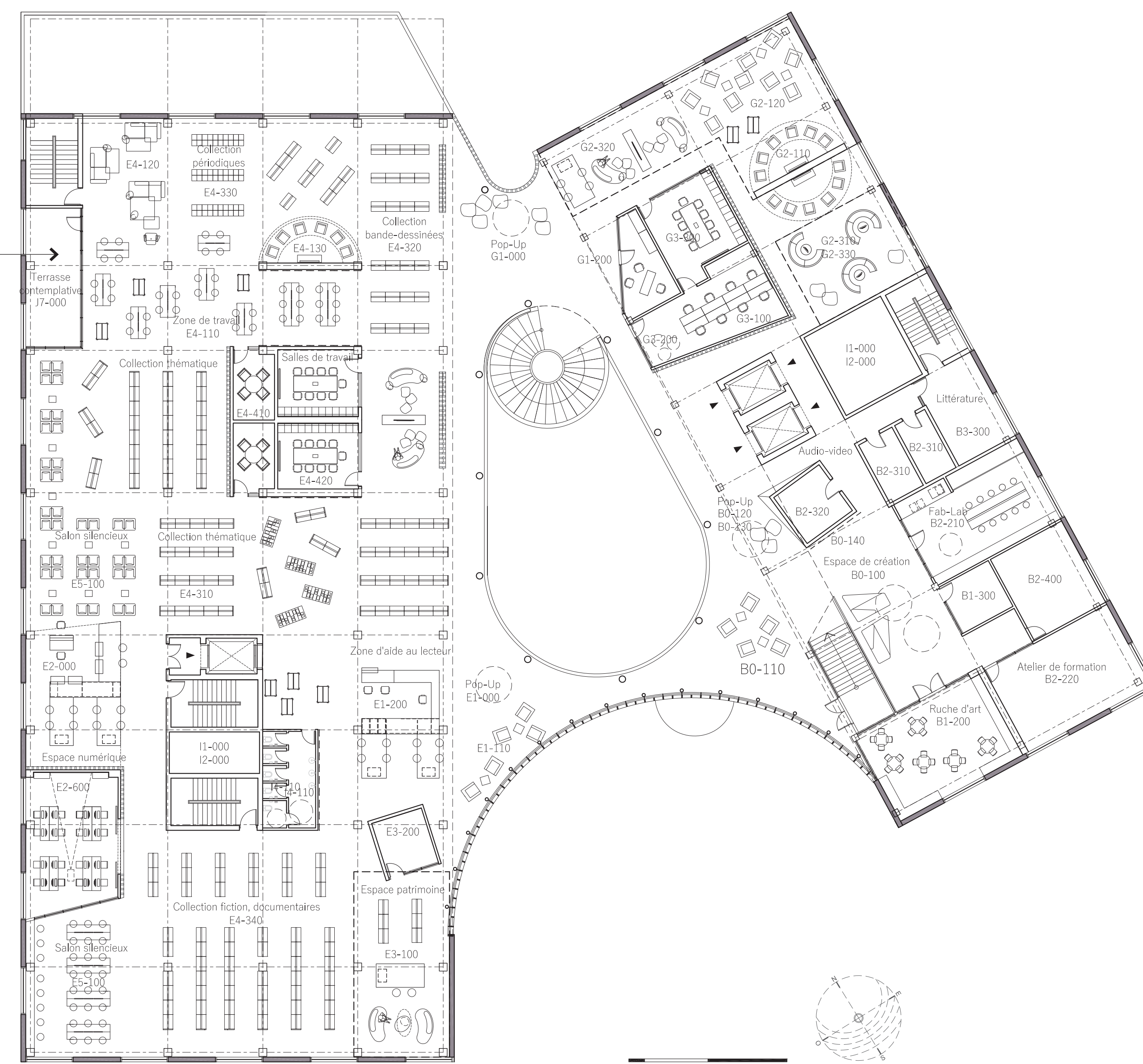
PLAN NIVEAU 3 : échelle 1:200

Aire de détente au cœur du projet - zone baignée de lumière naturelle