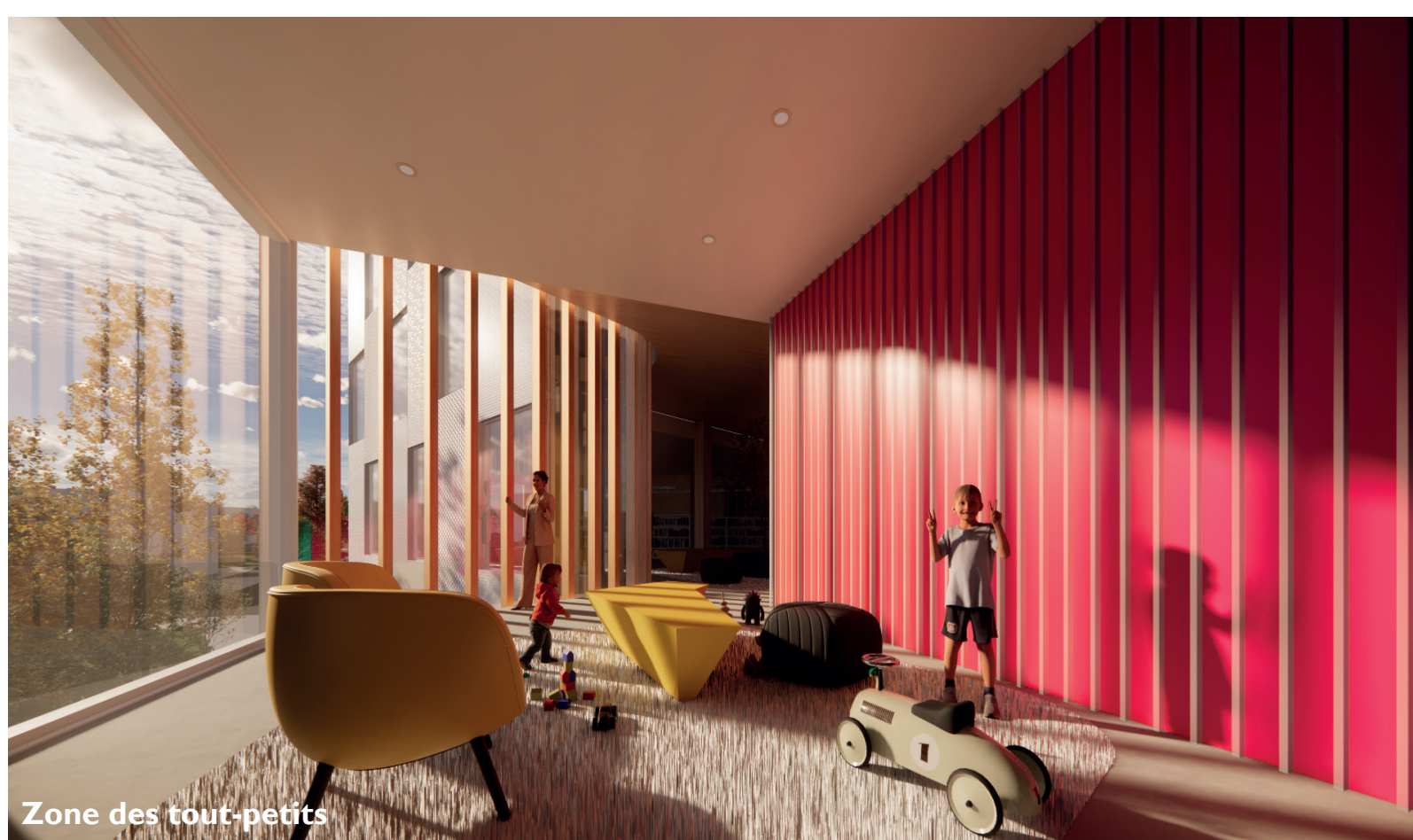
Zone des tout-petits