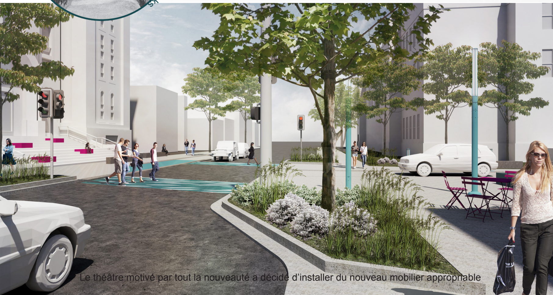
Le théâtre motivé par tout la nouveauté a décidé d'installer du nouveau mobilier appropriable