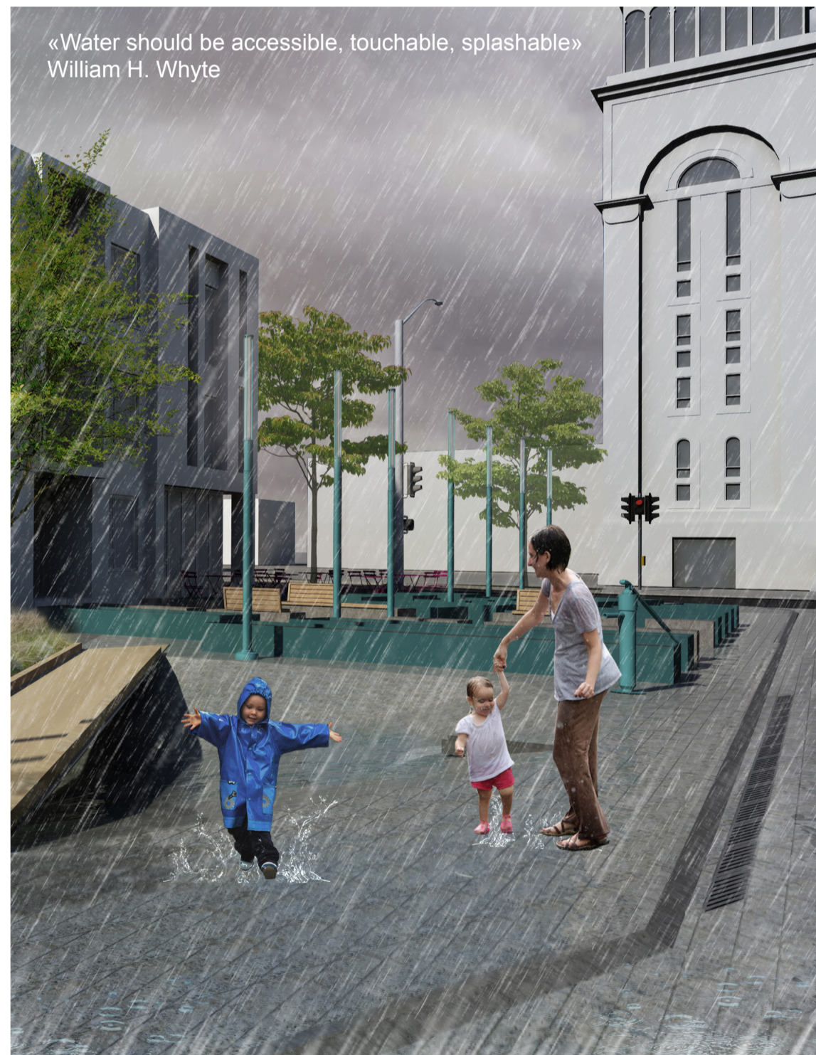
«Water should be accessible, touchable, splashable» William H. Whyte