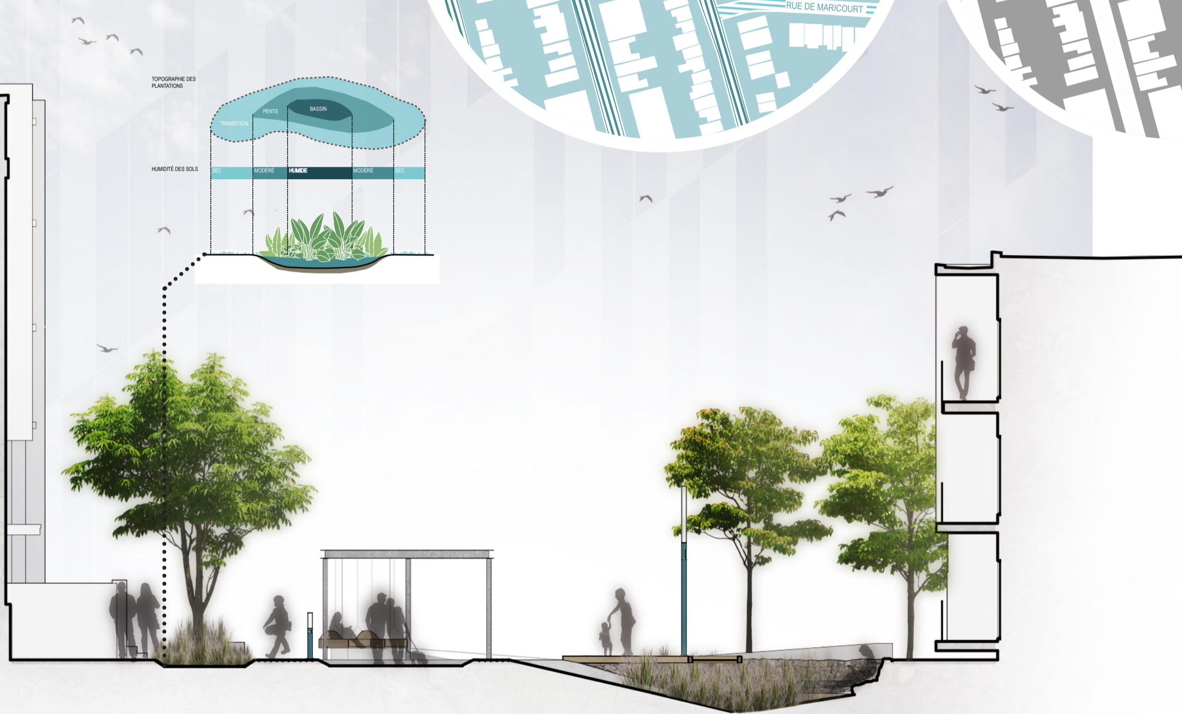
COUPE TRANSVERSALE 1:50