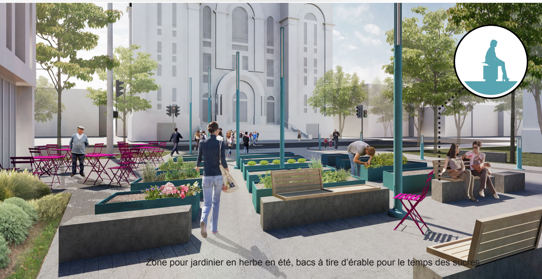
Zone pour jardinier en herbe en été, bacs à tire d'érable pour le temps des sucres