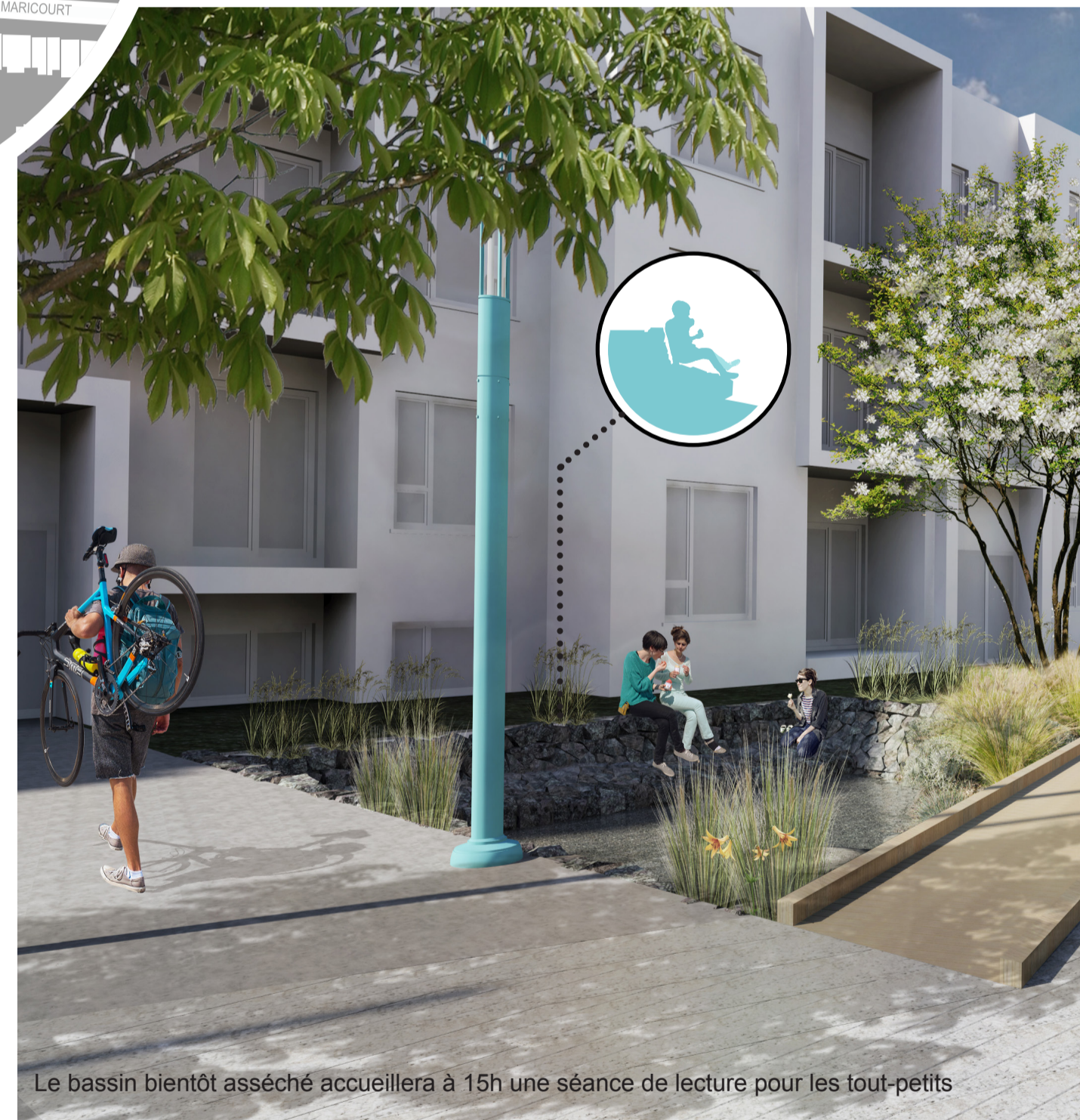
Le bassin bientôt asséché accueillera à 15h une séance de lecture pour les tout-petits