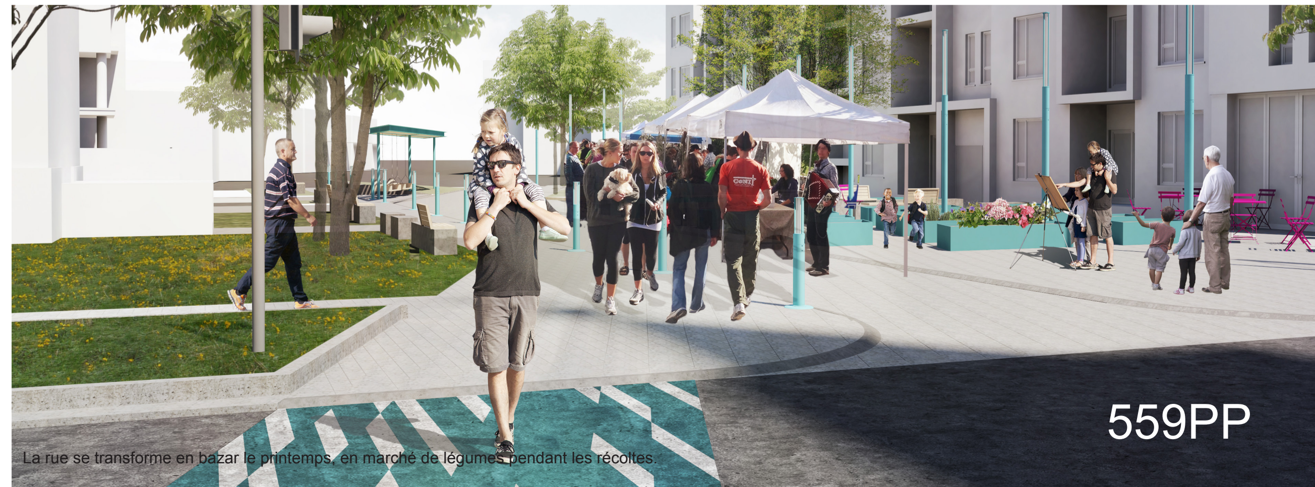
La rue se transforme en bazar le printemps, en marché de légumes pendant les récoltes.