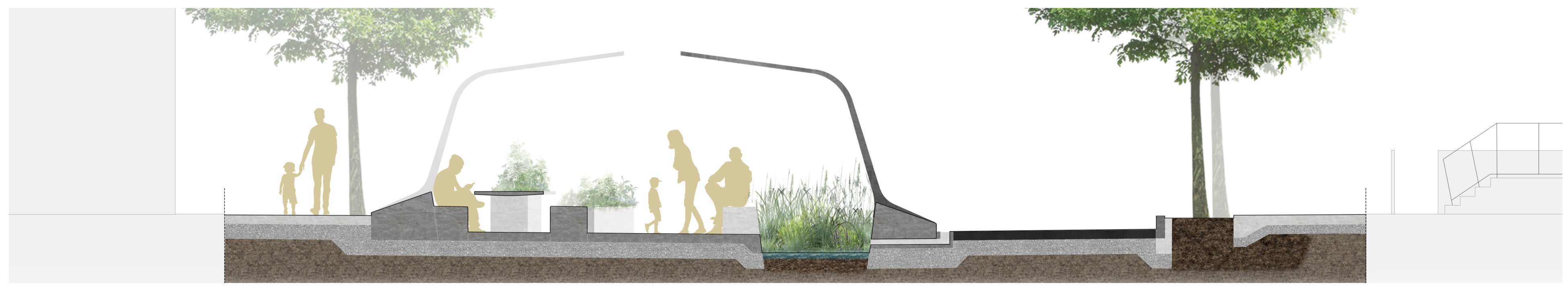
Coupe schématique nord/sud sur la rue De Biencourt - Échelle 1:50