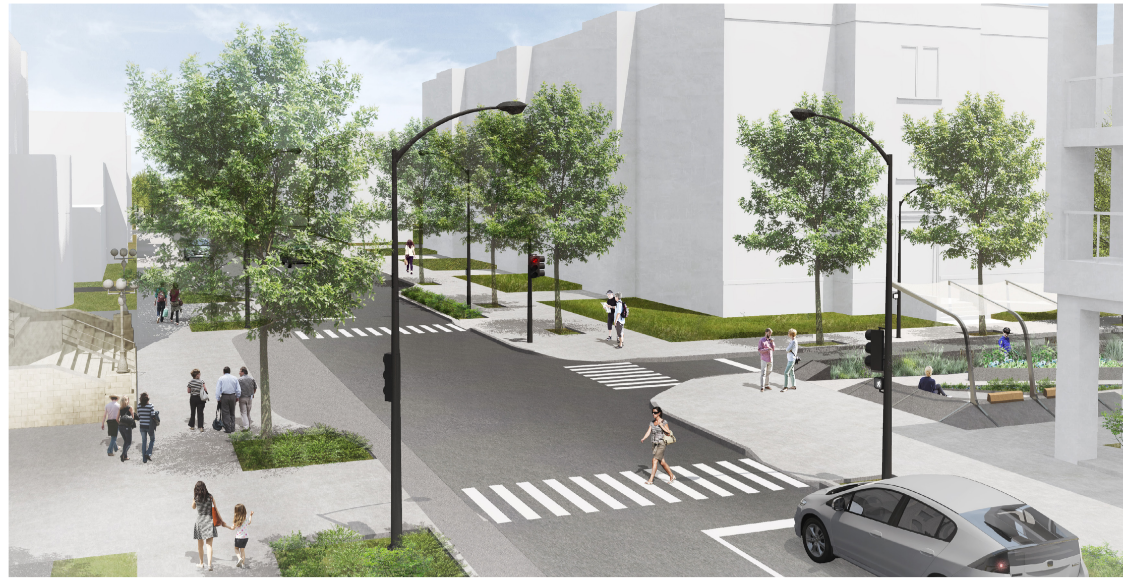
Perspective d'ambiance depuis le boulevard Monk vers le nord