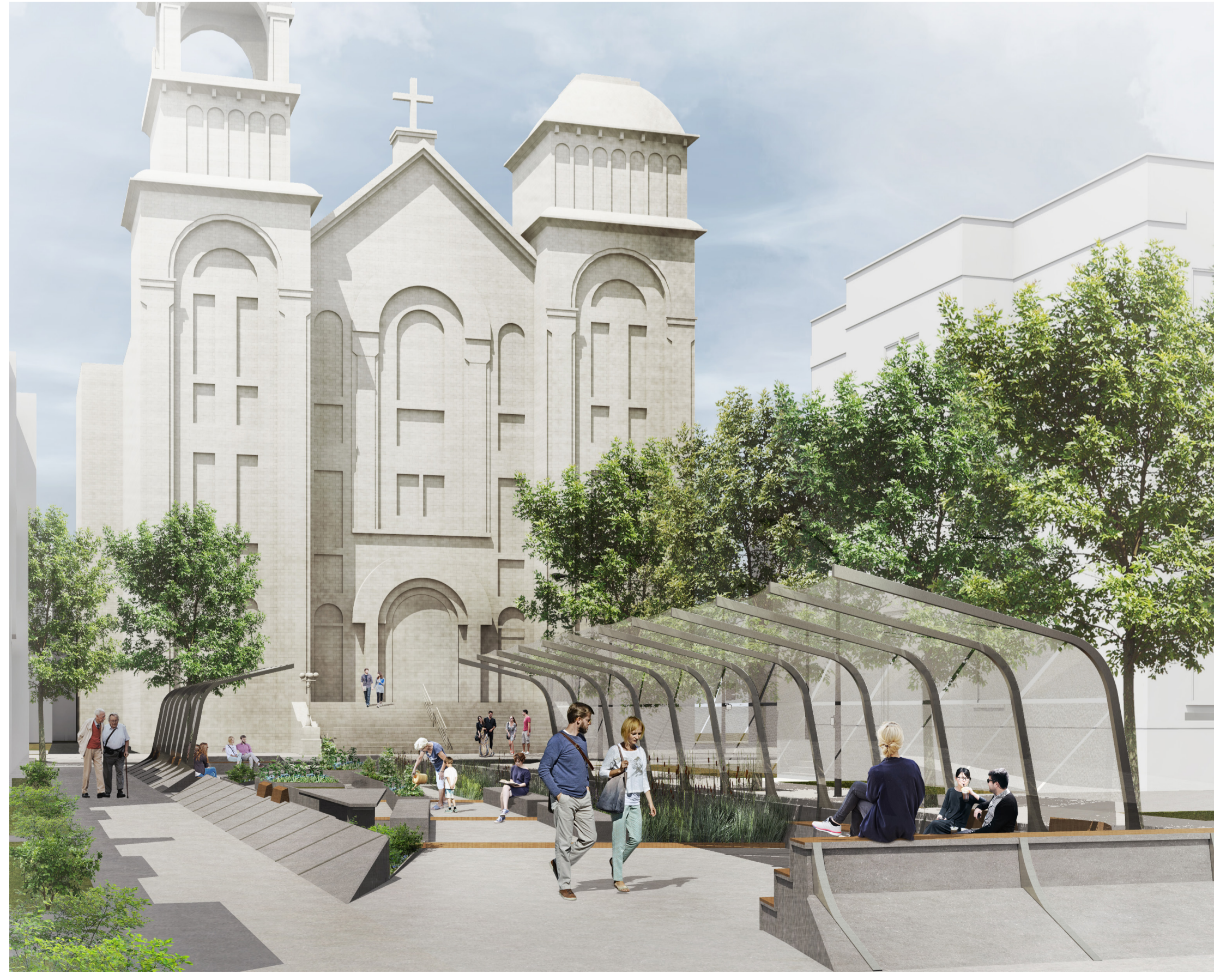
Perspective d'ambiance depuis la rue De Biencourt vers l'ouest