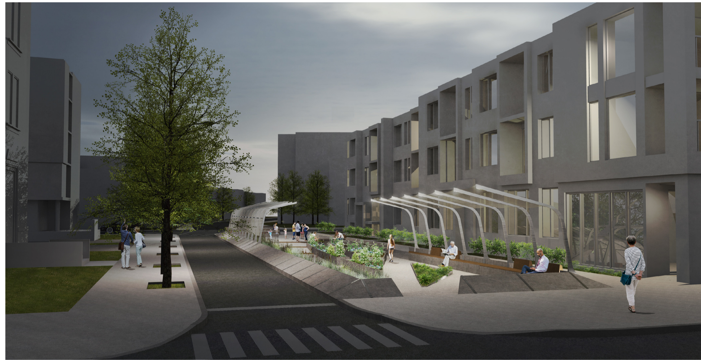
Perspective d'ambiance depuis le parvis de l'ancienne église Notre-Dame-du-Perpétuel-Secours