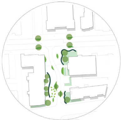
ÎLOTS DE FRAÎCHEUR