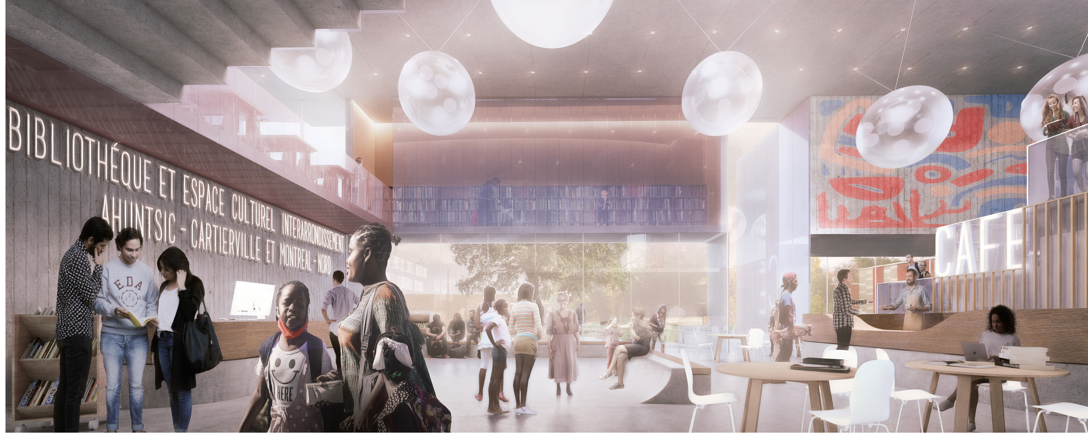
ESPACE D'ACCUEIL AVEC VUE SUR LE JARDIN