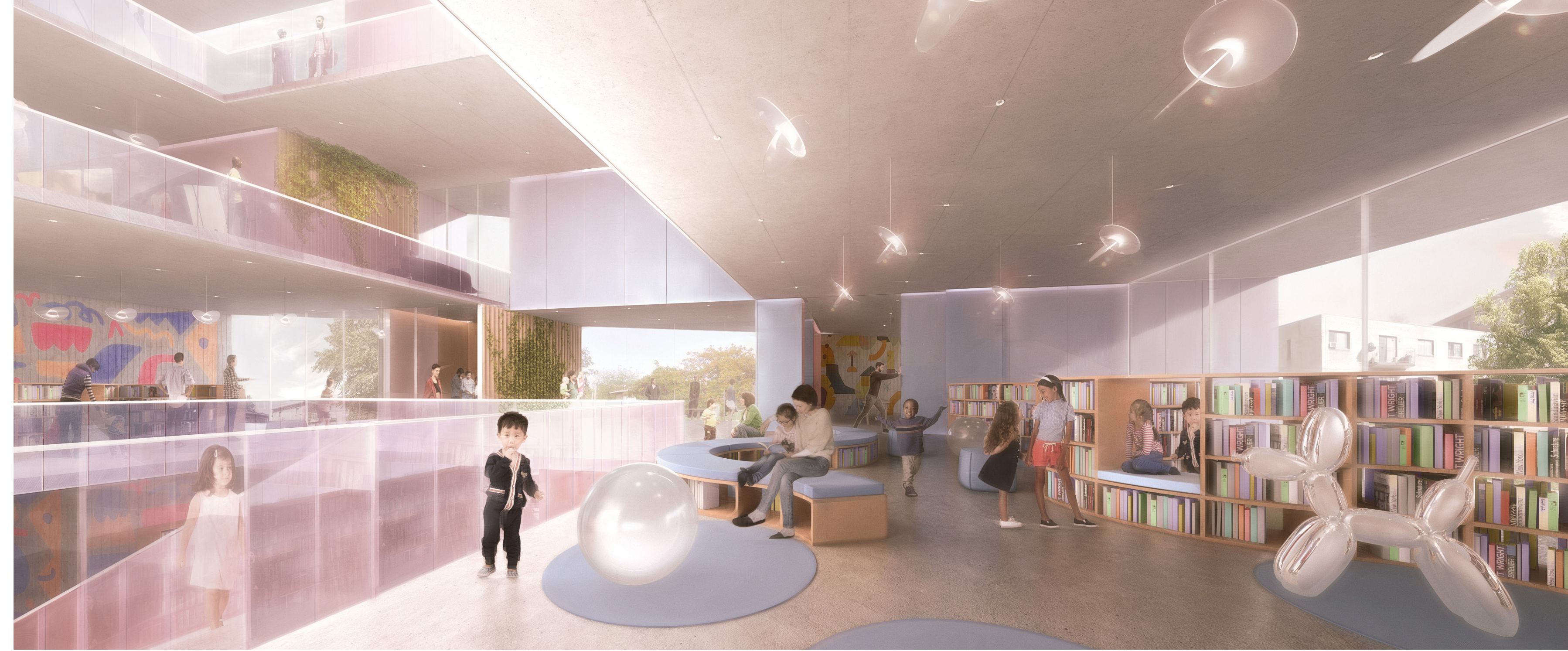
ZONE DES TOUT-PETITS: POUR RÊVER GRAND