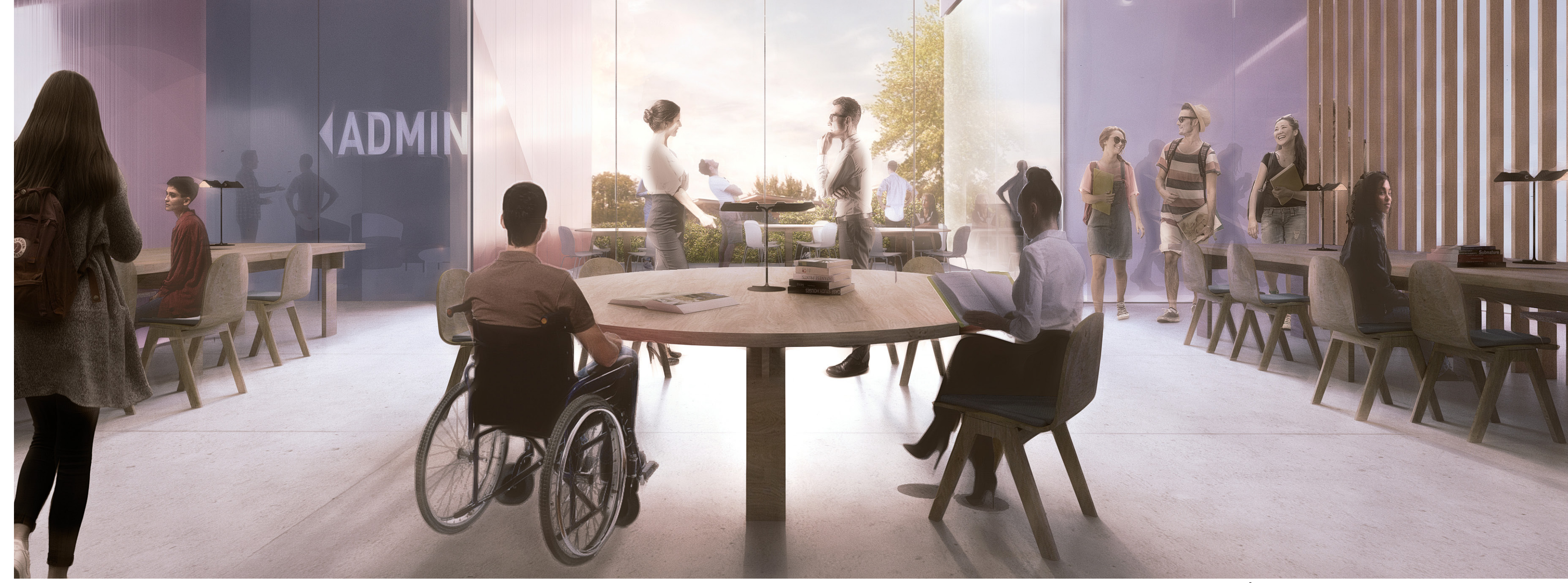
ESPACE DE TRAVAIL À L'IMAGE DES ESPACES COLLECTIF