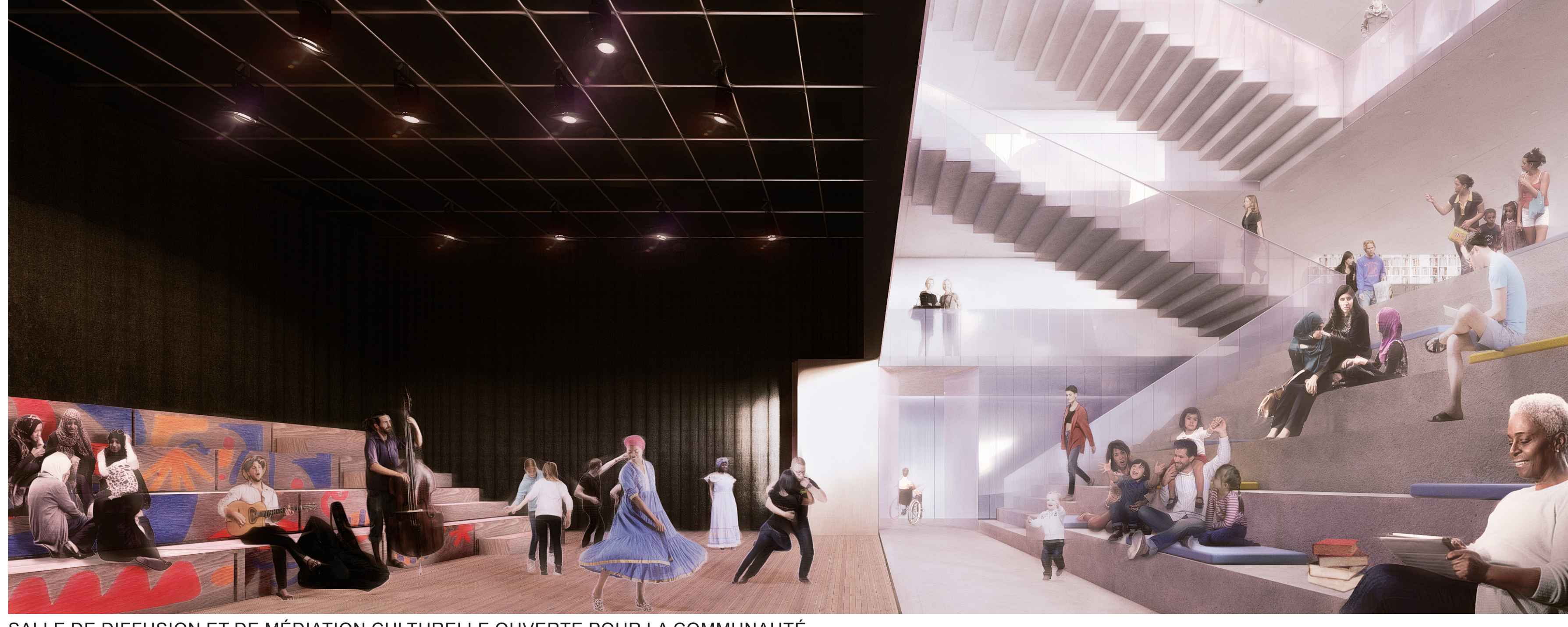
SALLE DE DIFFUSION ET DE MÉDIATION CULTURELLE OUVERTE POUR LA COMMUNAUTÉ