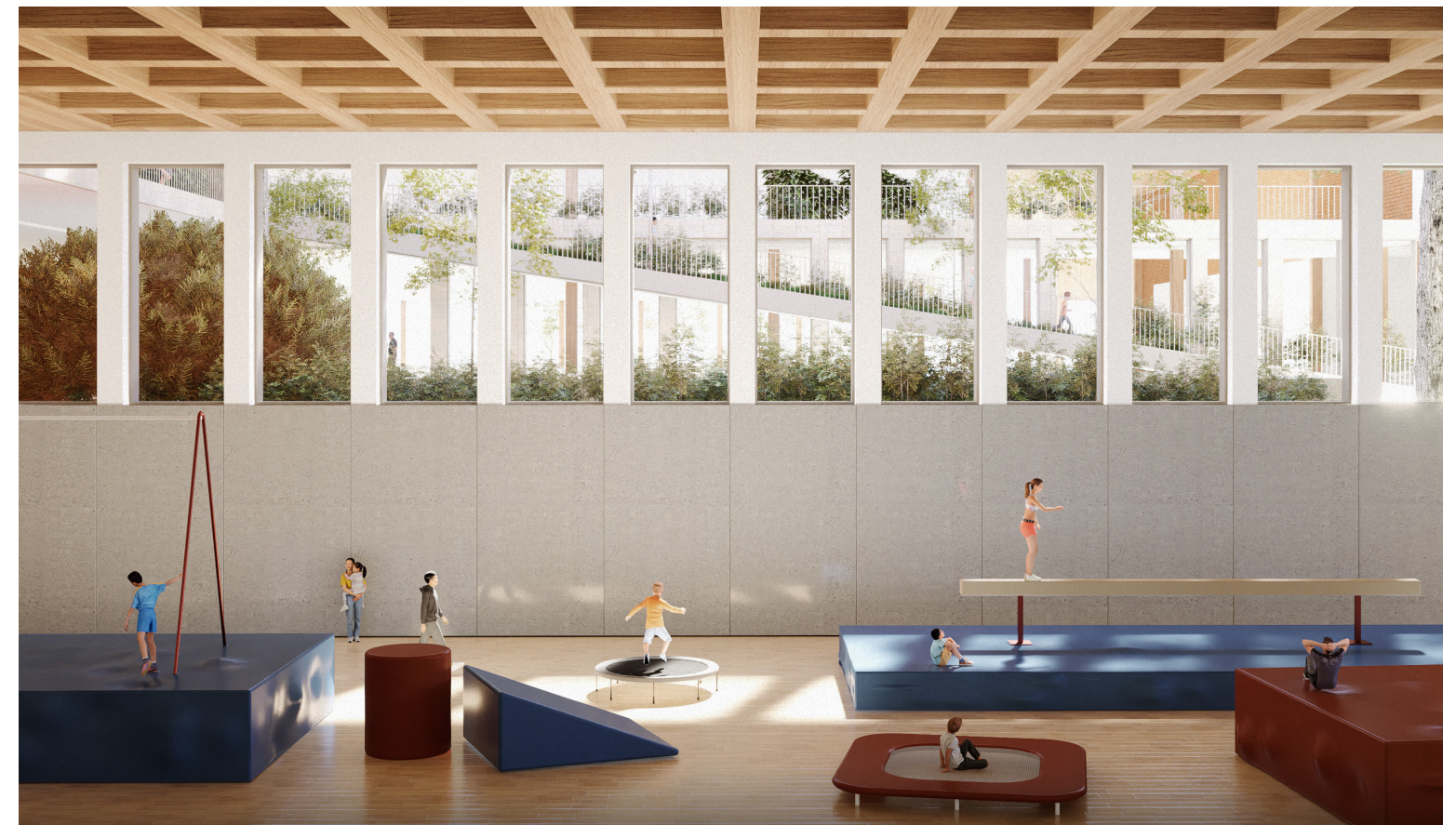
Vue perspective de la nouvelle palestre dans le secteur Ouest