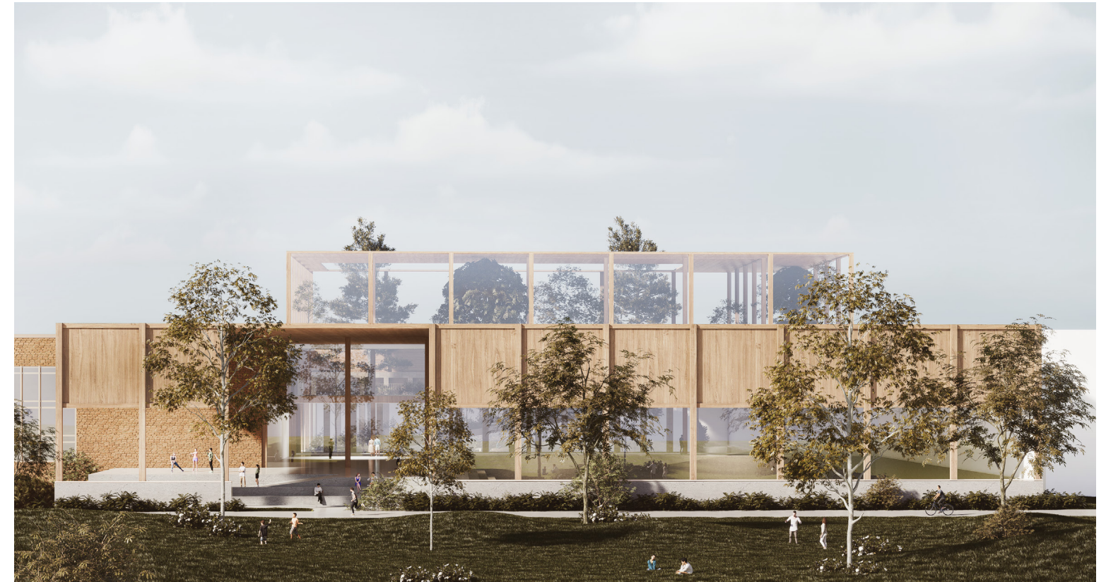
Vue perspective de l'entrée Est et de Parvis en relation avec le parc Gadbois