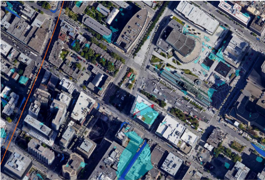
Carte no. 1 Cuvette

La « carte no. 2 Écoulement » indique le sens général d'écoulement des eaux selon la topographie. Évidemment, dans la réalité, l'écoulement des eaux dépend des obstacles au sol ( par exemple les trottoirs).