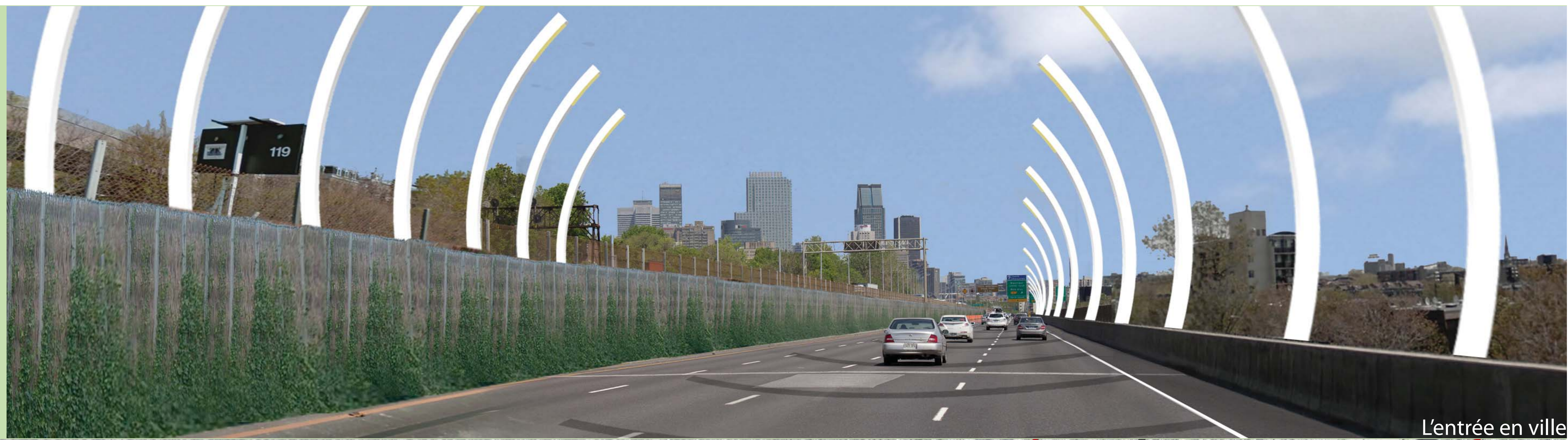
L'entrée en ville

La spirale réapparait Un dialogue continué reliant la ville et la banlieue. Un regard sur la plasticité de la matière urbaine en évolution.