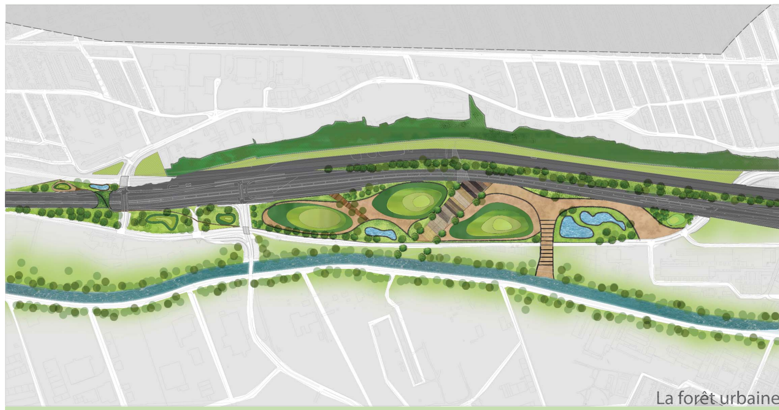
La forêt urbaine