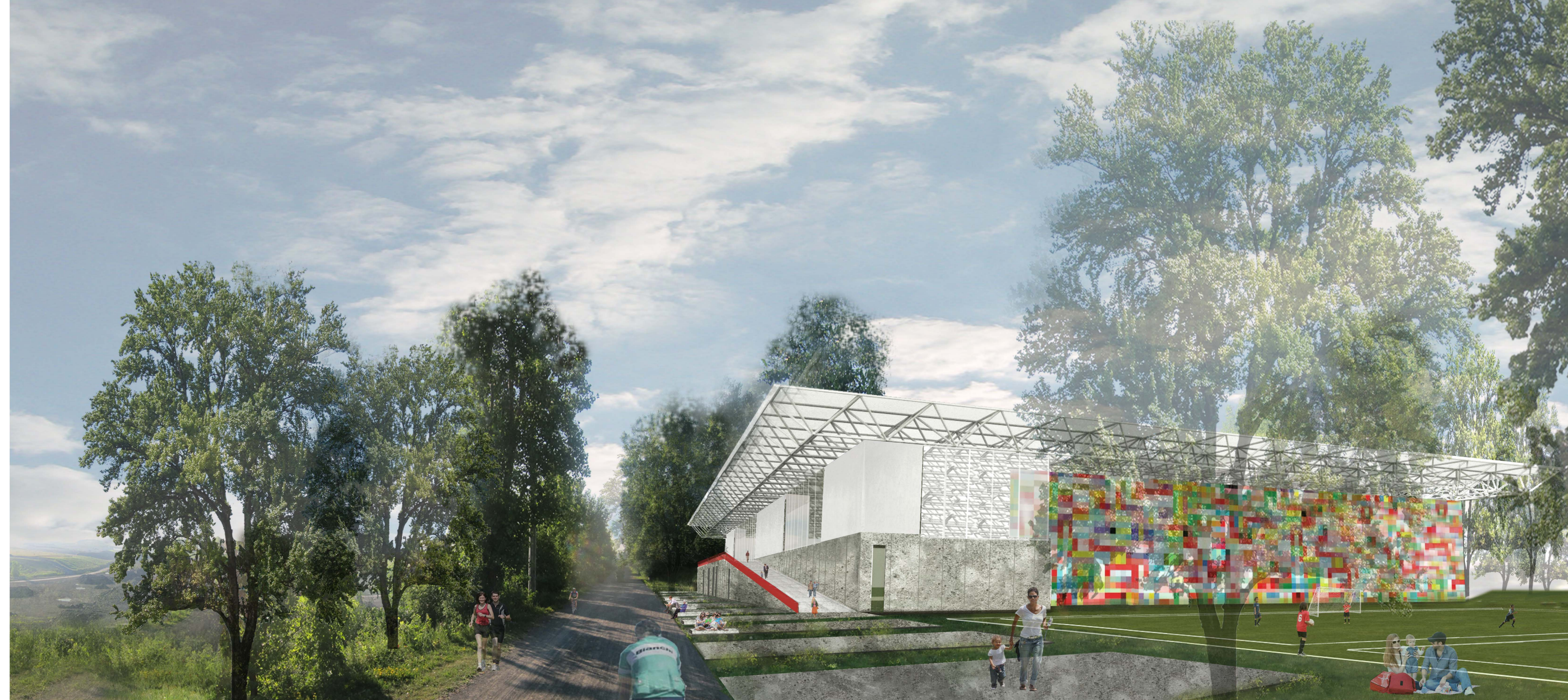
Vue du sentier polyvalent : une halte collective ouverte sur le paysage