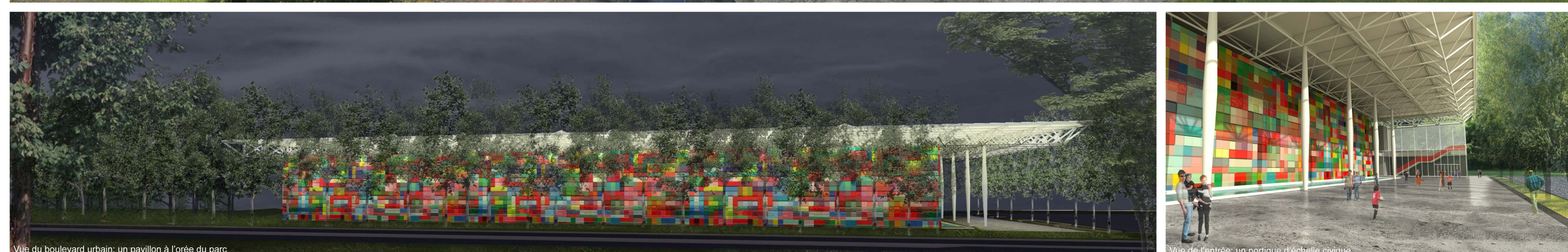
Vue du boulevard urbain : un pavillon à l'orée du parc