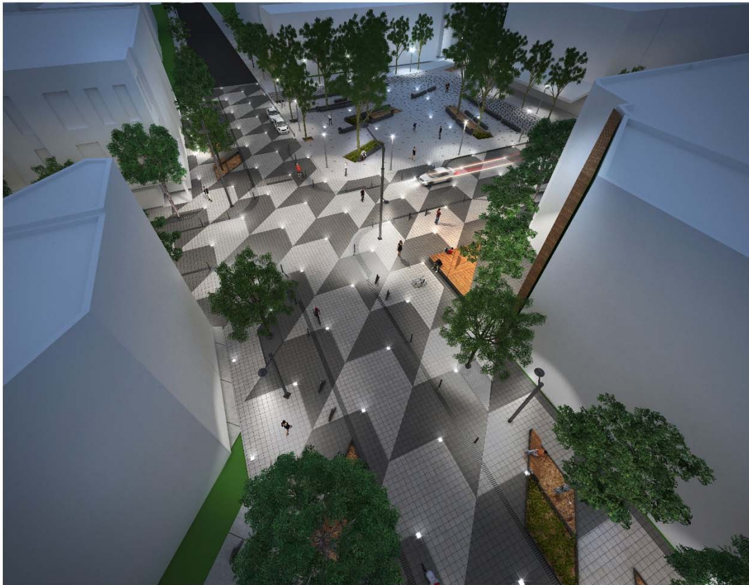
P4 - PERSPECTIVE D'AMBIANCE DE NUIT VUE À VOL D'OISEAU À L'INTERSECTION DE L'AVENUE VALOIS ET DE LA PROMENADE LUC-LARRIVÉE

Le lampadaire Citadin est utilisé ailleurs sur la rue Ontario au métro Frontenac. Il est reconduit dans la zone de rencontre Valois. Le modèle éclairage de rue et le modèle éclairage combiné (rue et trottoir) sont choisis pour le projet. Les lampadaires de la place Valois sont conservés mais les futs lumineux sont remplacés par un éclairage au DEL.