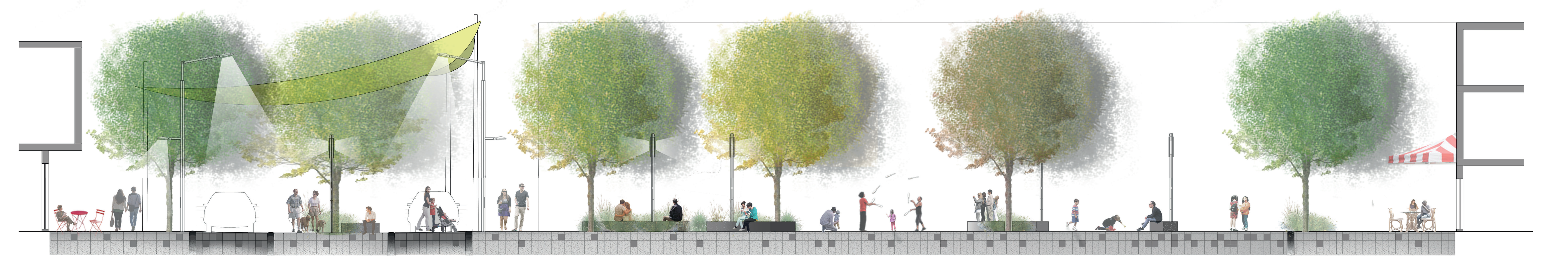
COUPE B - RUE ONTARIO EST ÉCHELLE 1:100 Trottoir, Rue partagée direction Est (Chaussée rehaussée (3.5m)), Place centrale, Rue partagée direction Ouest (Chaussée rehaussée (3.5m)), Place Valois.