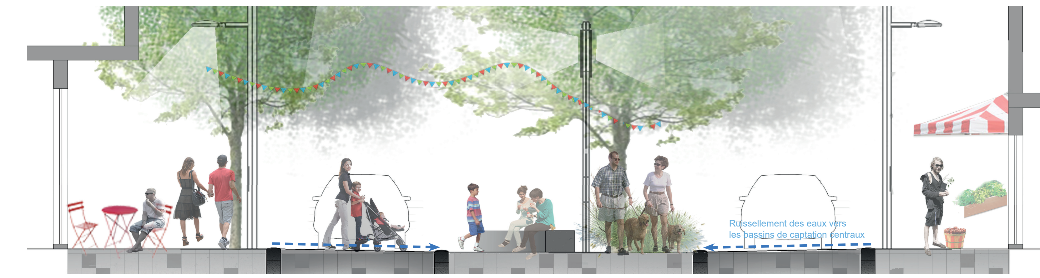
COUPE A - RUE ONTARIO OUEST ÉCHELLE 1:50 Trottoir, Rue partagée direction Est (Chaussée rehaussée. Largeur : 3.5m), Bancs et fosse de plantation avec bassin de captation agissant comme marais filtrant, Place centrale, Rue partagée direction Ouest (Chaussée rehaussée. Largeur : 3.5m), Trottoir.