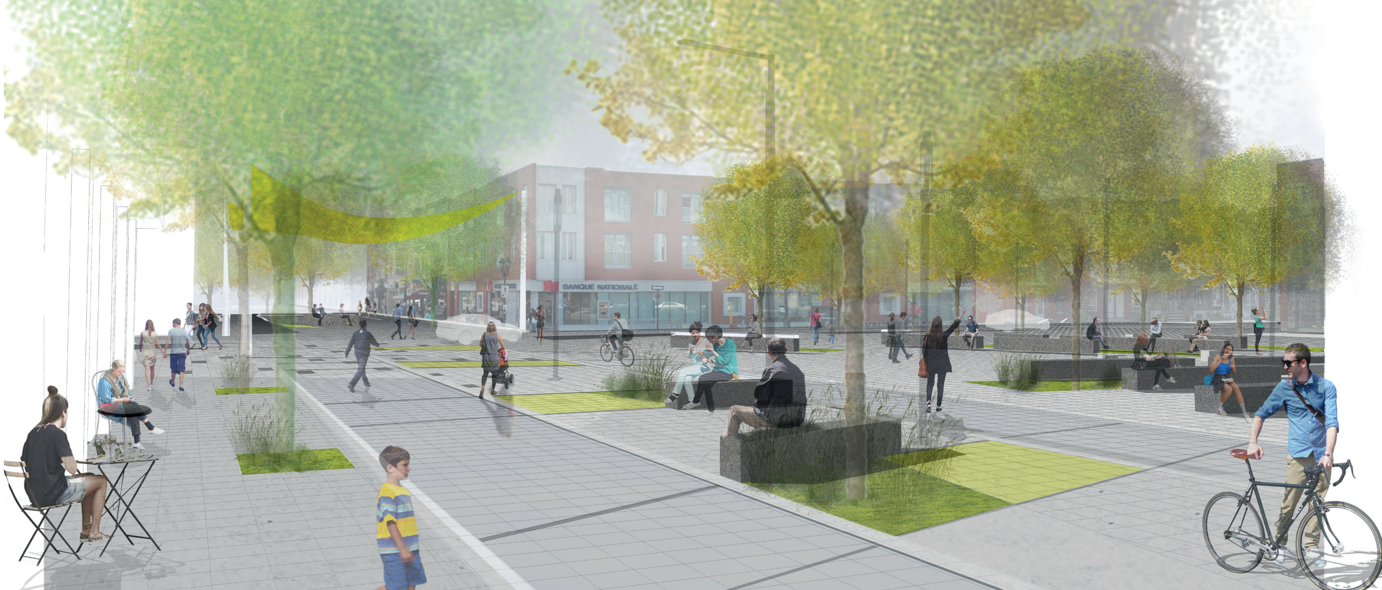
B-VUE SUR LA RUE ONTARIO DEPUIS L'OUEST