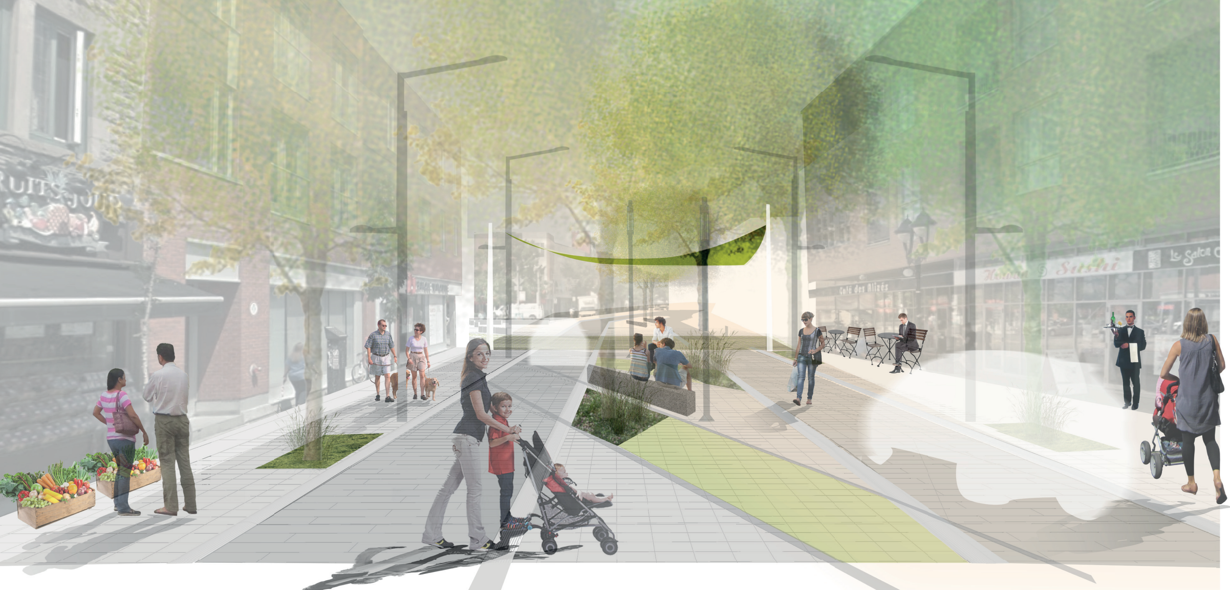
A-VUE SUR LA ZONE DE RENCONTRE DEPUIS LA RUE ONTARIO