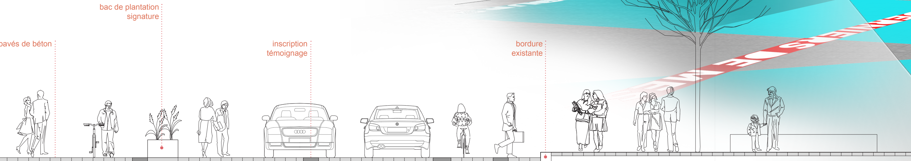
COUPE RUE ONTARIO 1:50

Le patron d'aménagement se repose des principes d'accessibilité universelle et intergénérationnelle. Il se prolonge également sur le plan vertical en proposant l'intégration d'une œuvre d'art évolutive et participative. Le mur aveugle riverain devient une invitation à l'échange, lequel contribuera parmi tant d'autres à l'émergence d'une œuvre commune. L'espace de rencontre Simon Valois marque un artefact singulier au cœur de la trame urbaine et paysagère d'un secteur en profonde transformation sociale et urbaine. Le geste est vigoureux et symbolise l'avant-gardisme de tout un quartier. Il poursuit les efforts de revitalisation et de mise en valeur du quartier selon une nouvelle approche. Les personnages du quotidien composent ici chacune des pièces et sont ainsi au cœur du processus d'idéation de cet espace public, à l'image de leurs histoires, de leurs expériences locales et de leurs visions d'avenir.