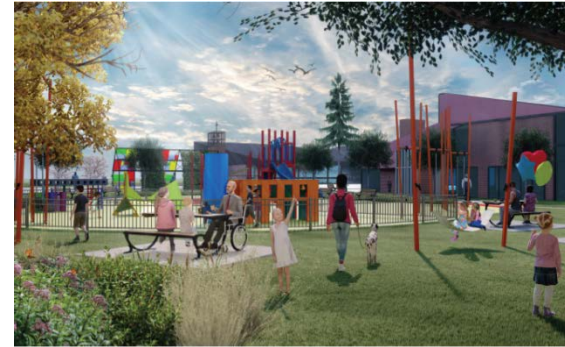
VUE DEPUIS L'INTÉRIEUR DU PARC

La circulation dans le parc est constituée de deux allées piétonnes en boucle entièrement reconstruites : l'une dans la partie Nord du parc est asphaltée, tandis que l'autre, autour de la