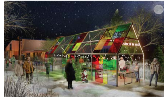
VUE À PARTIR DU STATIONNEMENT

Le concept de commémoration s'explique en bref par des familles d'objets interactifs qui représentent en deux ou trois dimensions une dizaine d'œuvres iconiques de Hanganu.