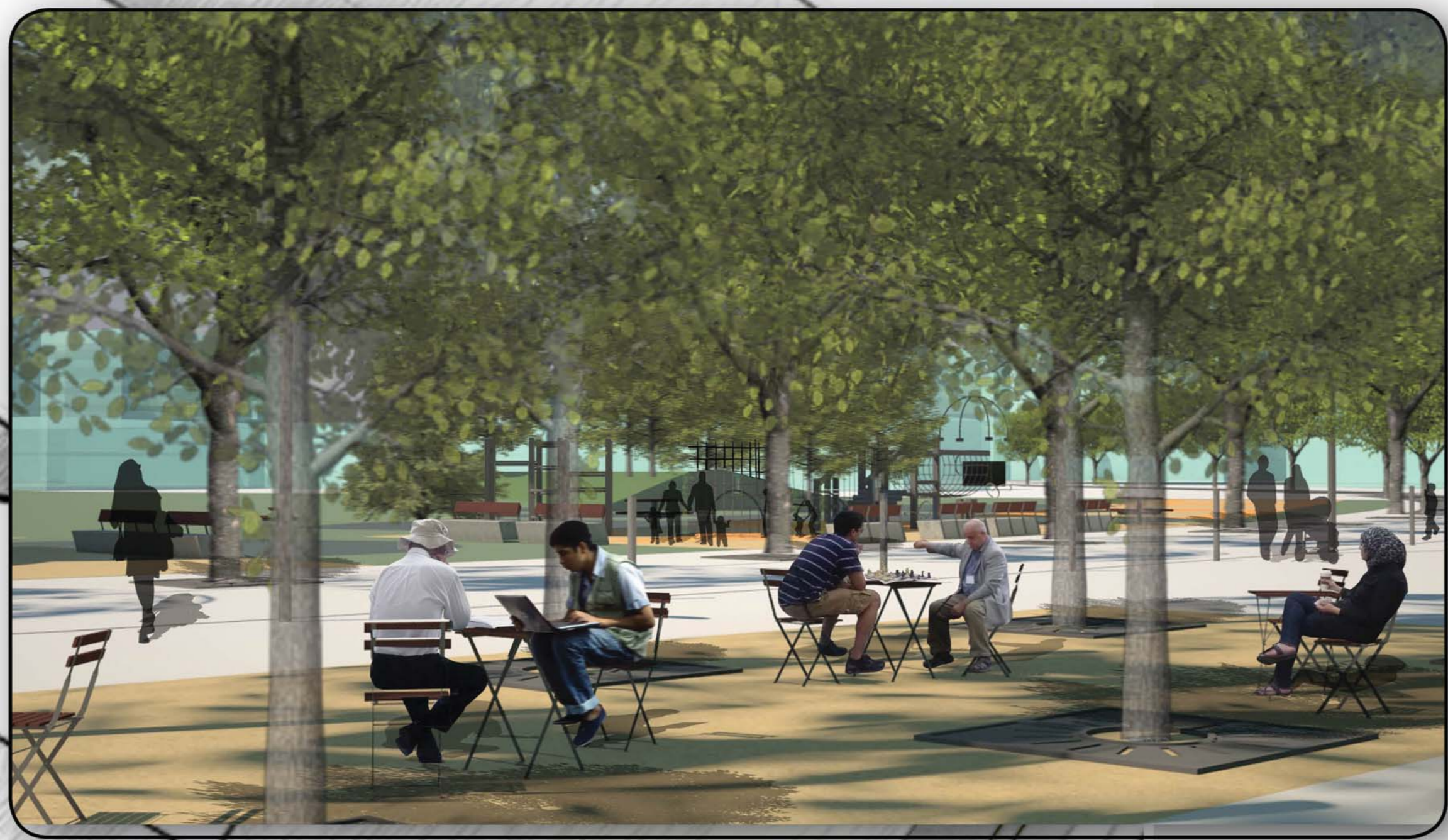
Perspective d'ambiance des squares de la place