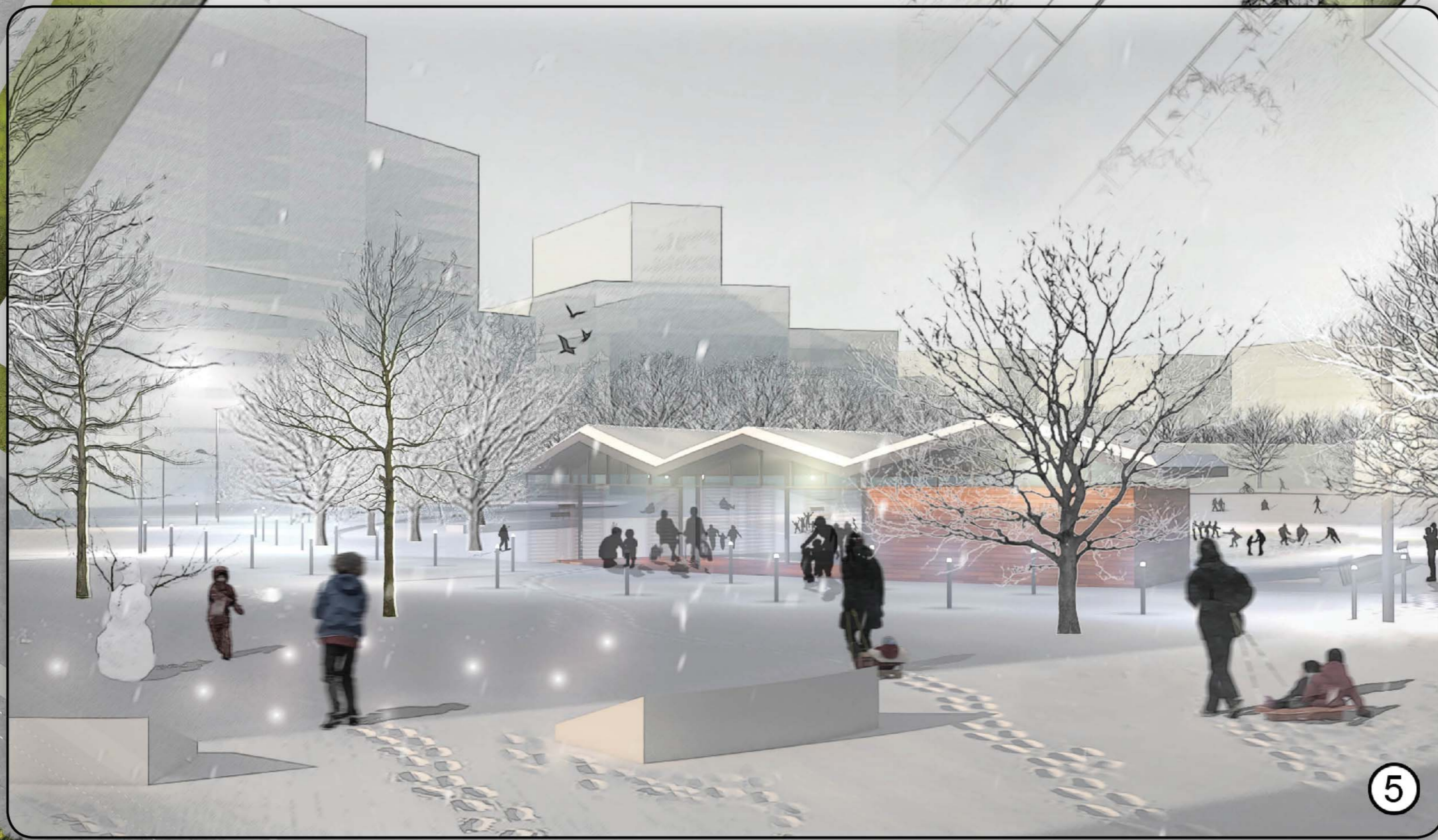
Perspective hivernale du parc vu de la place

Propices à la conversation, la lecture et l'observation, les squares sont plantés d'un couvert végétal dense, et peuvent être loués pour des rassemblements privés. Une annexe en plein air de la bibliothèque installée au rez-de-chaussée du bâtiment adjacent dispense des livres. Un terrain de pétanque et des tables à ping-pong favorisent la mobilité douce.