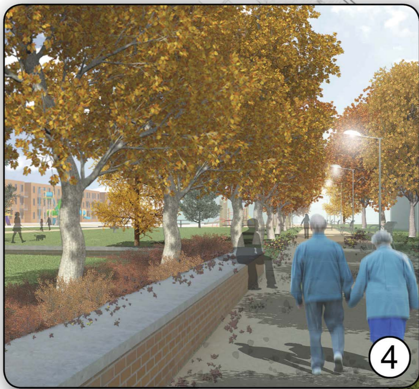
Perspective automnale d'un espace semi-public