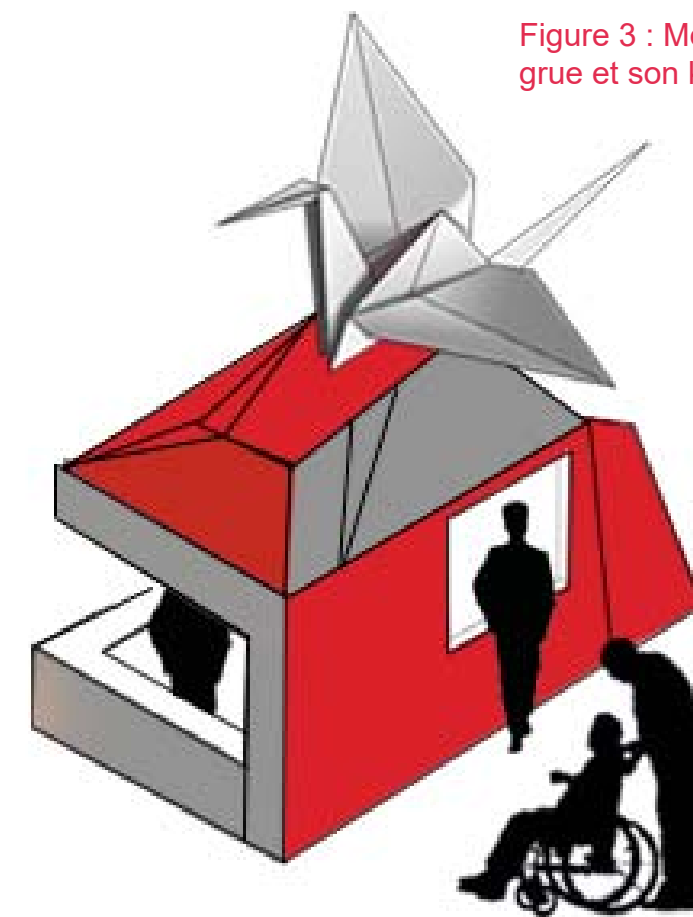
Figure 3 : Module 2 - vue en perspective de la grue et son kiosque