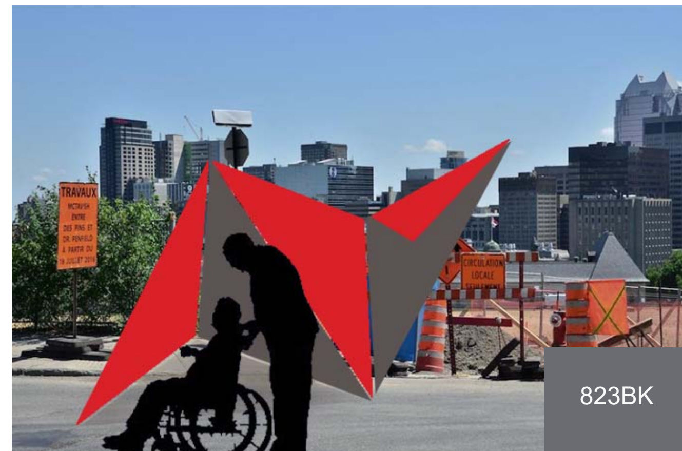
Figure 4 : Exemple d'intégration d'un module 1 dans un chantier