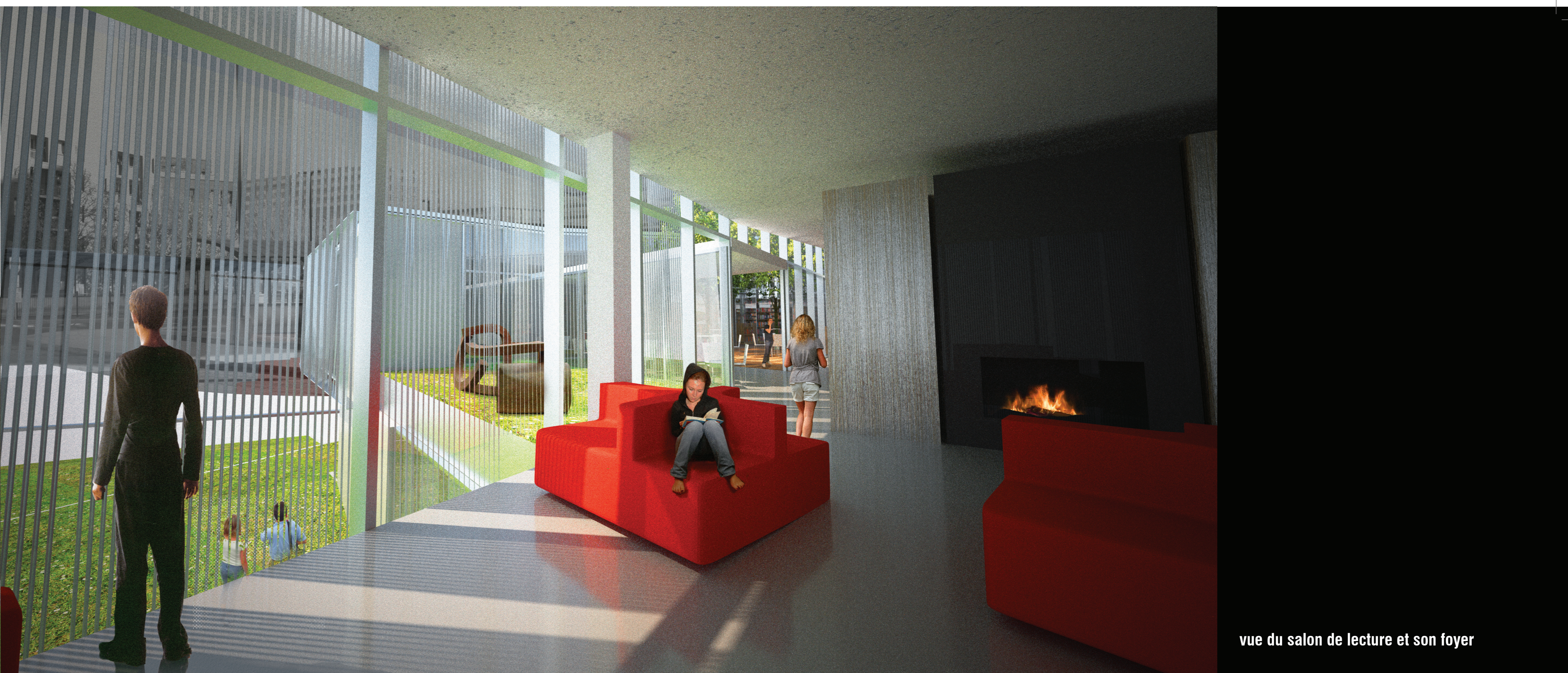
vue du salon de lecture et son foyer