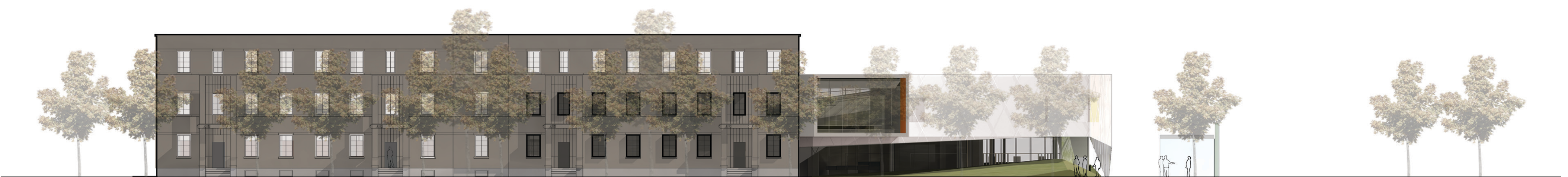
ÉLEVATION NORD 1:200