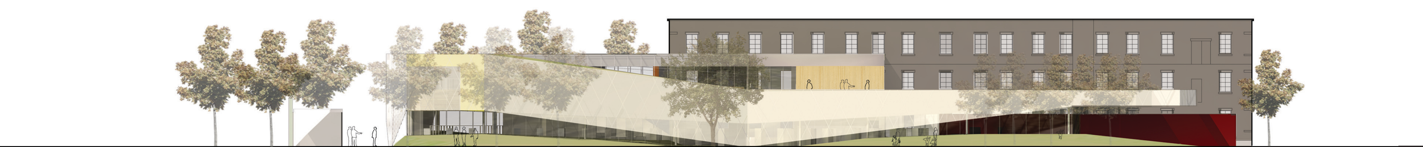
ÉLEVATION SUD 1:200