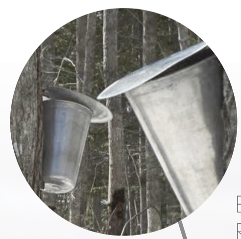
BOÎTES DE RÉSONANCE