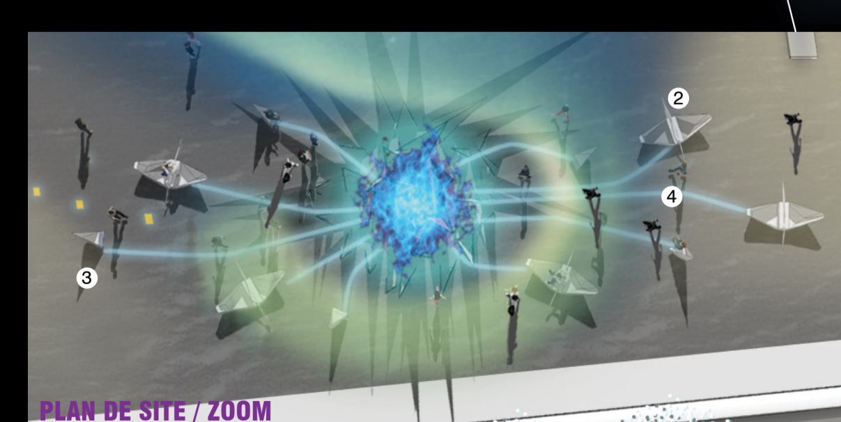
PLAN DE SITE / ZOOM