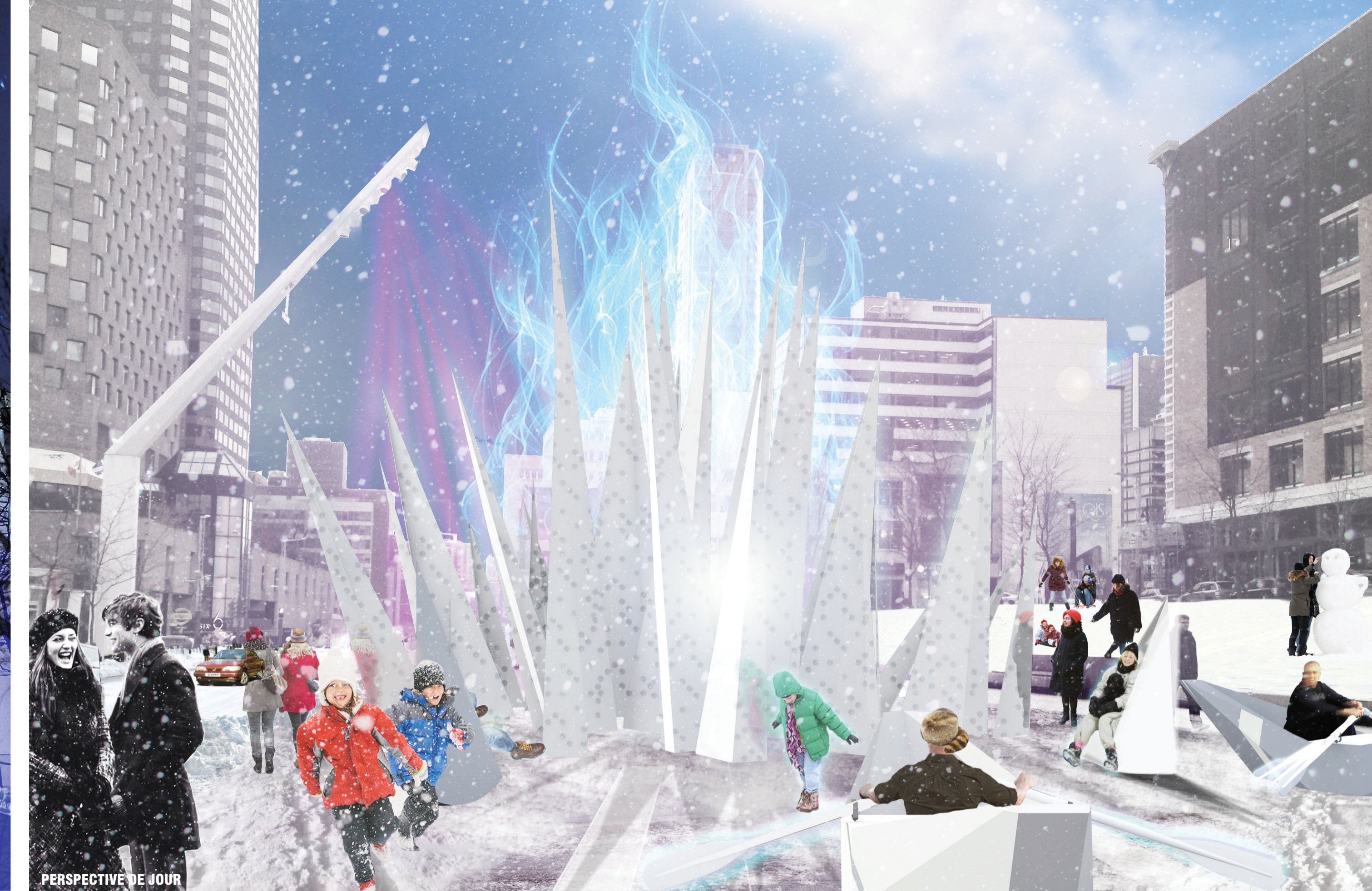
PERSPECTIVE DE JOUR