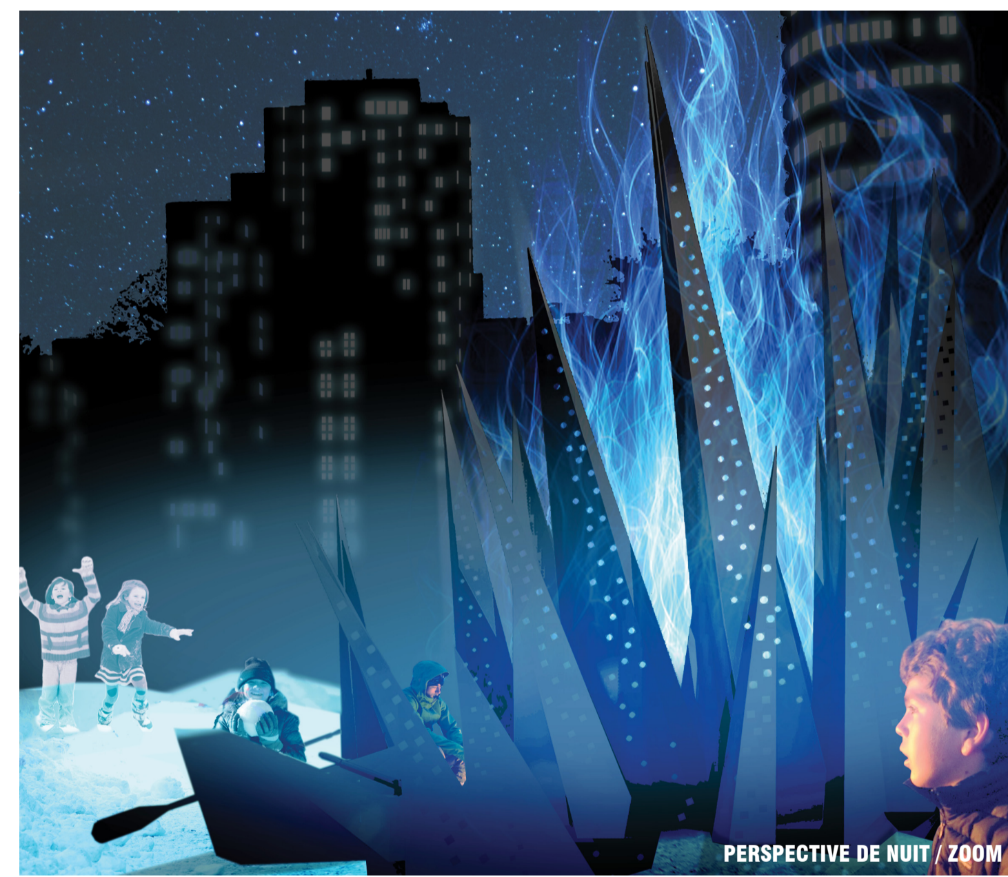
PERSPECTIVE DE NUIT / ZOOM