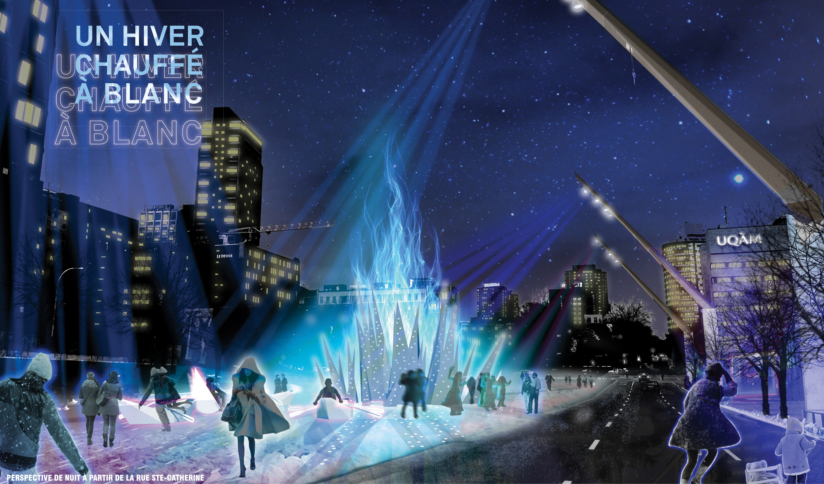
PERSPECTIVE DE NUIT À PARTIR DE LA RUE STE-CATHERINE