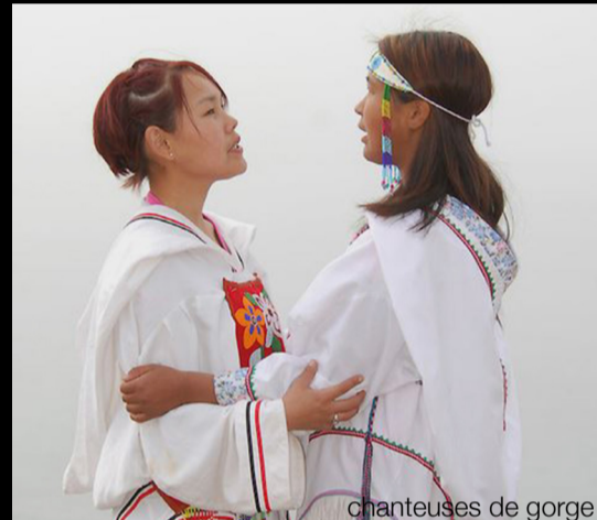
Chanteuses de gorges

Invités par le Katajaniq - chant de gorge inuit, premier élément déposé dans le patrimoine immatériel du Québec - les visiteurs de la Place des Arts vivront l'expérience d'une rencontre inusitée avec des «chanteuses» vêtues de lumière.