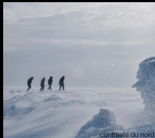
contraste du nord