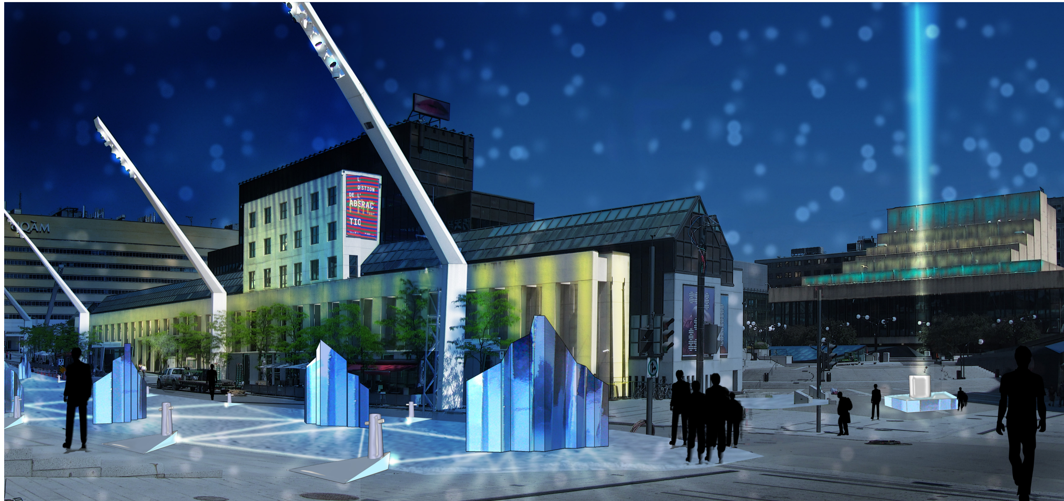
en haut: perspective de nuit / rue Ste-Catherine à droite: plan de circulation