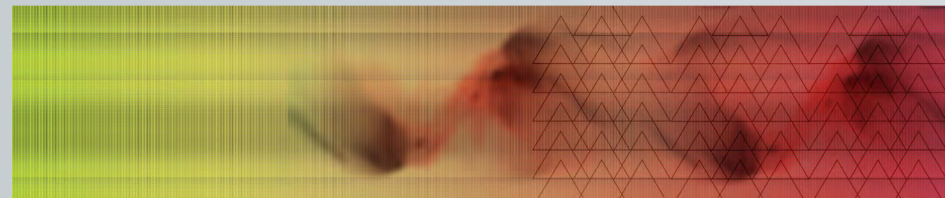
1. Toile de fond