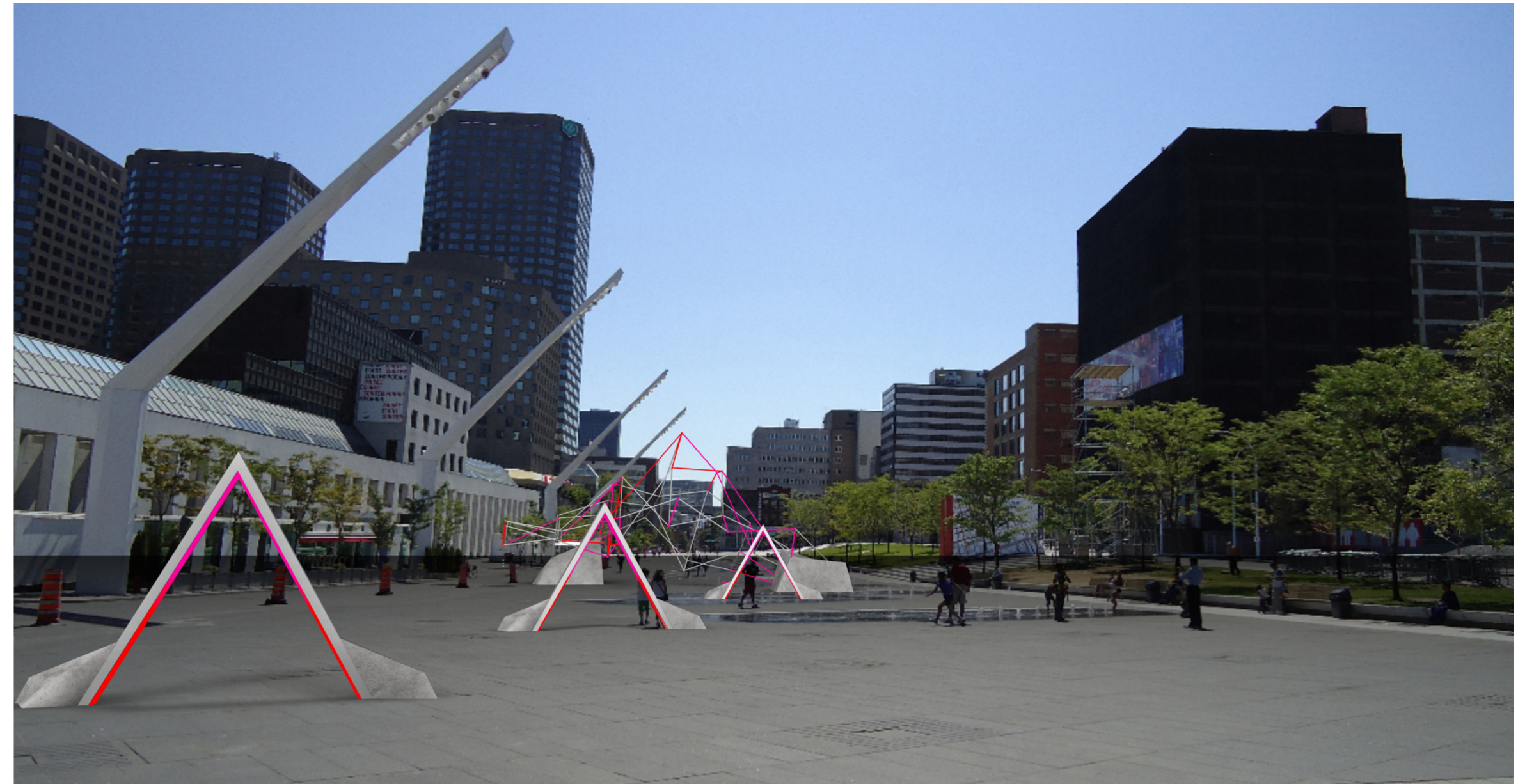
Dès les douze coups de minuit, les arches et la structure diffusent un spectacle de son, lumière et projection. Pour la suite de l'exploitation, ces dernières s'éclaireront au passage des participants pour créer un chemin de lumière (visible de jour grâce à la technologie LED) vers la structure centrale.