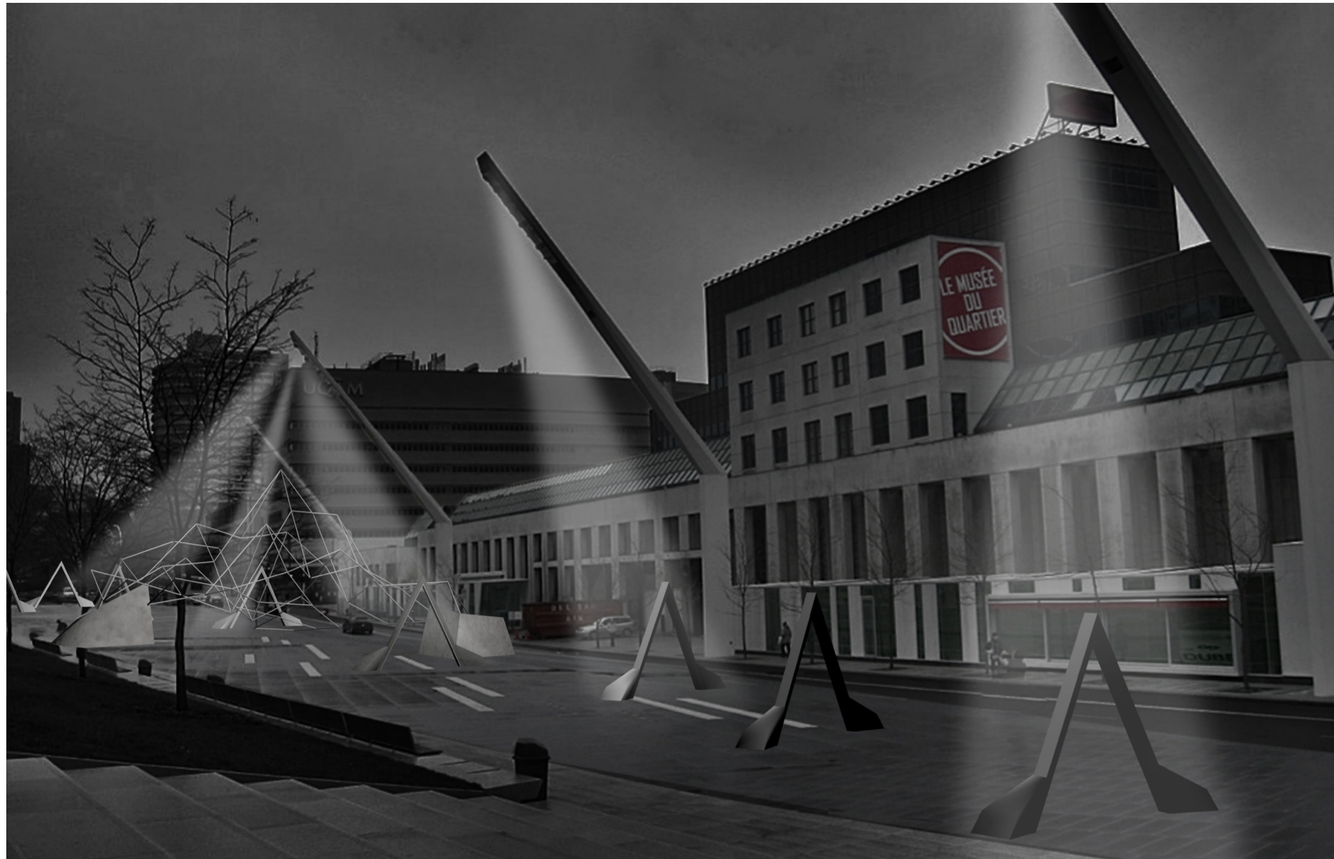
Les huit arches habillent la Place des Festivals et incitent les passants à parcourir le chemin qu'elles composent vers la structure centrale. Avant le nouvel an , la mise en lumière est assurée par les structures d'éclairage de la Place.