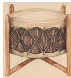
Grand tambour de Pow-Wow

En soirée, l'espace devient magique : un éclairage DEL intégré au plancher met en valeur les textures chaleureuses du bois dans son fini naturel, dialoguant ainsi avec la façade du bâtiment multifonctionnel. Que ce soit pour tambouriner, chanter, danser