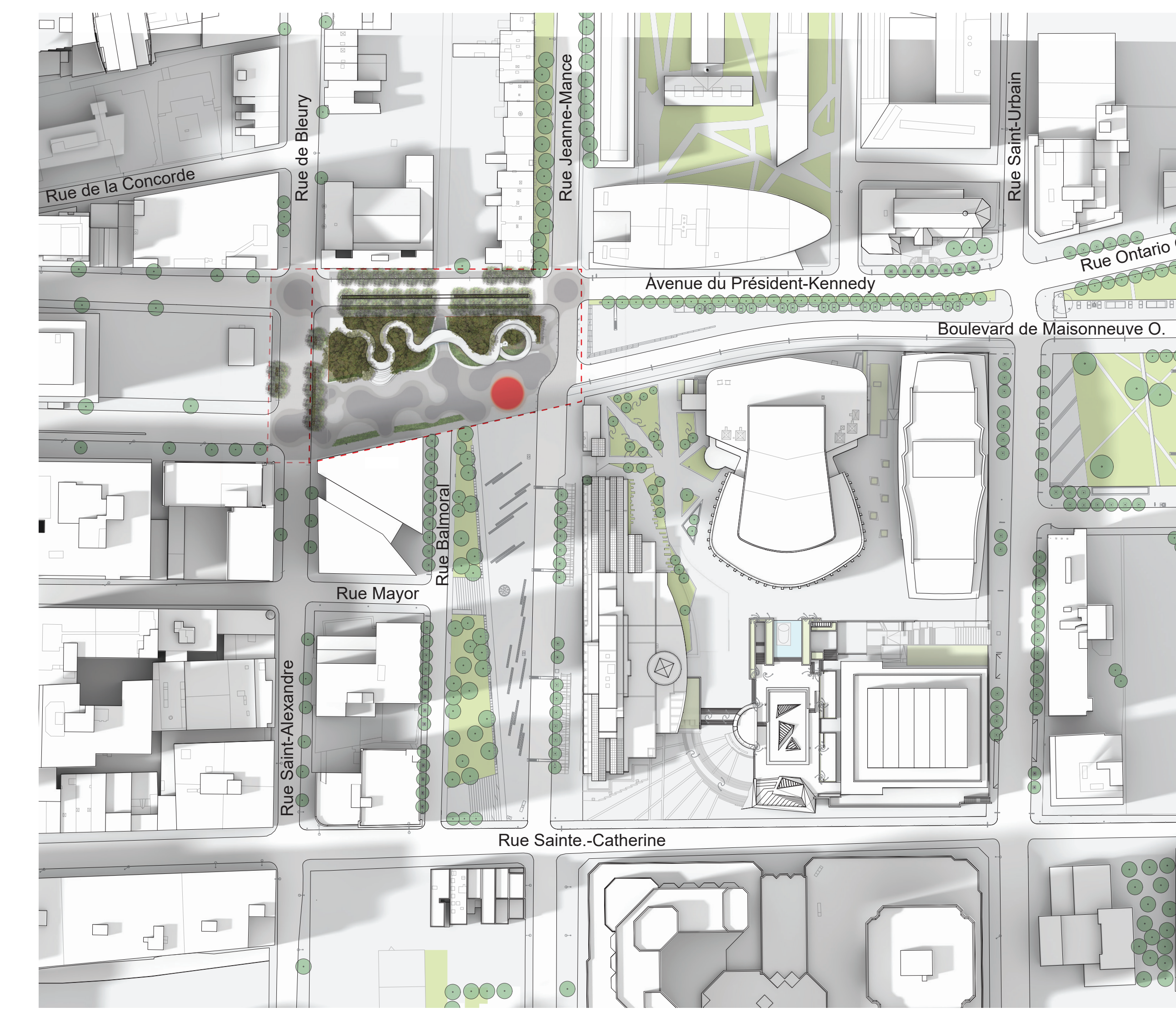
PLAN DU SITE ÉCHELLE - 1:1500

ESPACE DYNAMIQUE La passerelle offre 3 zones d'activités avec des intensités variées: calme et contemplation du côté de la rue De Bleury; socialisation et rassemblement au centre de la passerelle; ambiance ludique du côté de la rue Jeanne-Mance.