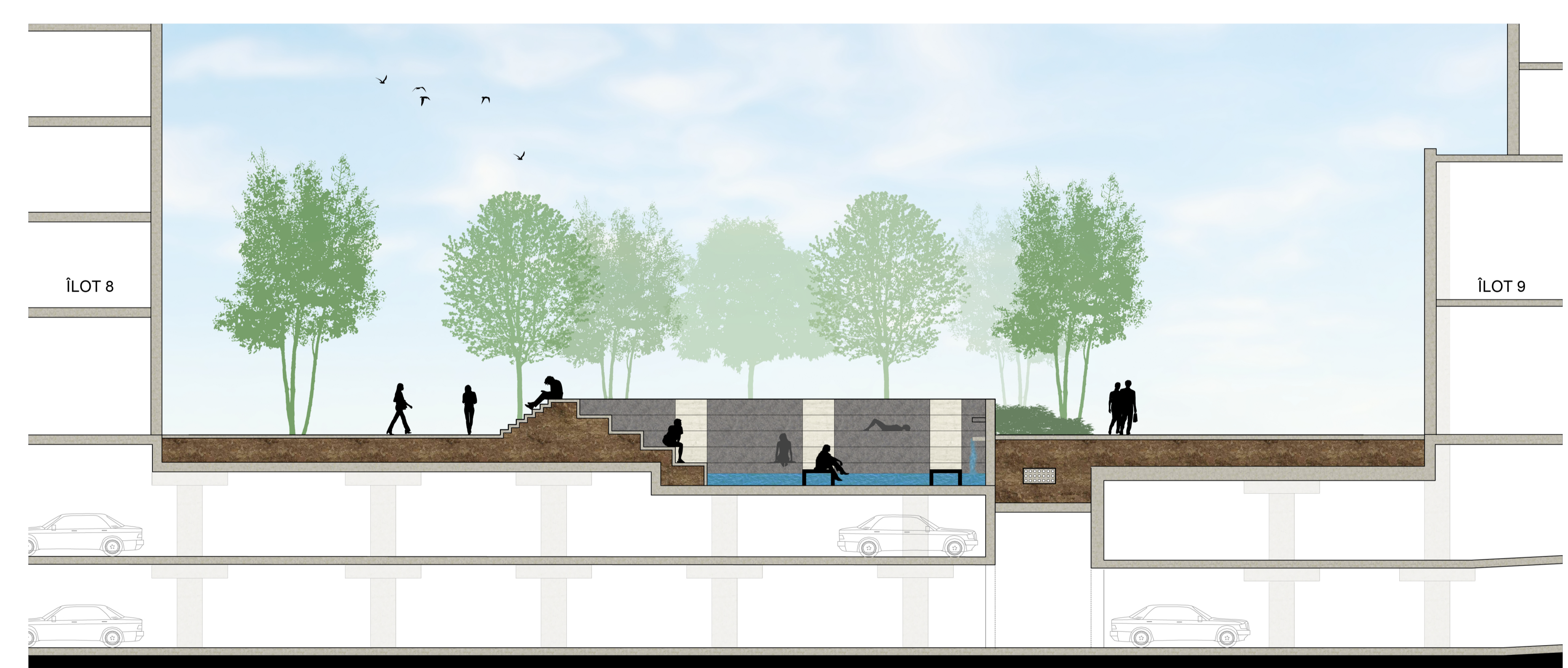
1 / coupe OASIS URBAINE