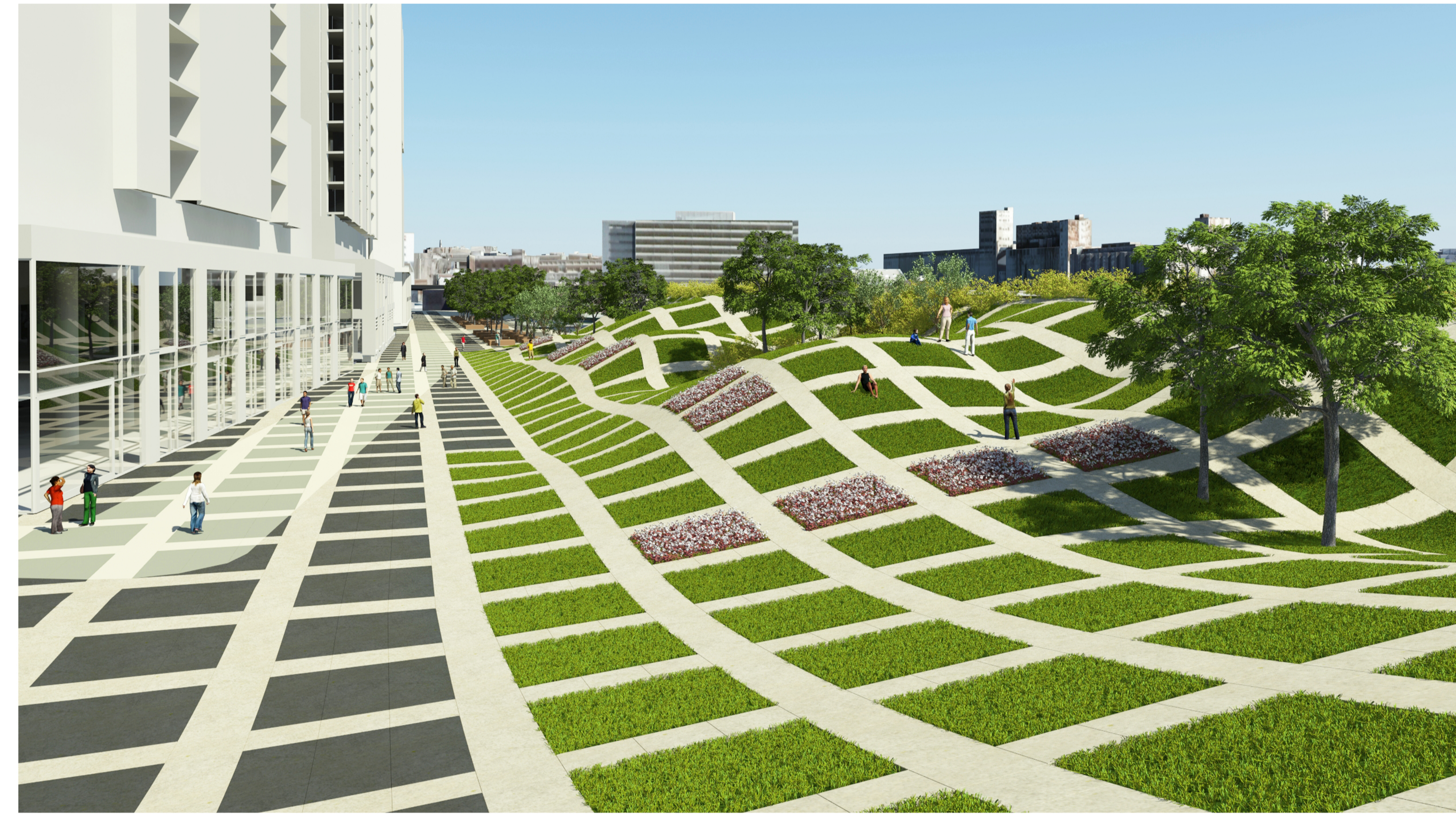
b / perspective LES COLLINES