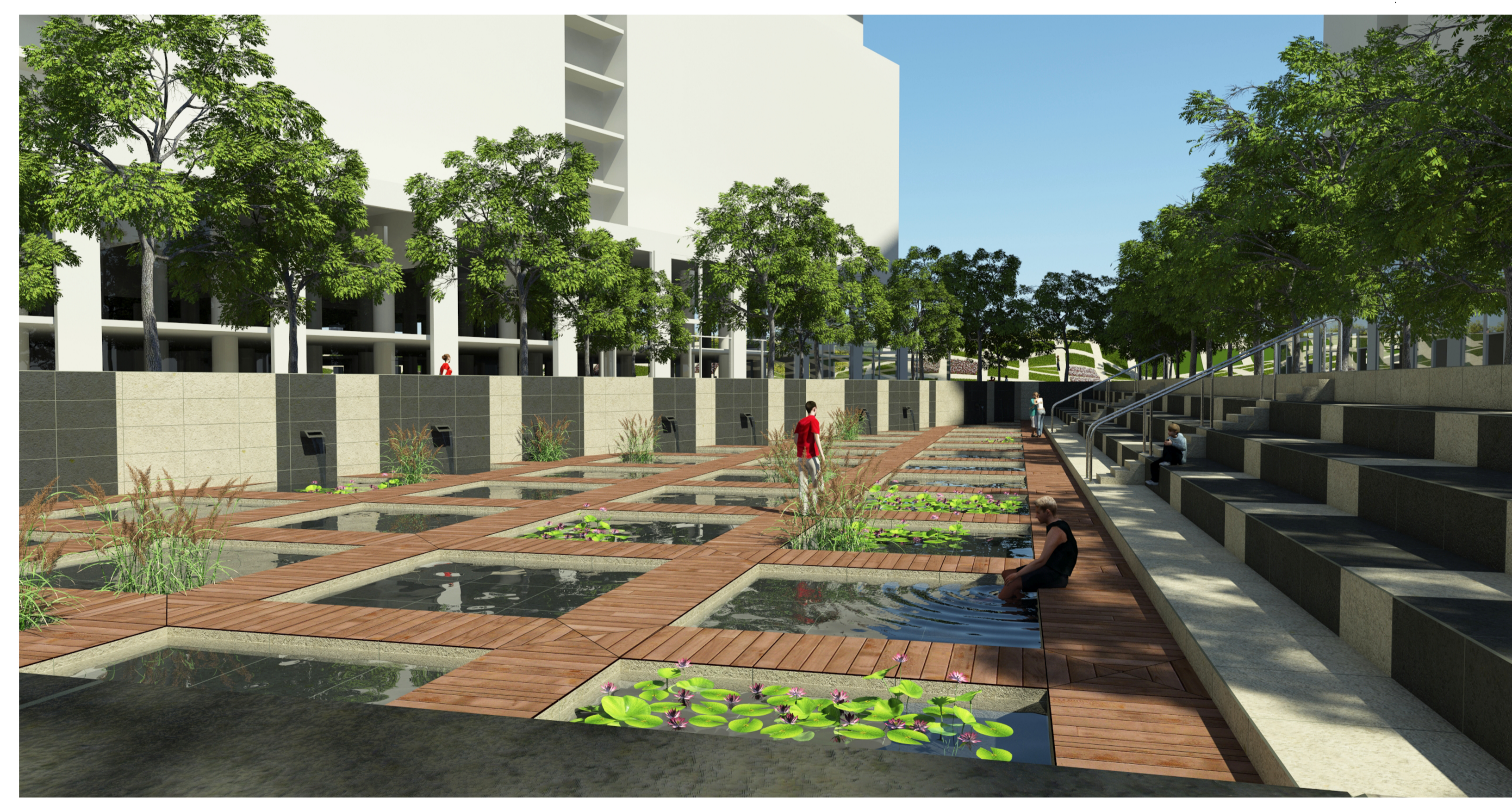
c / perspective OASIS URBAINE