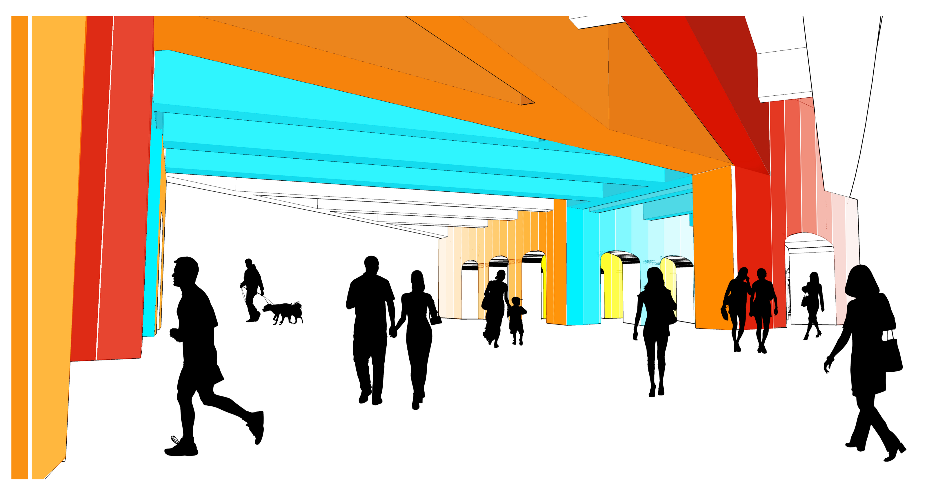
a / perspective ENTRÉE COLORÉE