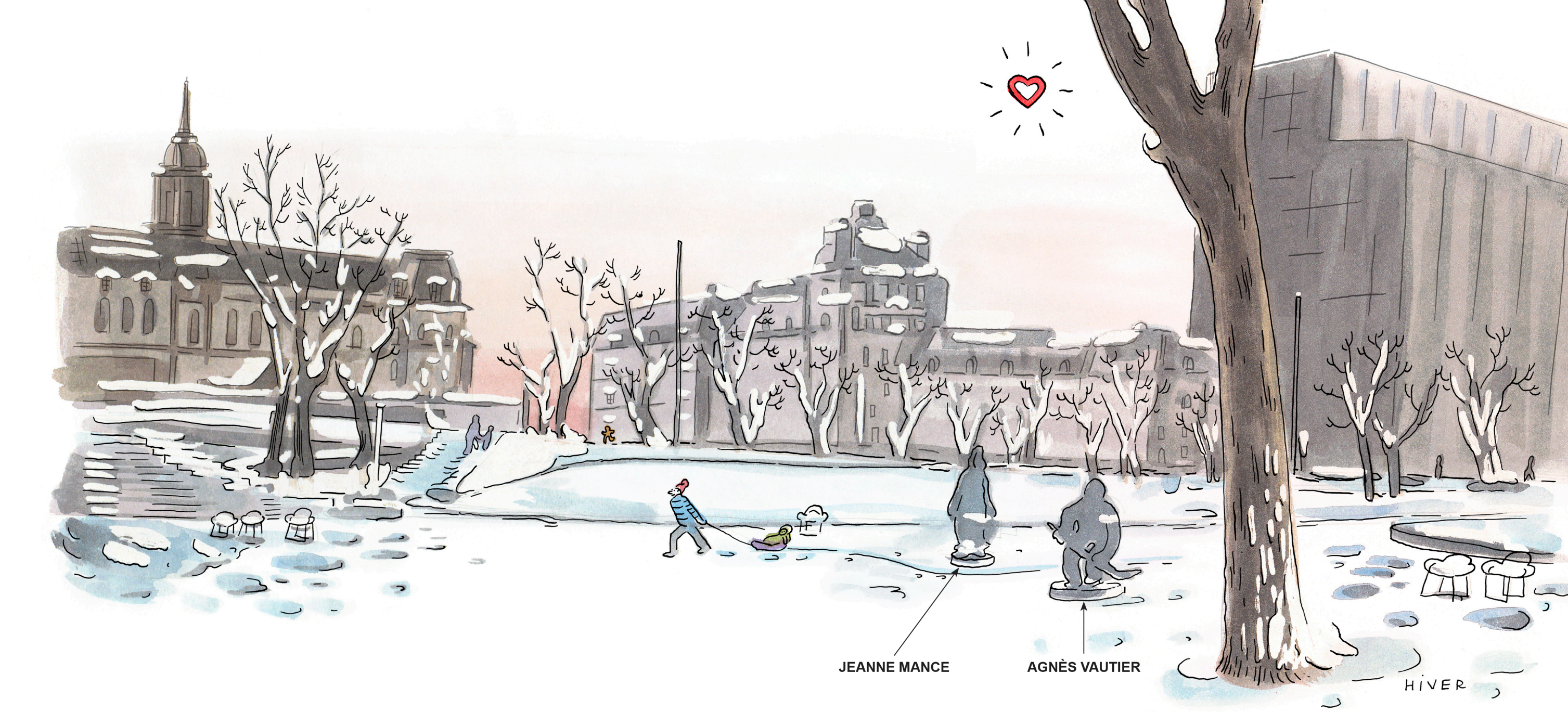
VUE DEPUIS LA STATION DE MÉTRO VERS LA CITÉ ADMINISTRATIVE