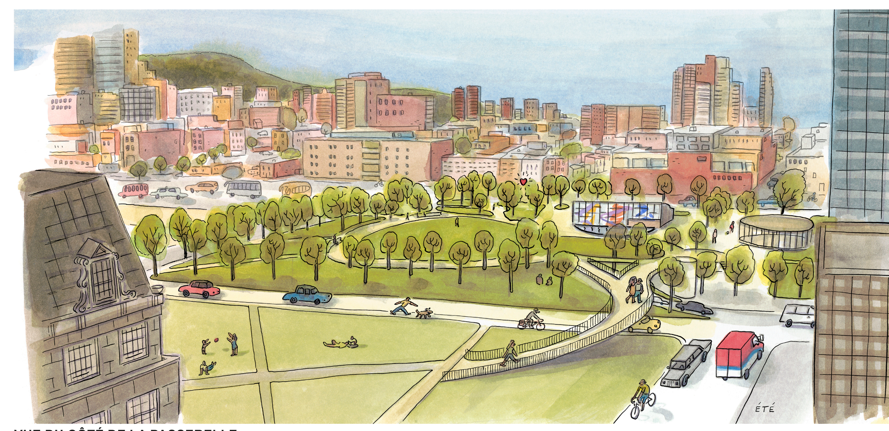
VUE DU CÔTÉ DE LA PASSERELLE

COEUR LUMINEUX DE LA VILLE Occupant le ciel au centre de la clairière, un cœur lumineux flotte au-dessus de l'espace et veille jour et nuit sur l'activité de la Place des Montréalaises. Il est le point de convergence de tous les sentiers, y compris ceux de la passerelle. Suspendu sur des caténaires en hauteur, le Cœur est aussi visible depuis l'autoroute Ville-Marie, signalant ce point fort de la psychographie de Montréal. Généreux et intangible, il dispense sans compter sa lumière bienveillante.