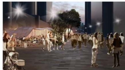
Vue 2 : Impression of the shared street at night

Vue 2 : Impression nocture de la rue partagée