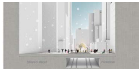
Section B - Scale 1:250

Vue 2 : Impression nocture de la rue partagée