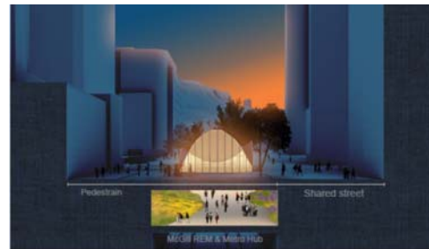
Section A - Scale 1:250