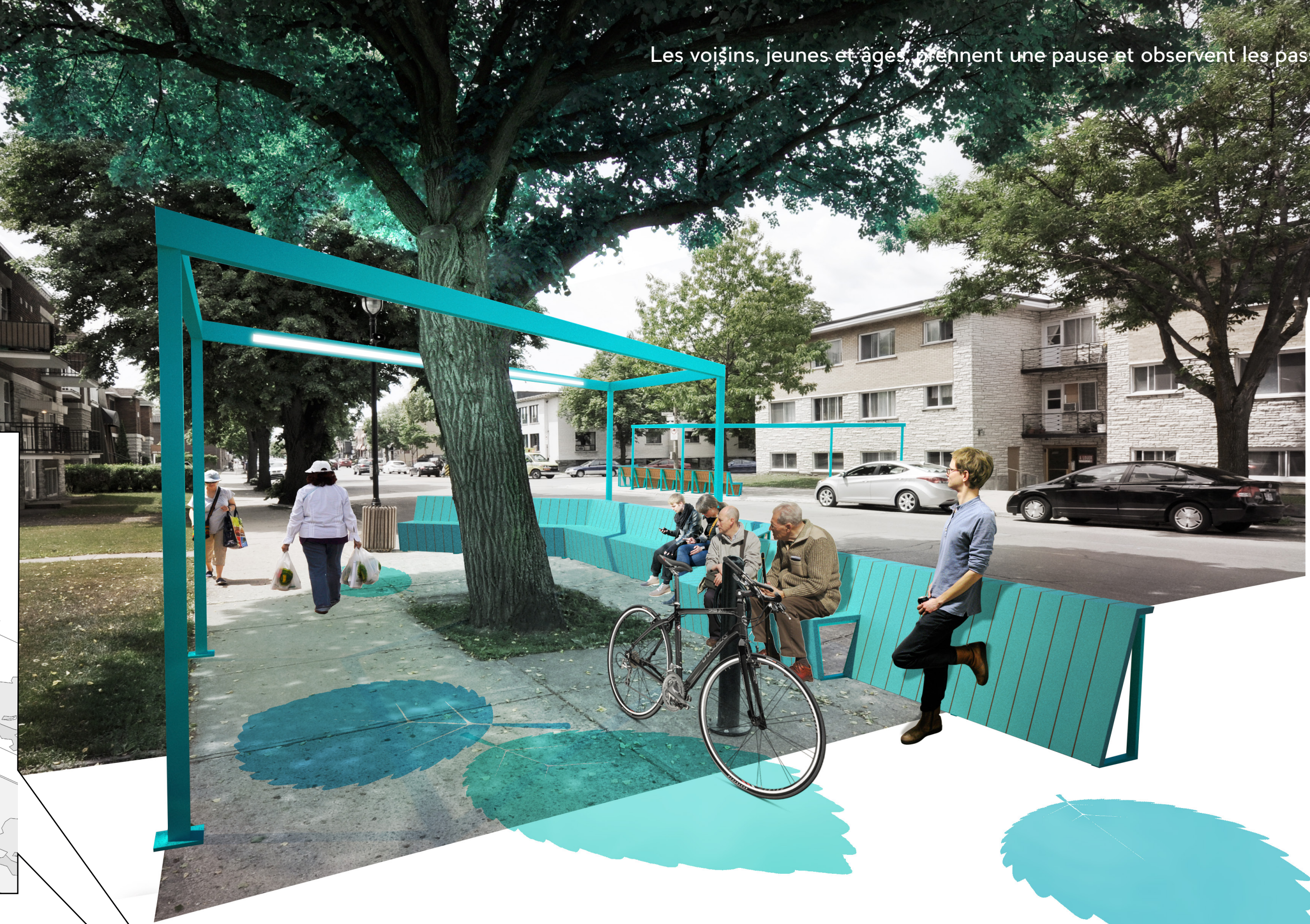
Les voisins, jeunes et âgés, prennent une pause et observent les passants.

offre une extension des activités de voisinage. Ses aménagements accueillent les conversations spontanées comme la pause-café matinale.