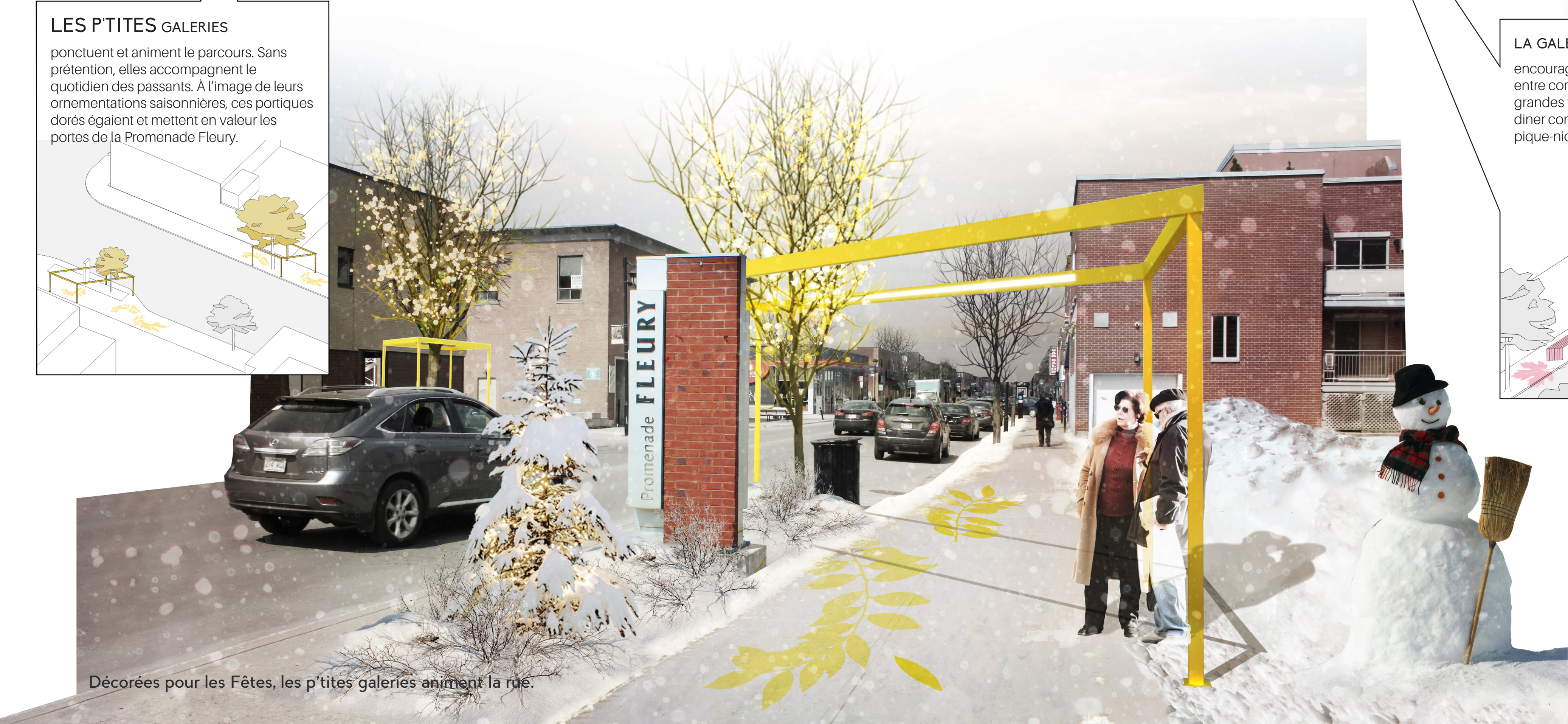
Décorées pour les Fêtes, les p'tites galeries animent la rue.

LA GALERIE GOURMANDE encourage le partage et l'échange entre commerçants et résidents. Ses grandes tables permettent une pause diner confortable ou la levée d'un pique-nique dominical improvisé.