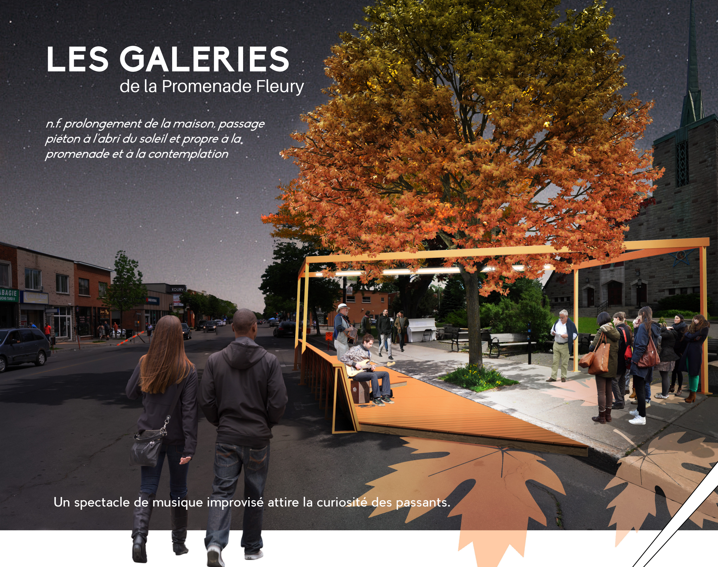
Un spectacle de musique improvisé attire la curiosité des passants.

n.f. prolongement de la maison, passage piéton à l'abri du soleil et propre à la promenade et à la contemplation