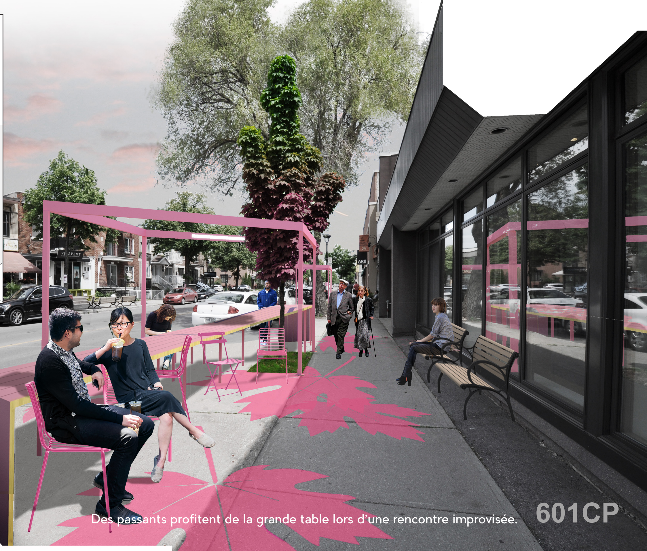
Des passants profitent de la grande table lors d'une rencontre improvisée.