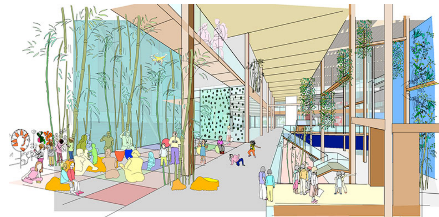
Le parc intérieur, adjacent à la triple hauteur, surplombe l'aire de prestation famille