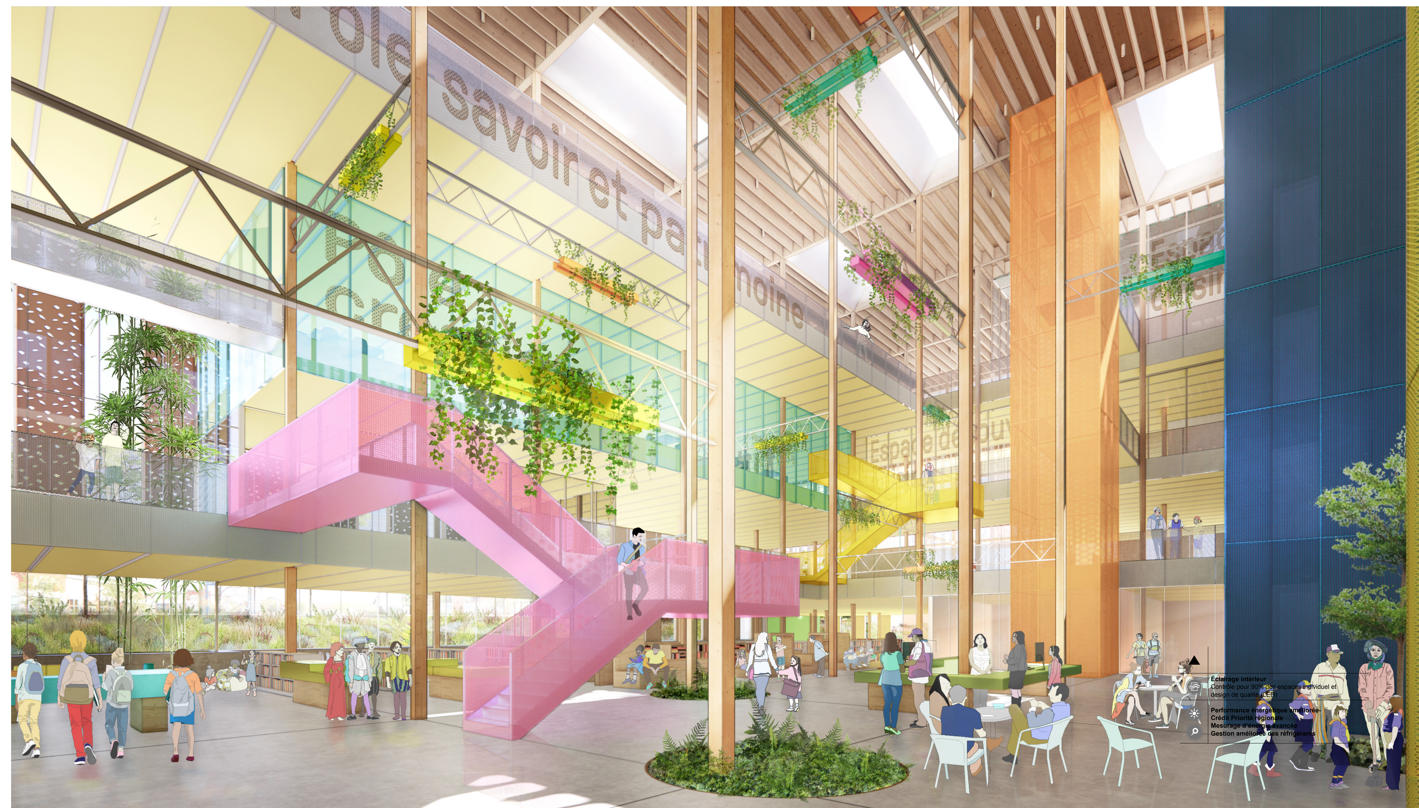
LA PERSPECTIVE DE L'ATRIUM L'ambiance conviviale et syvêtre du boisé se prolonge au cœur de l'édifice dans un atrium lumineux et végétalisé : le secteur Carrefour offre un vaste espace animé où il fait bon flâner librement. Son atmosphère forestière est animée par les parcours ludiques, intuitifs et fluides des passerelles, des escaliers et des ascenseurs colorés.

Eclairage intérieur Contrôle des flux Généraliste Génie de qualité Performance énergétique Crédit Prisme région de Maitrise d'œuvre Gestion améliorée des refroidissements