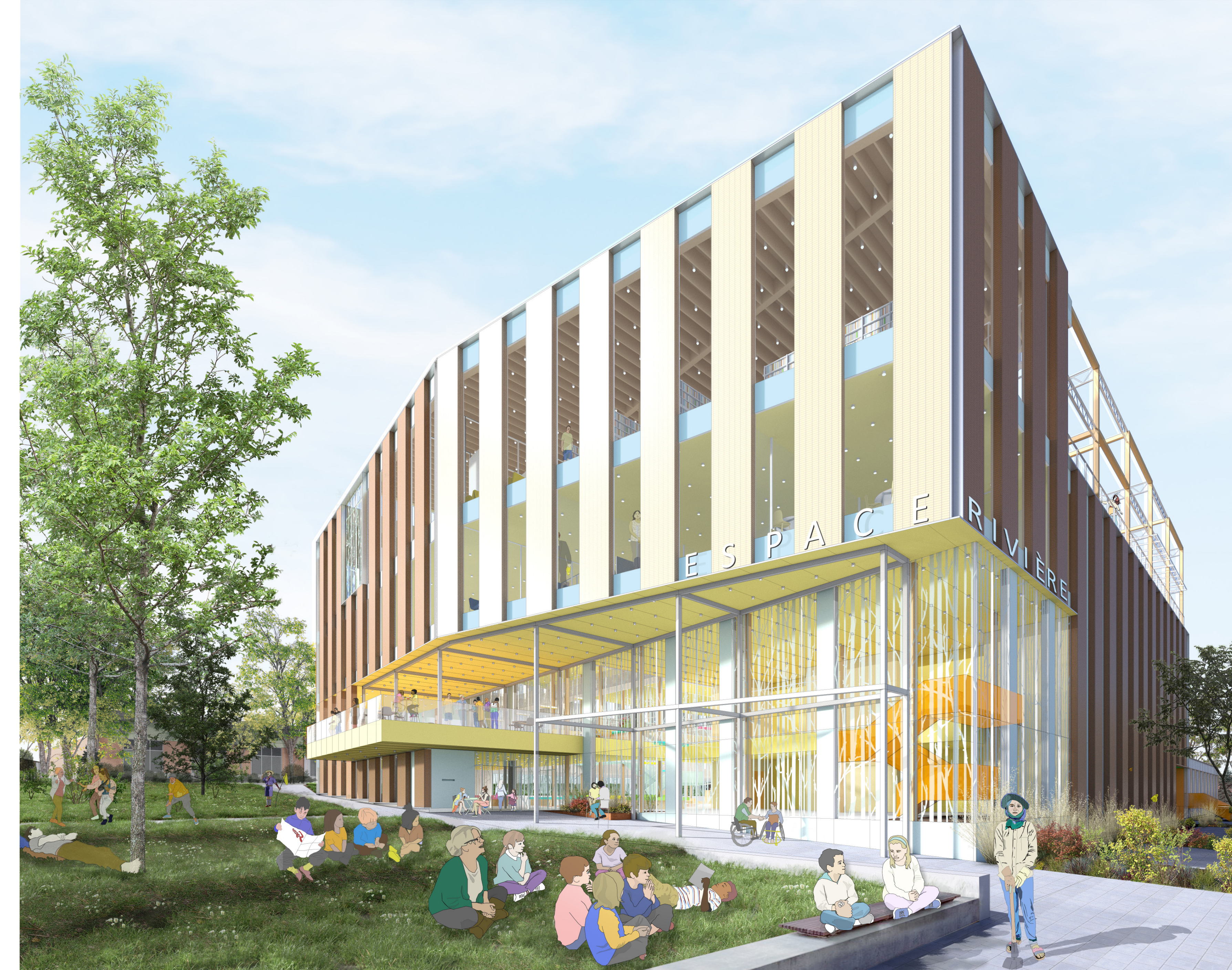
LA PERSPECTIVE VUE DU BOISÉ On accède au rez-de-jardin à partir du boisé en passant entre l'agora naturelle et le foyer de la salle de spectacle, suivant l'ancien « chemin des désirs ». La terrasse du café surplombe l'entrée qui mène à l'espace Famille et au cœur de l'espace Carrefour.