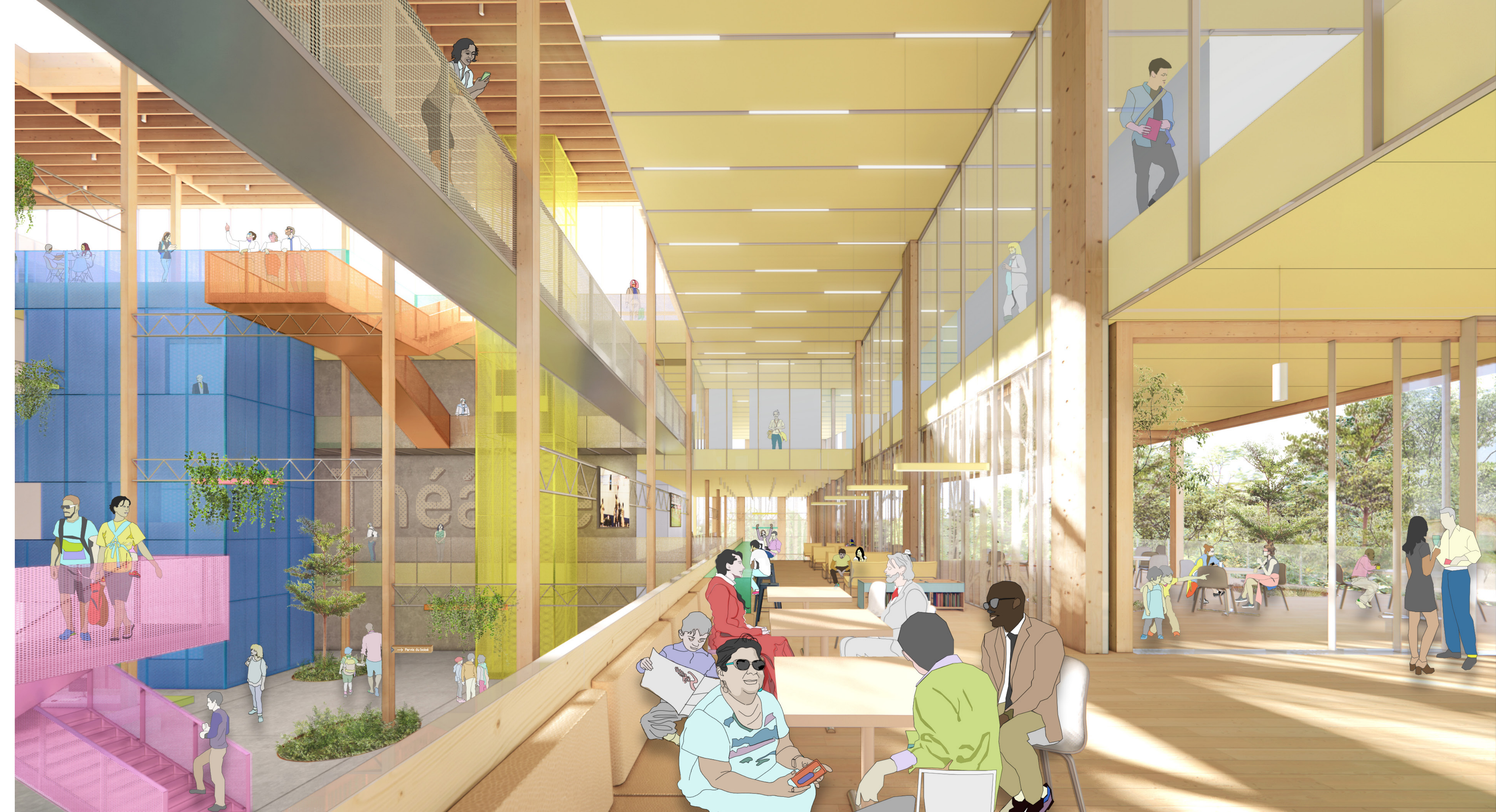
LA PERSPECTIVE SUR LE CAFÉ Entre la canopée du boisé et l'atrium, le café, le salon d'actualités et leur terrasse offrent un espace paisible et lumineux.