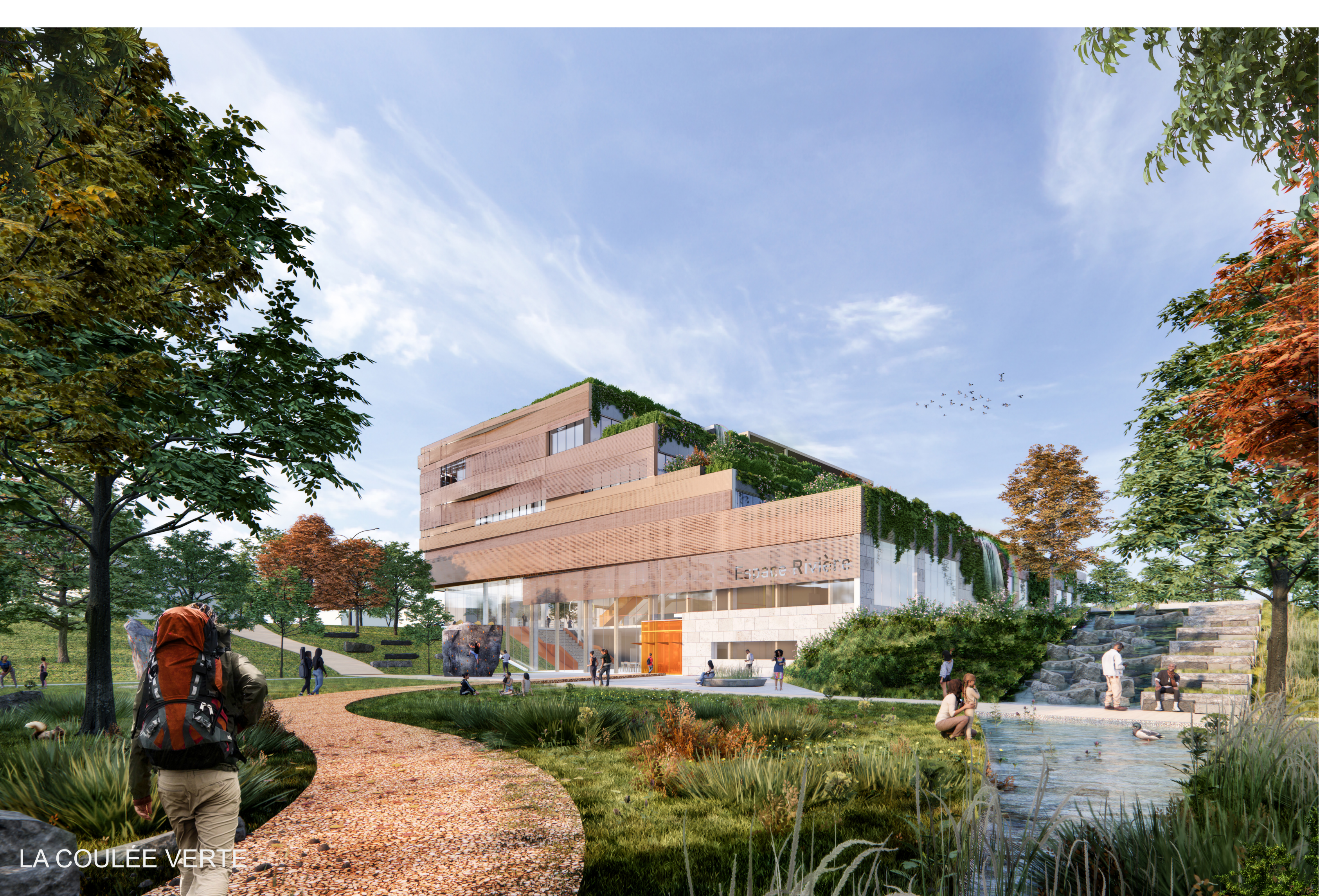
LA COULÉE VERTÉ