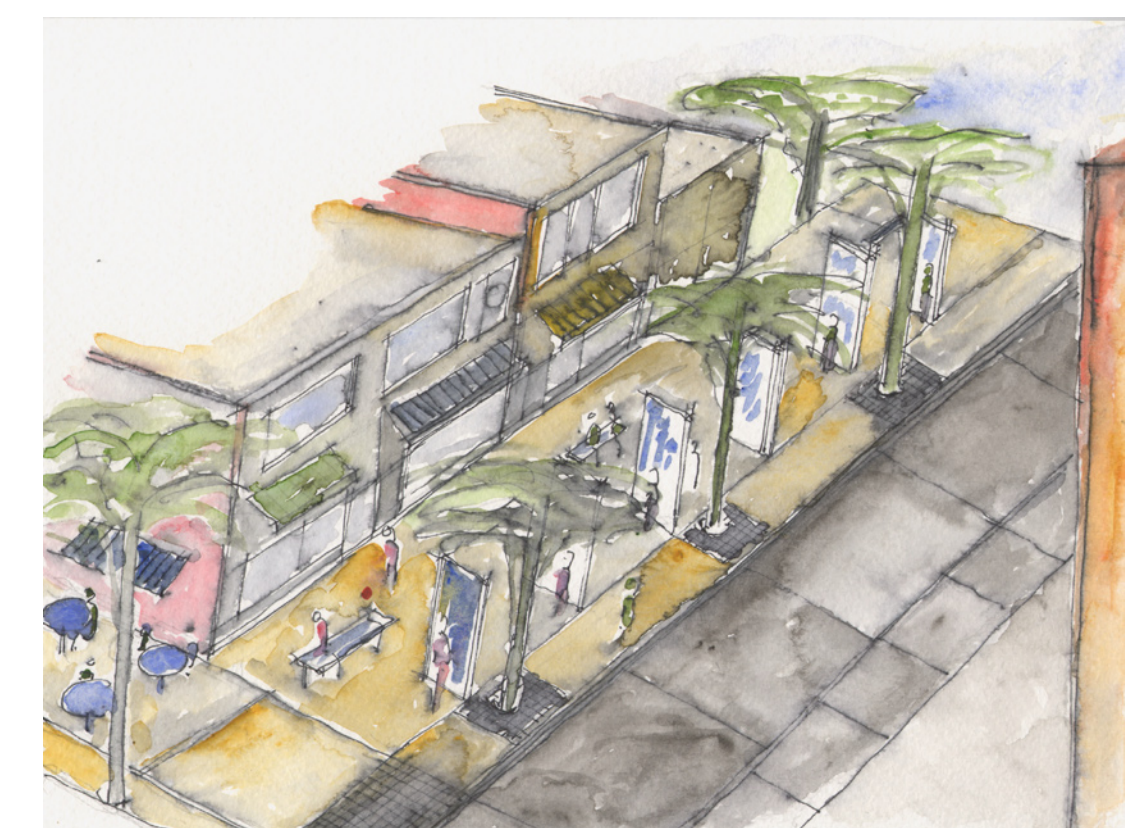
Place aux cultures