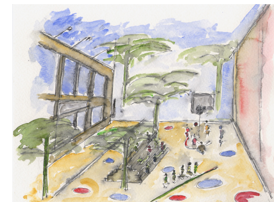
Place aux jeunes