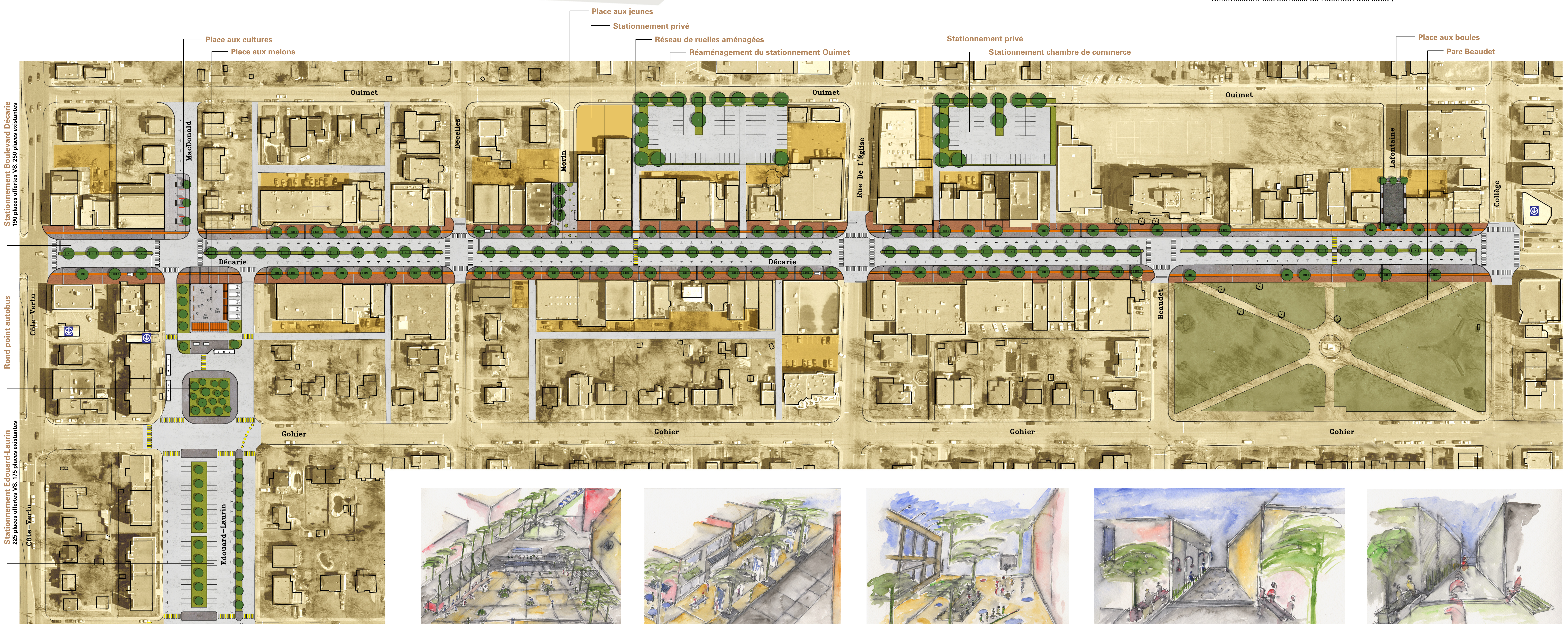
Revitalisation du Boulevard Décarie - entre le boulevard de la Côte-Vertu et la rue du Collège 1:750