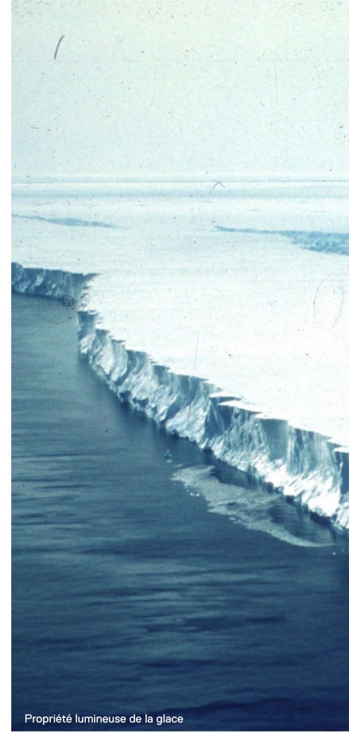
Propriété lumineuse de la glace