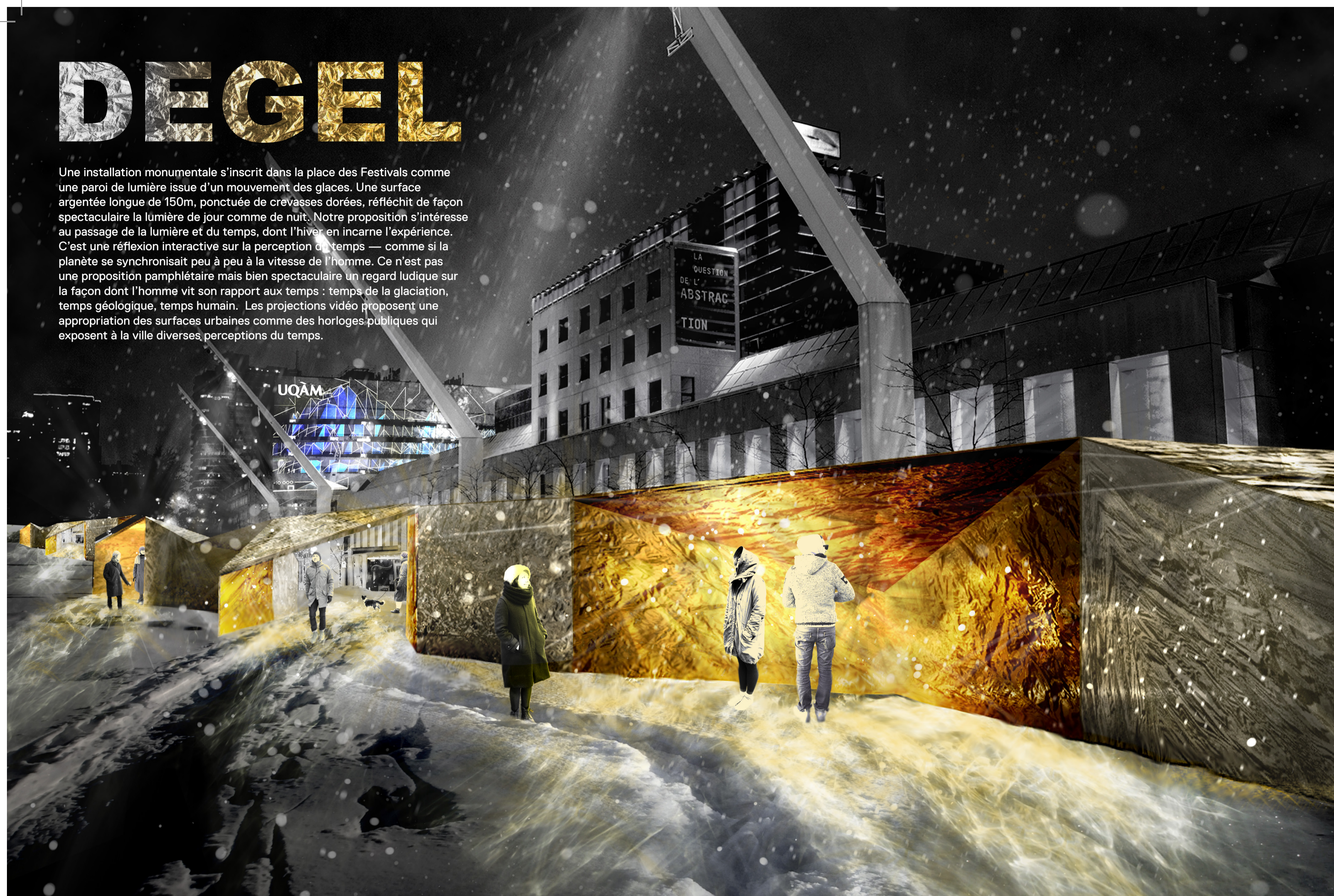
Module lunaire avec un revêtement en mylar doré : une durabilité à toute épreuve

Une installation monumentale s'inscrit dans la place des Festivals comme une paroi de lumière issue d'un mouvement des glaces. Une surface argentée longue de 150m, ponctuée de cravasses dorées, réfléchit de façon spectaculaire la lumière de jour comme de nuit. Notre proposition s'intéresse au passage de la lumière et du temps, dont l'hiver en incarne l'expérience. C'est une réflexion interactive sur la perception du temps — comme si la planète se synchronisait peu à peu à la vitesse de l'homme. Ce n'est pas une proposition pamphlétique mais bien spectaculaire un regard ludique sur la façon dont l'homme vit son rapport aux temps : temps de la glaciation, temps géologique, temps humain. Les projections vidéo proposent une appropriation des surfaces urbaines comme des horloges publiques qui exposent à la ville diverses perceptions du temps.