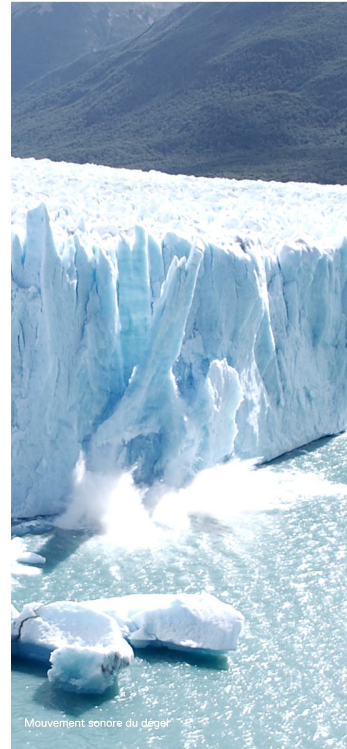
Mouvement sonore du degel