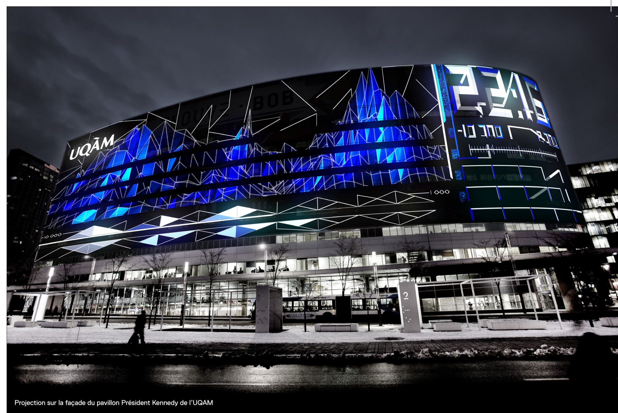
Projection sur la façade du pavillon Président Kennedy de l'UQAM