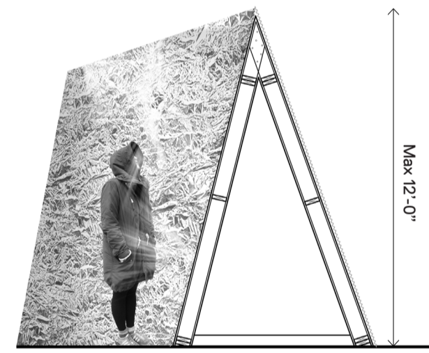
Profil type des parois avec le Mylar argenté