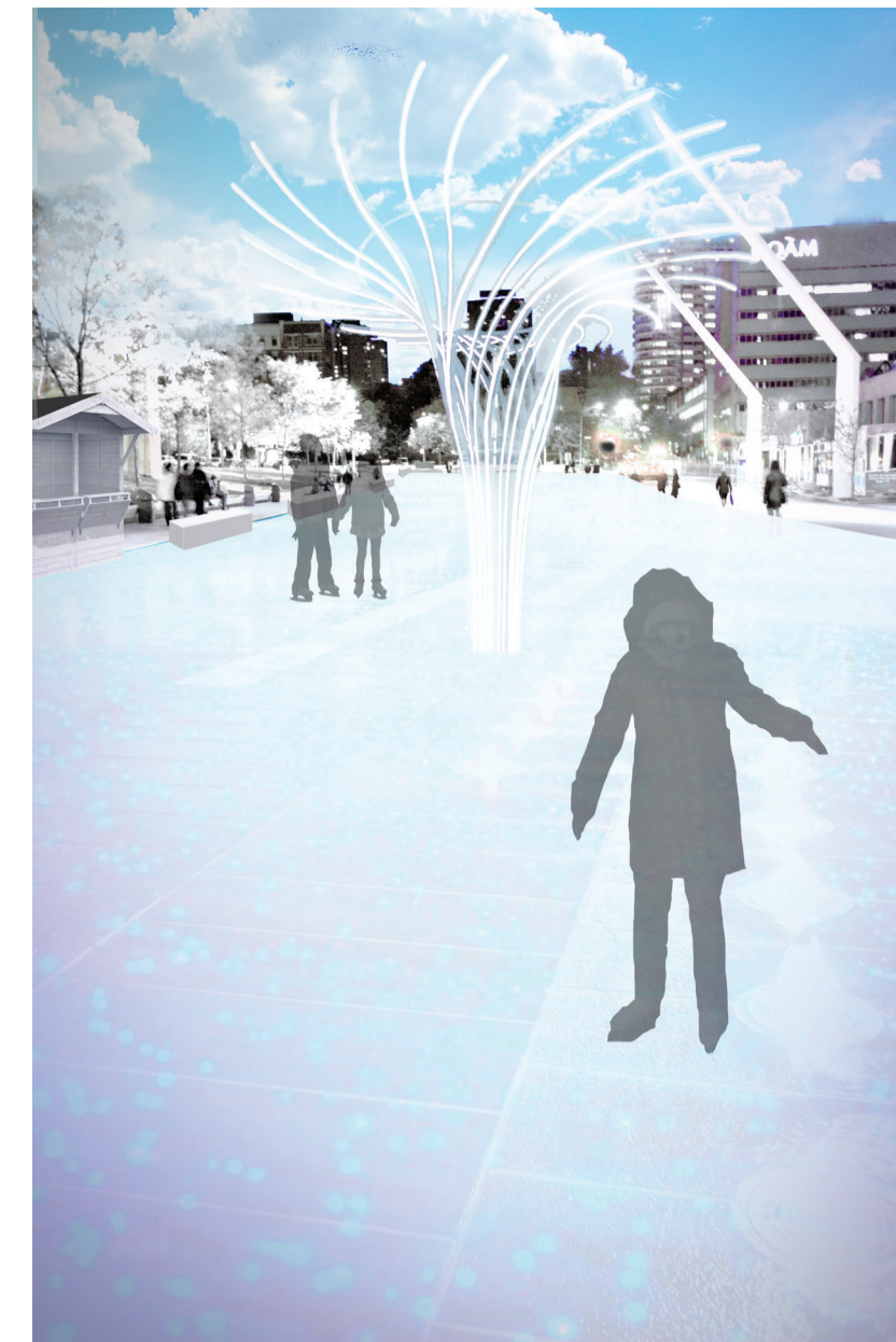
Représentation de l'activation de la Place des Festivals en journée.

En journée, l'arbre de fibre optique répond en transparence et reflets selon la lumière naturelle.