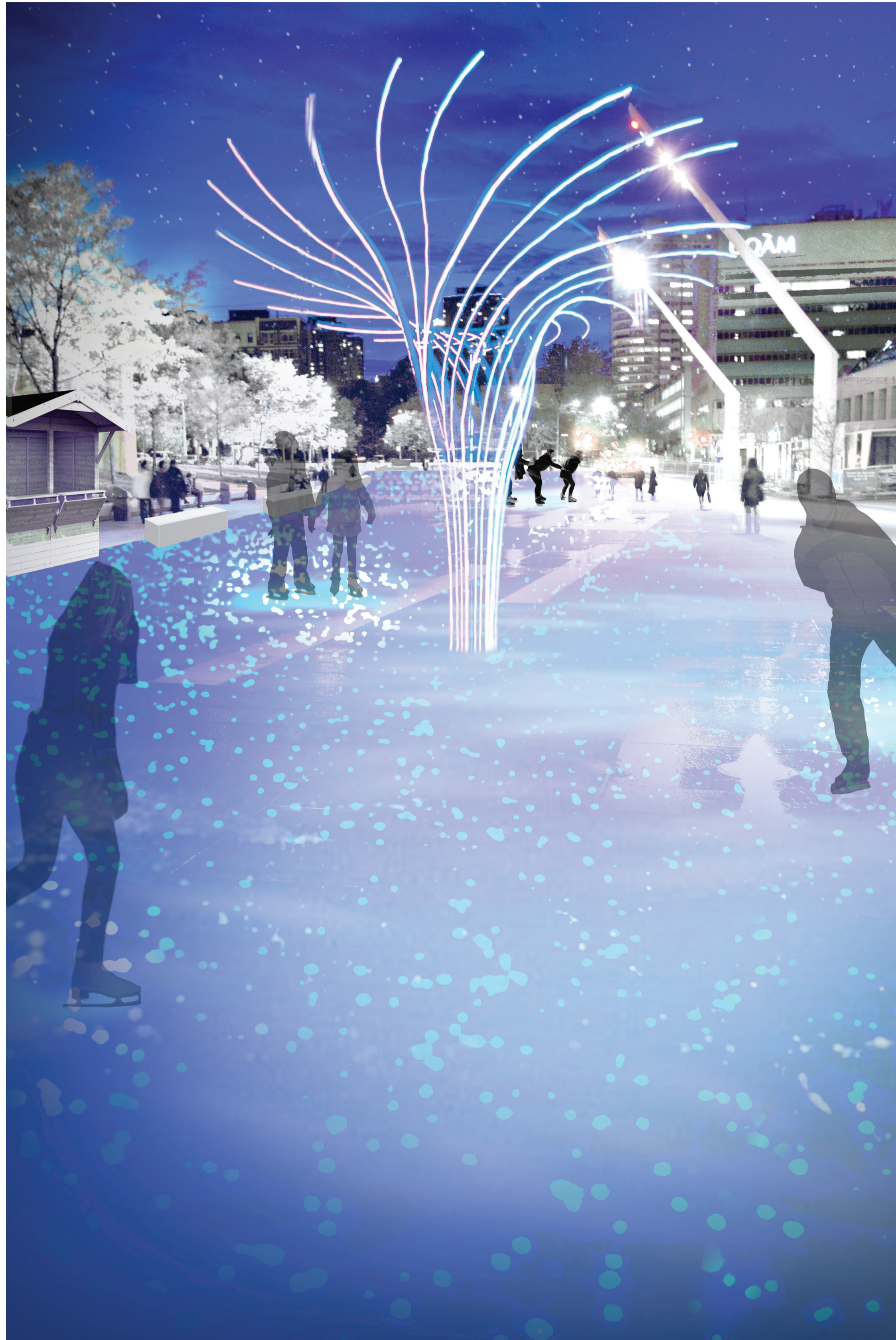
Au passage des patineurs, la glace s'illumine sous ses pieds